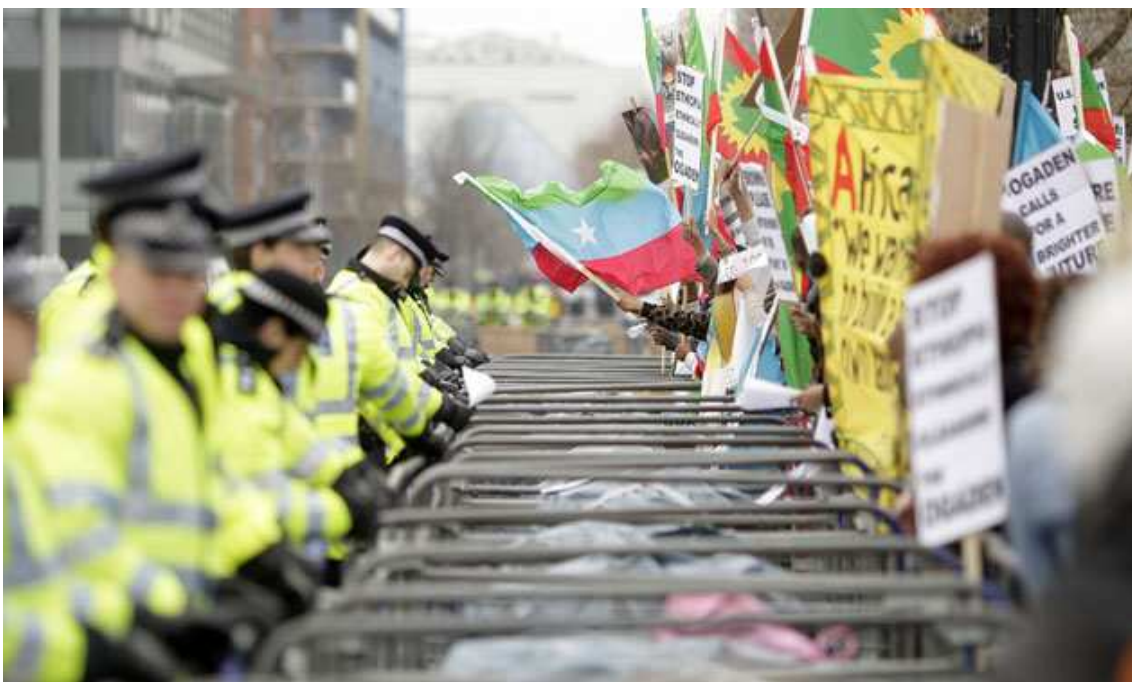
Figura 3: Polícia patrulha barreiras em torno de manifestantes perto do ExCeL Centre

Devem partir desta base os desdobramentos da atuação do Estado. Um Estado que não circunscreva grupos minoritários a espaços considerados válidos, que permita a expressão da pluralidade entre os sujeitos e reconheça um mundo dinâmico, em permanente estado de construção. Mas na busca pelo desenvolvimento, Estado e sujeito ainda se encontram em lados opostos (Figura 3).