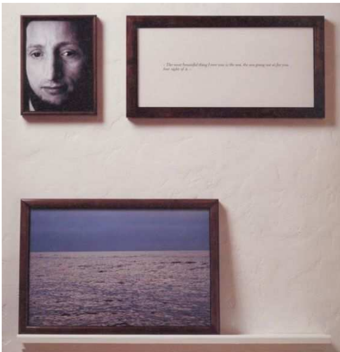
Figura 2: The Sea - Projeto The Blind

"The most beautiful thing I ever saw is the sea, the sea going out so far you lose sight of it.."