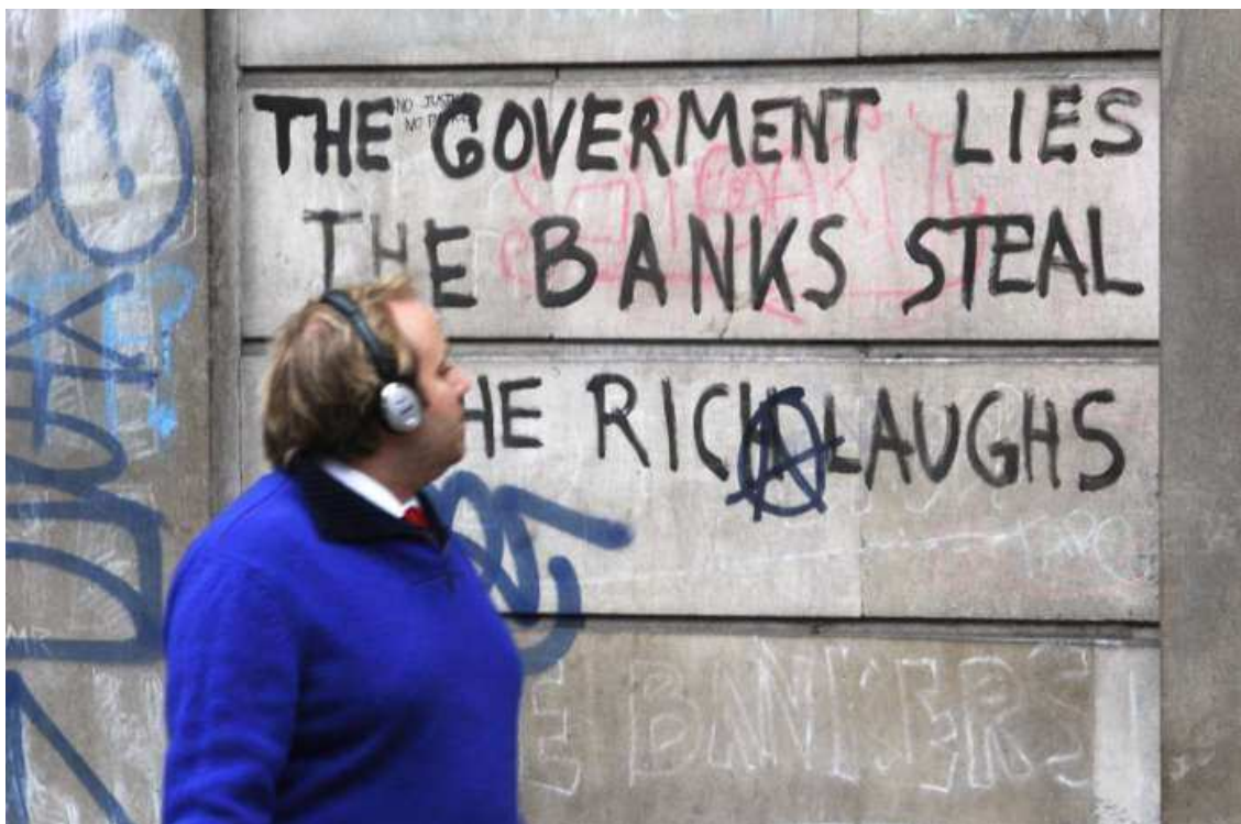
Figura 4: “O Governo (sic) mente, os bancos roubam, os ricos riem”