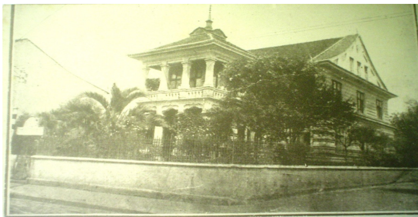
FIGURA 1 – PALACETE JOSÉ LOUREIRO 1920

A primeira sede do Internato do Ginásio Paranaense foi o Palacete José Loureiro 7 . Esse Palacete contava com dois pavimentos e um sótão, não era adequado para abrigar uma instituição de ensino como sugere a figura 1, motivo pelo qual recebeu reparos e adaptações que resultaram em instalações compatíveis para atender aos alunos internos.