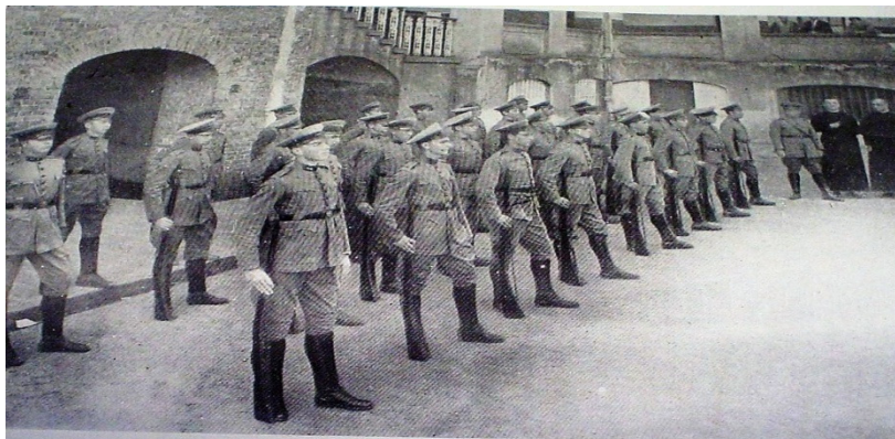
FIGURA 4 – CONCLUSÃO DO CURSO – INSTRUÇÃO PRÉ-MILITAR – 1929

A figura número 4 é uma foto tirada, por ocasião da formatura dos alunos, possivelmente utilizada com o objetivo de fazer propaganda dos cursos ofertados pela instituição.