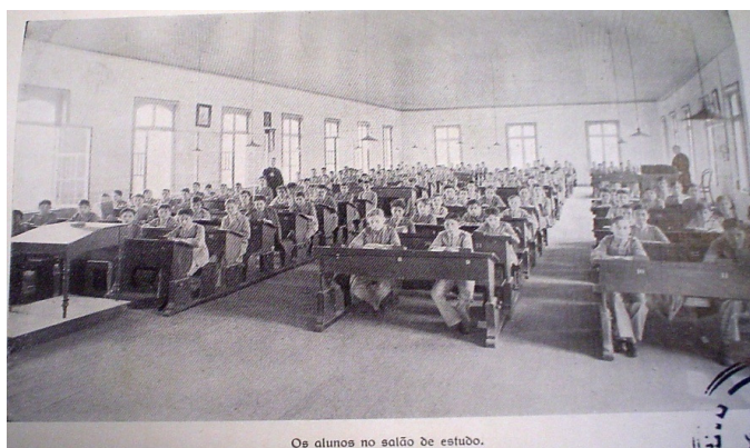
FIGURA 5 – SALÃO DE ESTUDO - 1929

Os usos do tempo no Internato do Ginásio Paranaense eram rigidamente esquadrihados, os alunos eram regulados por horários fixos e segundo os relatórios da instituição, nada flexíveis. A rotina iniciava por volta das seis horas da manhã ao despertar. Das seis as sete desciam até a capela para a primeira reza do dia, posteriormente iam ao refeitório para tomar café. No primeiro horário de aula, ou seja, às sete horas de segunda a sábado, os ginasianos tinham aulas de ginástica. Às oito horas iniciavam as demais aulas da grade curricular, sendo que as mesmas encontravam-se distribuídas no período da manhã e da tarde. Os horários das aulas eram de 50 minutos de duração e no máximo 10 minutos de intervalo entre uma aula e outra.