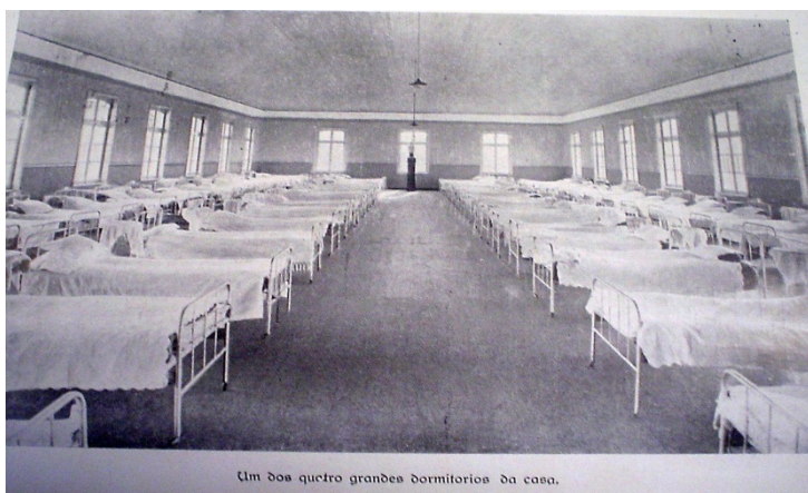
Um dos quatro grandes dormitórios da casa. FIGURA 6 – DORMITÓRIO DOS ALUNOS GRANDES -1927 FONTE: Estatuto do Internato do Ginásio Paranaense