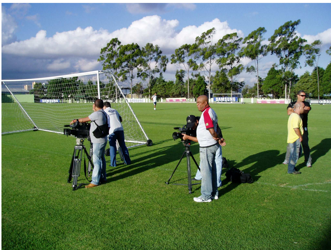
Ilustração 9 64

treinamento, já enviam seu texto para que seja imediatamente publicado em sítios digitais da rede mundial de computadores 63 .