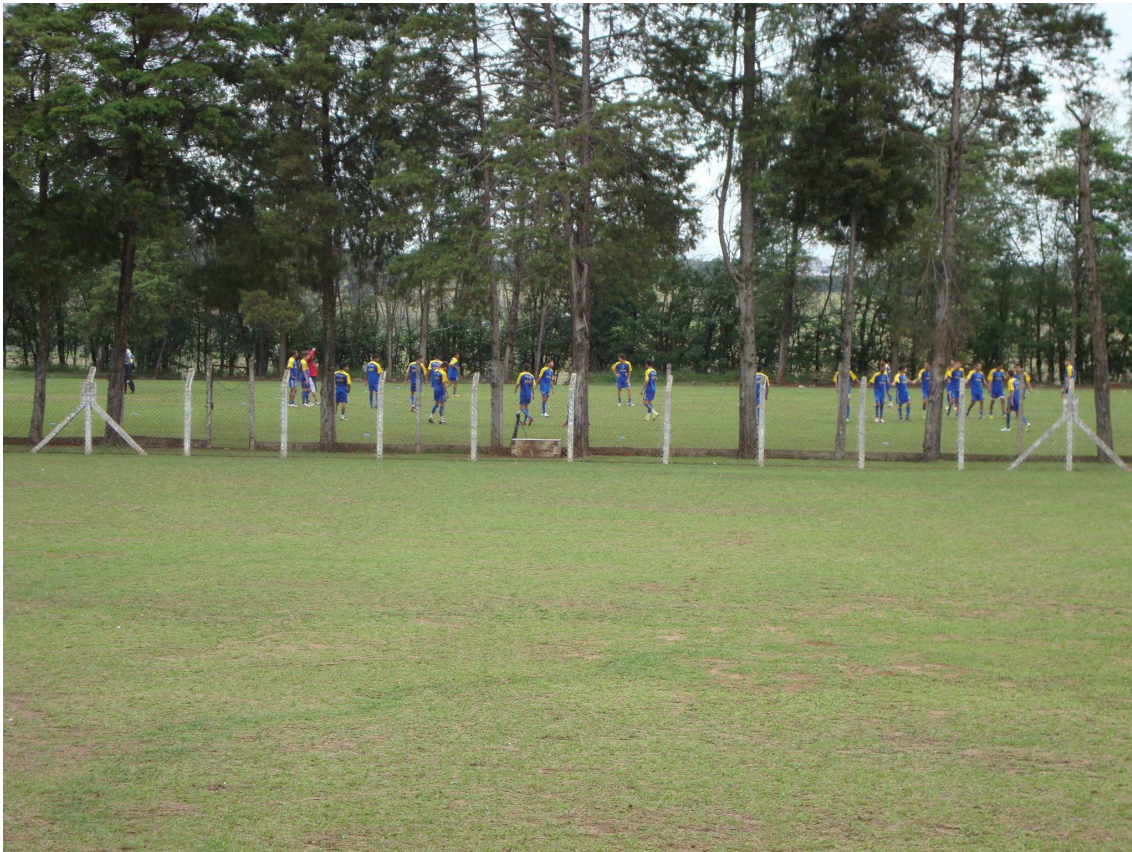
Ilustração 1 37

As competições dos times amadores, ou seja, dos times sub-17 e sub-20 possuem um caráter peculiar em relação às competições profissionais. Por atraírem muito menos público que um torneio profissional, as arquibancadas do estádio Luisão, em São Carlos, apresentaram-se, na maioria das vezes, praticamente vazias, mesmo com entrada franca. Era comum que apenas a parte coberta do estádio, responsável por abrigar não mais que 15% da capacidade total, recebesse público. E grande parte deste era formado pelos familiares e amigos dos jogadores, além dos atletas que não estavam inscritos para os jogos e assistiam à partida dali.