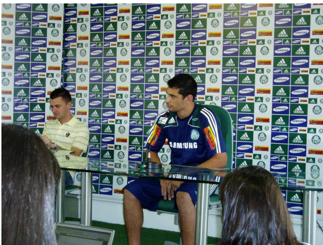
Ilustração 7 61