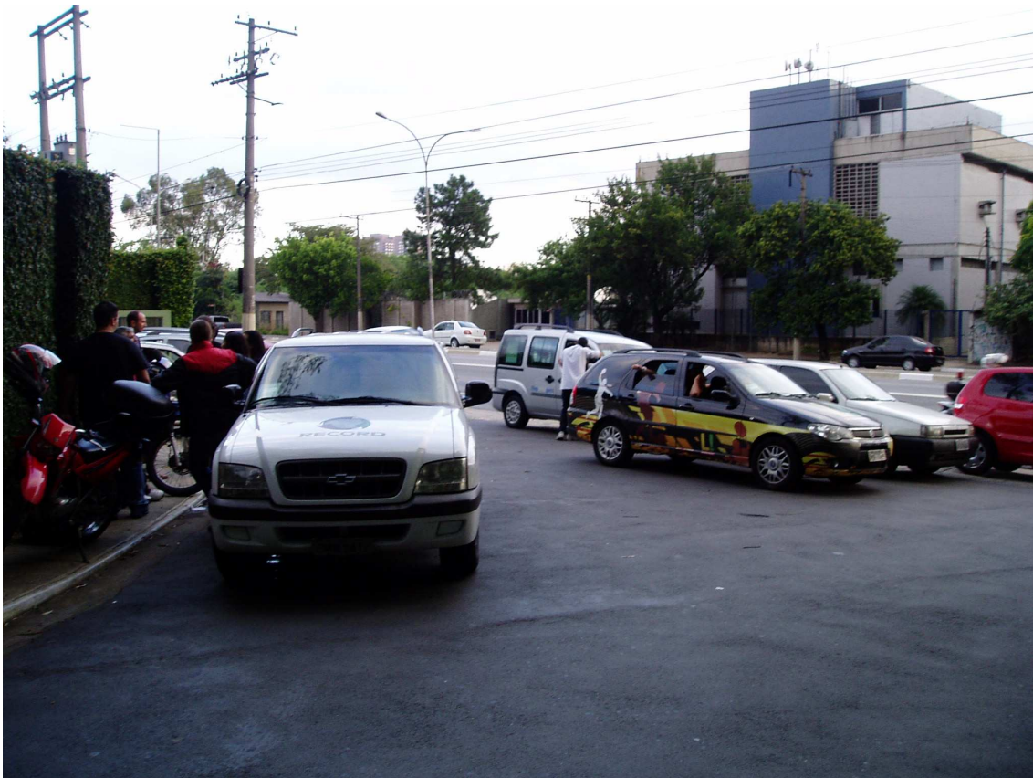
Ilustração 8 62

O fotógrafo Ari Ferreira, do diário esportivo Lance! relatou-me que o trabalho se dá da seguinte maneira: o tipo de foto depende de prévio trabalho realizado ainda na redação do jornal. Junto com repórteres e editores, os profissionais da imprensa preparam parte da matéria que será escrita para ocupar as páginas do jornal do dia seguinte. Dessa forma, as imagens registradas assim que adentram o CT são imediatamente enviadas à redação da sala de imprensa do local, via internet. Feito isso, retornam ao campo para mais registros, até que o trabalho se complete. Além disso, há vários tipos de mídia que acompanham o cotidiano do clube. Sendo assim, os trabalhos são variados: há repórteres de televisão que preparam uma matéria que será transmitida apenas no dia seguinte, como também jornalistas de internet que, ao término do