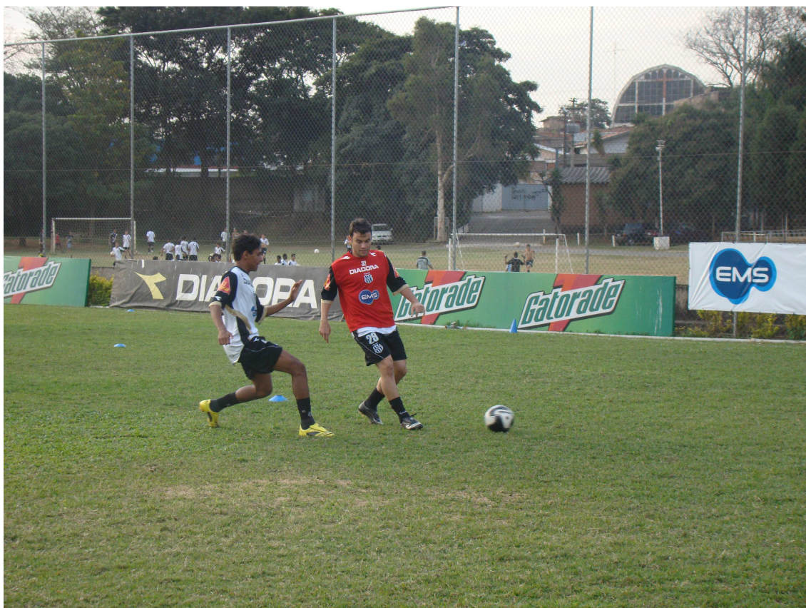
Ilustração 3 42

campo de areia ao lado. Ao final do treino, como já tinha percebido em minha primeira passagem no local, os garotos se postaram atrás das grades que separam os dois campos e, dali, conversavam e brincavam com os atletas profissionais, que se alongavam no gramado após a atividade daquela tarde. Mais uma vez, a busca pelo dom futebolístico era reforçada pelo contato direto com aqueles que já o detém.