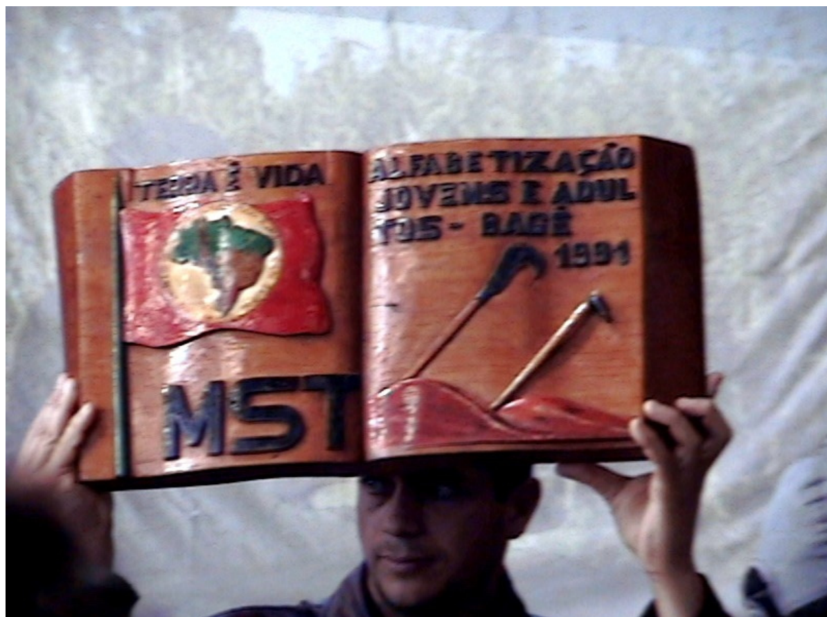
FOTO 8: MISTICA DO MST - Encenação da mística em assembléia geral dos assentados, no Ginásio Paulo Freire, no Assentamento 15 de Junho em Candiota. Foto: Fátima Moraes Garcia (2008).