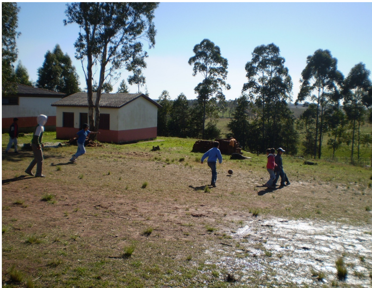
FOTO 2: ESCOLA OITO DE AGOSTO - Alunos jogando futebol durante o intervalo das aulas.