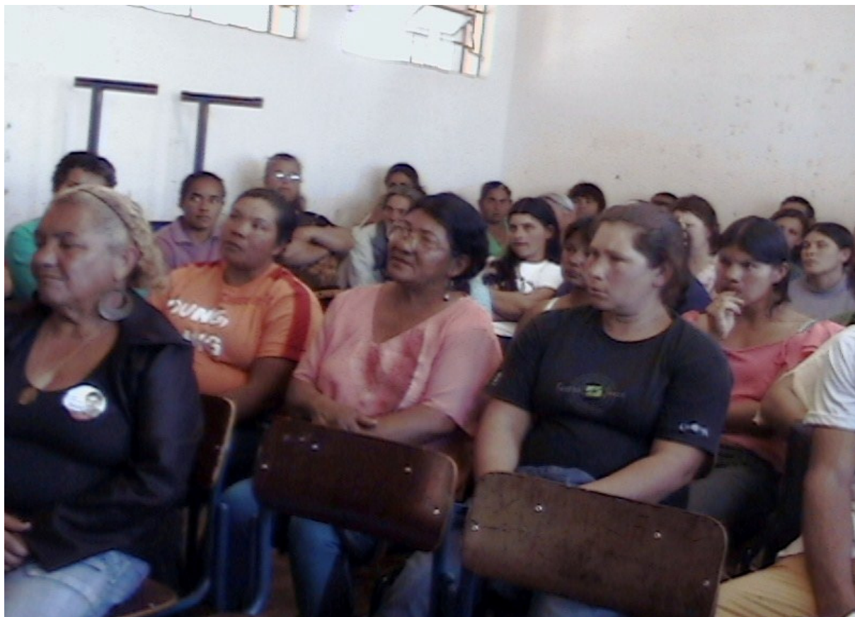
FOTO 6: REUNIÃO DE PAIS - Reunião de pais com a diretoria e professores da Escola Oito de Agosto.