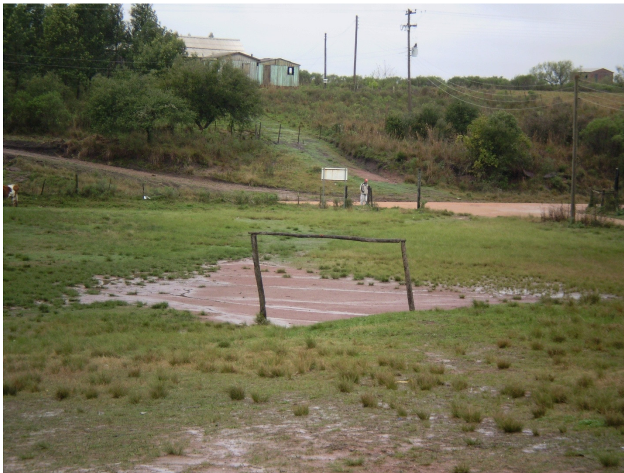
FOTO 3: CAMPO DE FUTEBOL DA ESCOLA - Campo de futebol da escola, em dia de chuva.