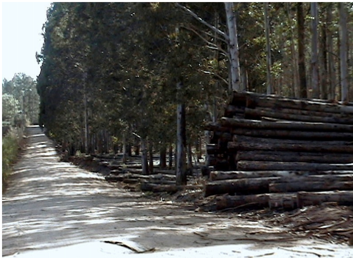
FOTO 7: PRODUÇÃO DE EUCALÍPTOS - Produção de eucalíptos na estrada de acesso de Dario Lassance (município de Candiota) aos assentamentos do MST.