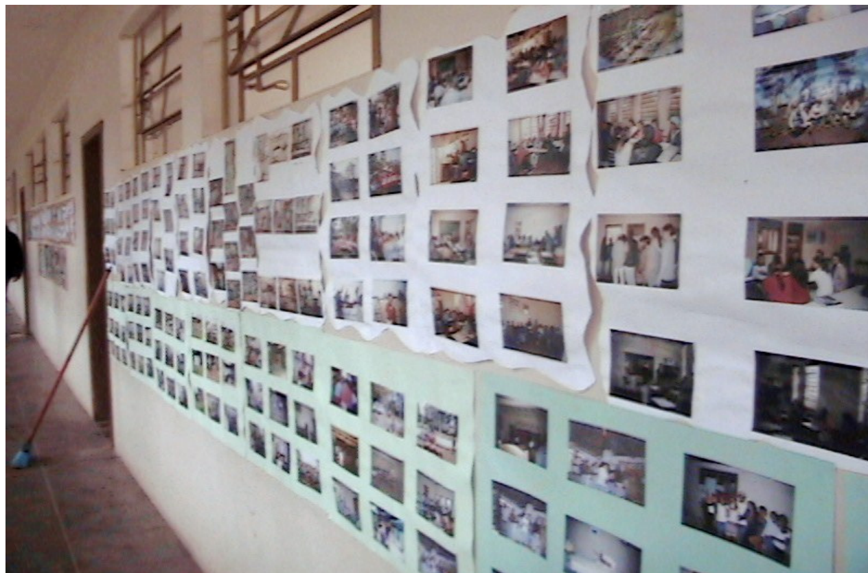
FOTO 4: EXPOSIÇÃO DE FOTOS DA ESCOLA - Exposição de fotos da escola Oito de Agosto no II Encontro Sobre Educação do Campo. Foto: Fátima Moraes Garcia (2008).