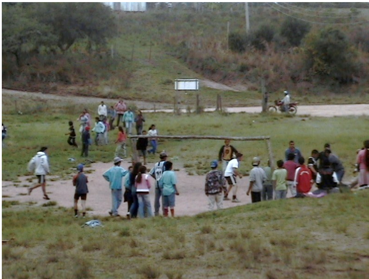
FOTO 5: ALUNOS NO CAMPO DE FUTEBOL - Alunos da Escola Oito de Agosto no horário de intervalo, brincando e jogando futebol.