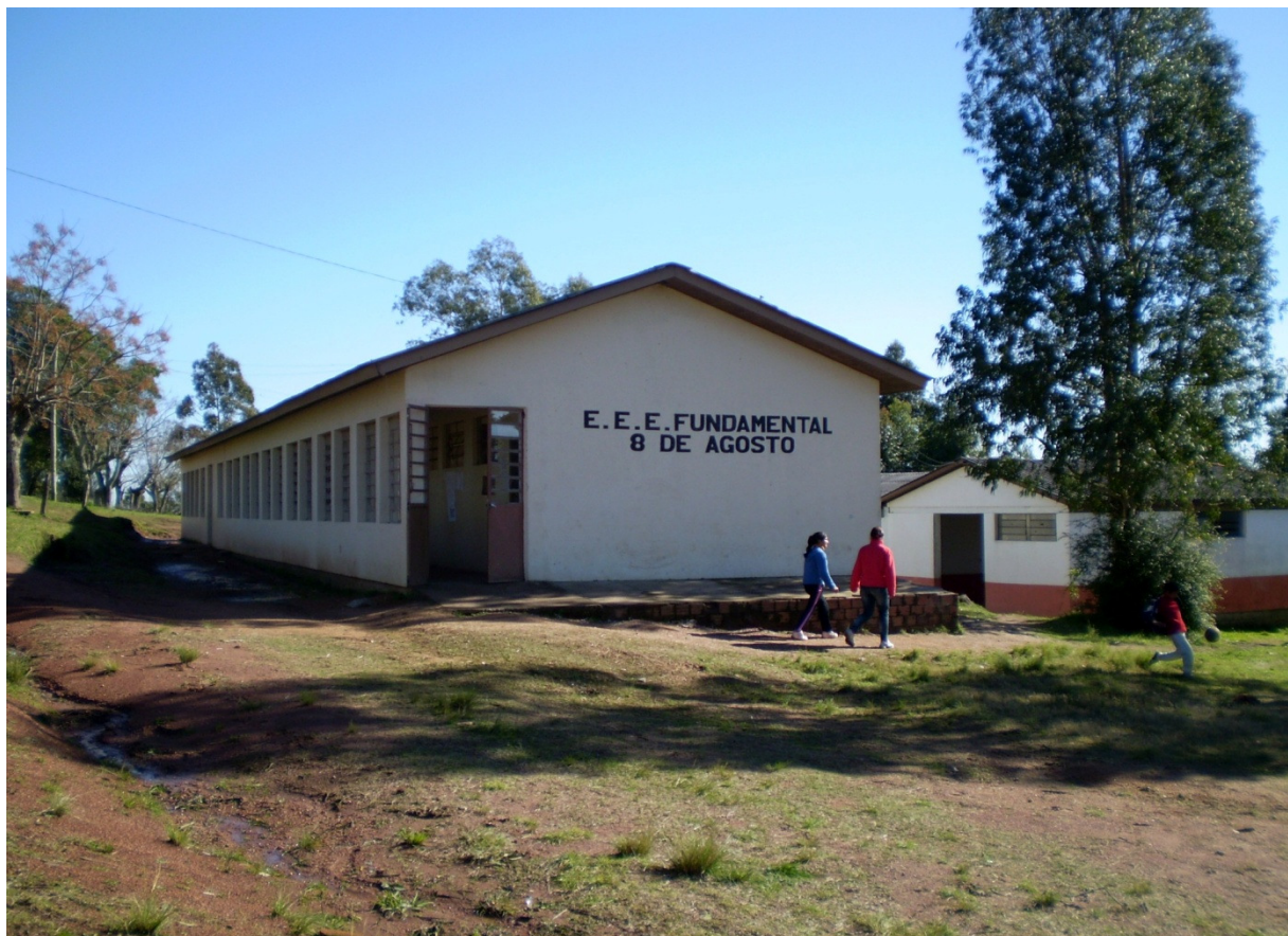
FOTO 1: ESCOLA - Horário de intervalo das aulas, alunos no pátio da escola. Foto: Fátima Moraes Garcia (2008).