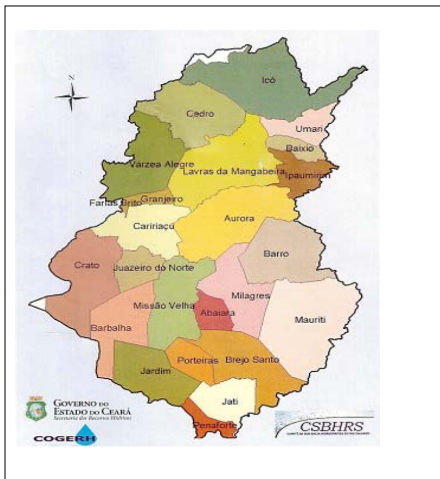
Figura 3 – Mapa dos municípios que compõem a Sub-Bacia Hidrográfica do Rio Salgado.

A pesquisa foi desenvolvida no período de março a outubro de 2008, no contexto da Sub-Bacia Hidrográfica do Rio Salgado, que é composta por vinte e três municípios do sul - leste do Ceará, conforme Figura 03.