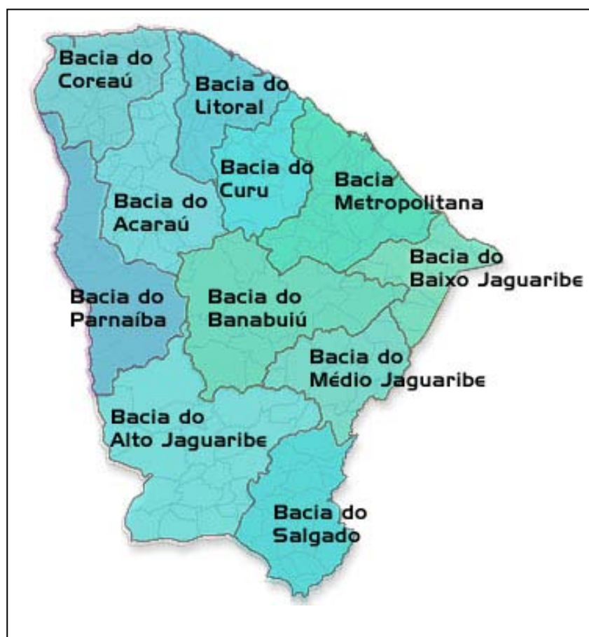
Figura 01 – Mapa das Bacias Hidrográficas do Estado do Ceará.

A Bacia do Rio Salgado apresenta importância singular por abranger municípios da região de maior população do Cariri cearense (Crato e Juazeiro do Norte) com a maioria urbana que tem seu sistema hidrológico originando-se na Chapada do Araripe. Esta condição envolve 23 municípios do Sul-leste do Ceará, com vistas a uma gestão mais abrangente dos recursos hídricos do Cariri. Compõe a sub-bacia os municípios de Abaiara, Aurora, Baixo, Barbalha, Barro, Brejo Santo, Caririaçu, Cedro, Crato, Granjeiro, Icó, Ipaumirim, Jardim, Jati, Juazeiro do Norte, Lavras da Mangabeira, Mauriti, Milagres, Missão Velha, Penaforte, Porteiras, Umari e Várzea Alegre (MELO e LOPES, 2005).