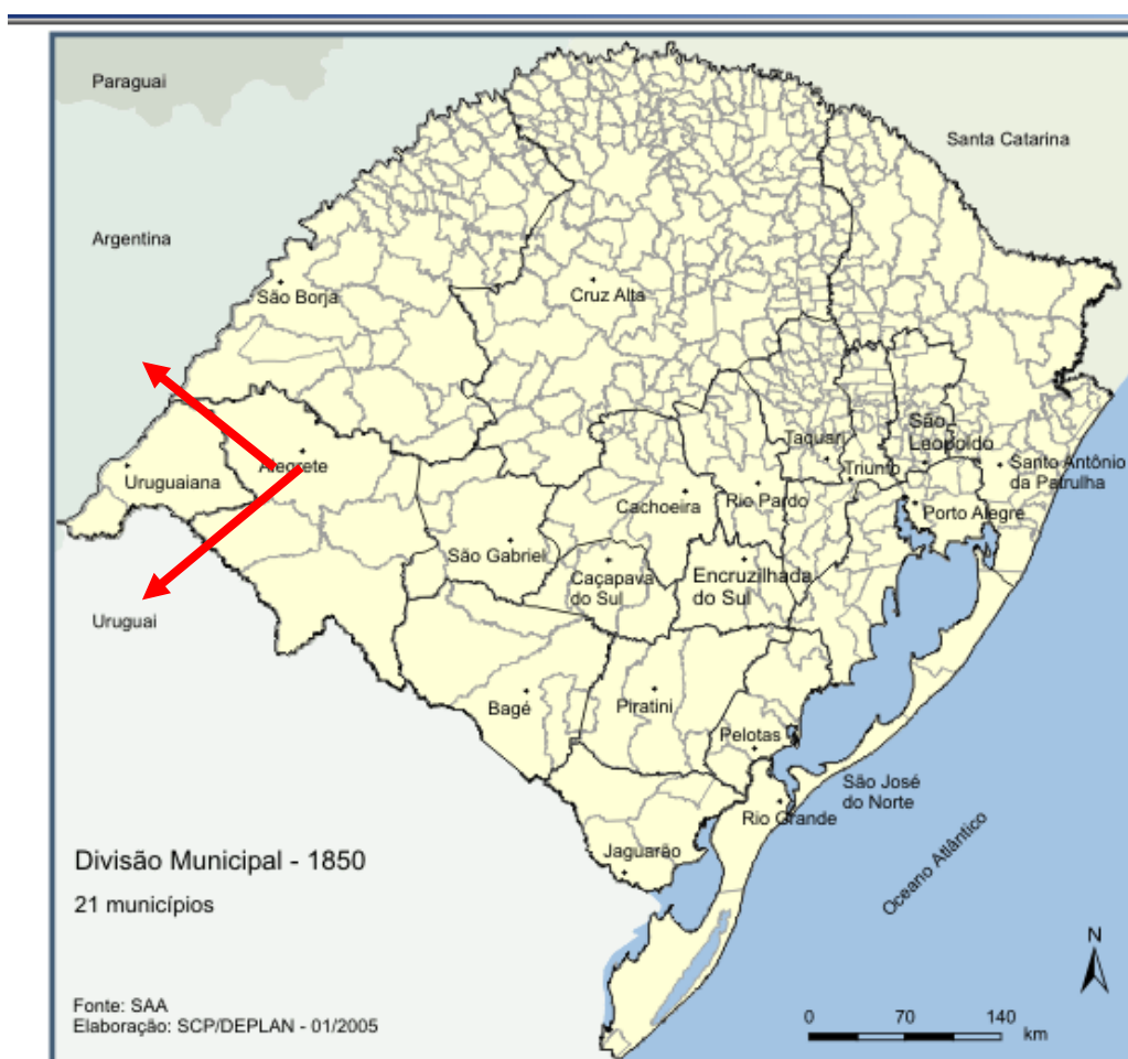
Mapa da Divisão Municipal do Rio Grande do Sul em 1850, mostrando a localização fronteiriça de Alegrete com Uruguai.

Foi utilizando-se desta justificativa que alguns escravos, com ajuda de seus curadores, apropriaram-se desse recurso jurídico e obtiveram suas liberdades na década de sessenta e setenta. Embora representem um número pequeno de escravos, essas cartas de alforria revelam aspectos de suas vidas sociais, permitindo-nos ir além do momento de tensão que culminou na abertura da ação, possibilitando que acompanhem histórias de escravos, reconstituindo trajetórias de vidas cativas e suas lutas pela alforria.