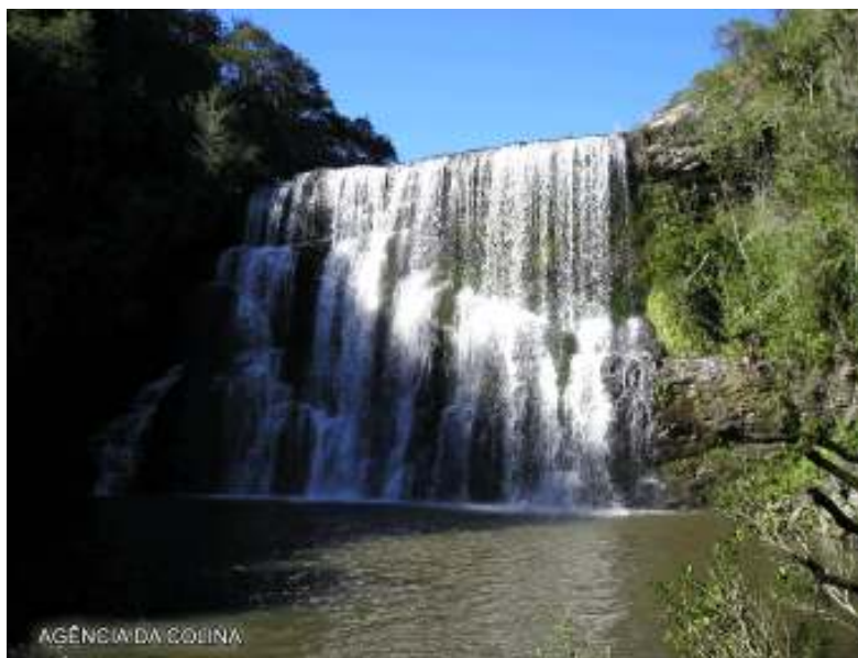
Figura 17 – Cachoeira do Tio França.

Situa-se a 3 quilômetros da cidade de Cambará do Sul. É onde o arroio Campo Bom despenca para formar uma das várias cachoeiras da região. A trilha apresenta 3 quilômetros de extensão (ida e volta) e não apresenta nenhum grau de dificuldade.