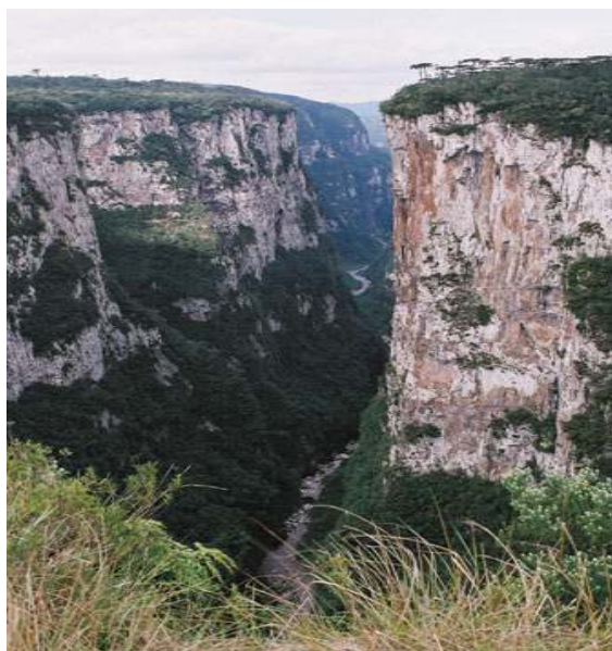
Figura 10 – Cânion Itaimbezinho – Parque Nacional Aparados da Serra.