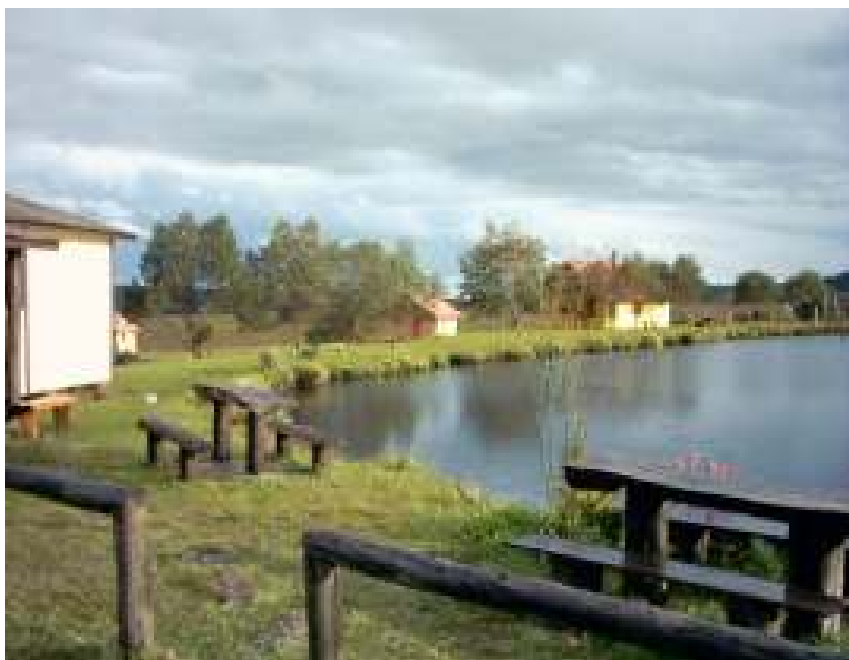
Figura 21 – Pousada Paradoiro da Fortaleza.