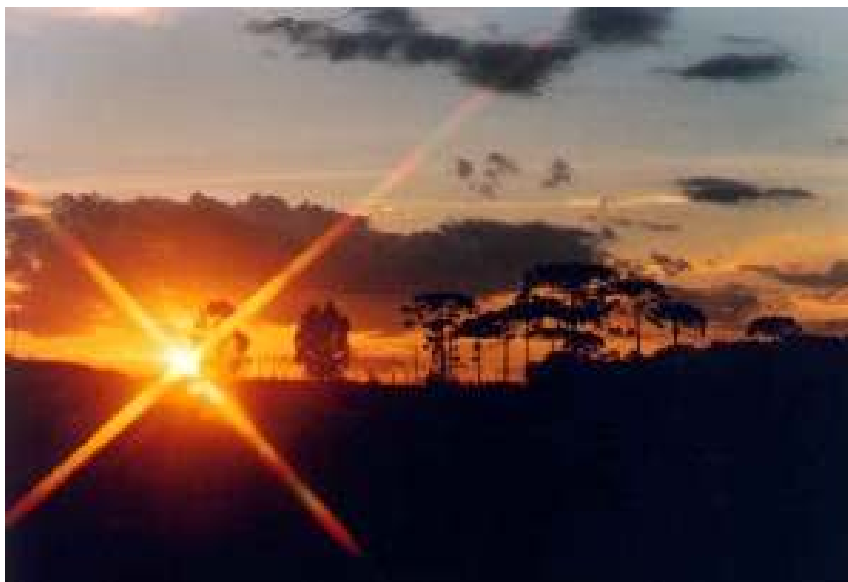
Figura 22 – Pôr-do-sol na Pousada Fazenda Pindorama.

Em contatos com a Prefeitura Municipal junto à Secretaria de Turismo da cidade de Cambará foi informado que está em elaboração o Plano-Diretor Ambiental do município objetivando maior atenção às áreas rurais. Não existem hoje no município programas municipais específicos voltados para o turismo rural, porém é meta do novo governo a implementação de políticas públicas municipais no incentivo a essa atividade.