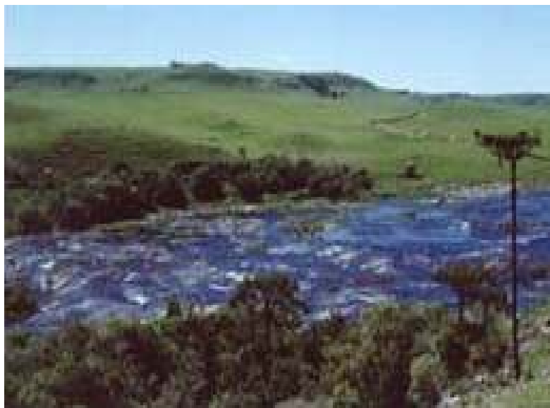
Figura 16 – Lajeado das Margaridas.