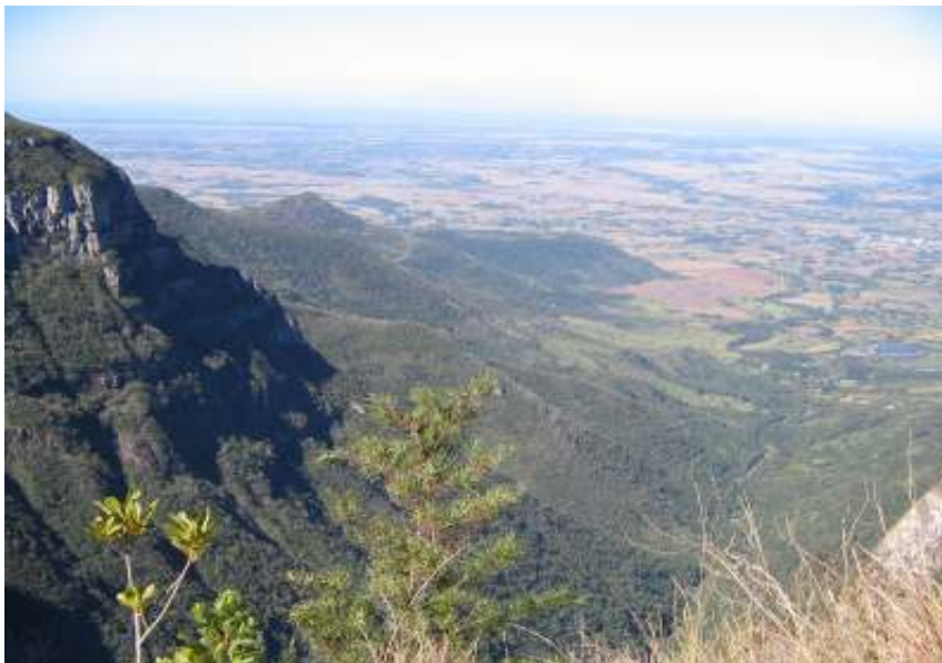
Figura 9 – Cânion Malacara.

horas, enfrentando alguns desafios como a viração e passando por rios e banhados na beira dos cânions é um verdadeiro encontro com a natureza.