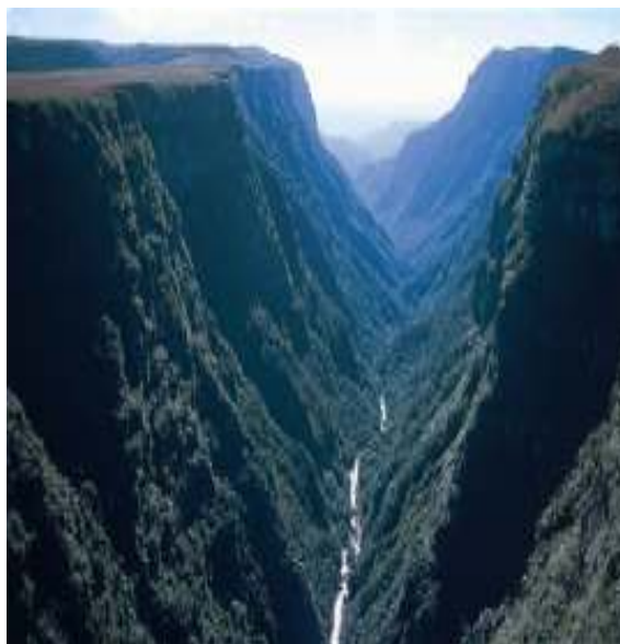
Figura 13 – Ao fundo: Rio do Boi – Cânion do Itaimbezinho.