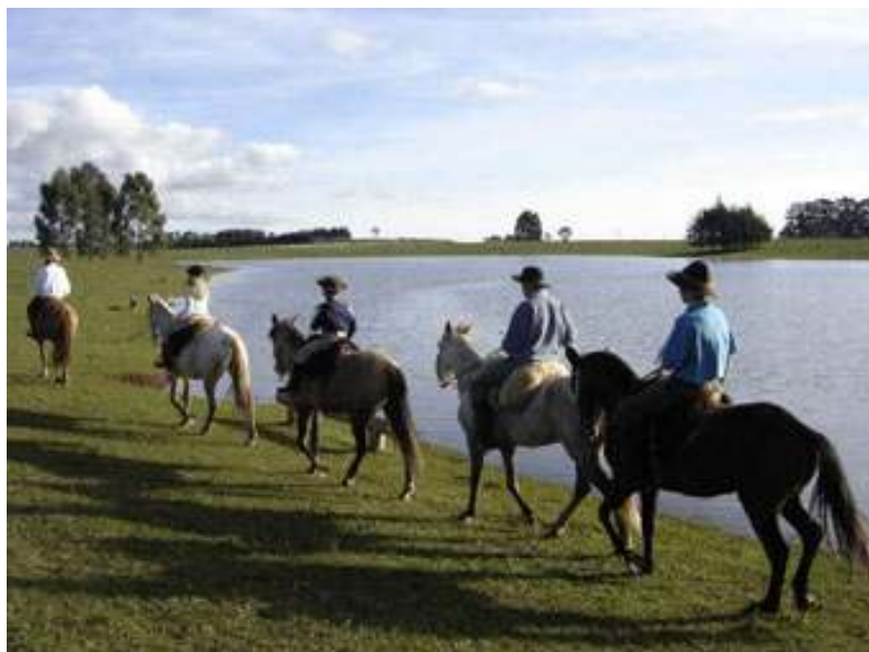
Figura 20 – Passeio a cavalo na Fazenda Paradoiro da Fortaleza.