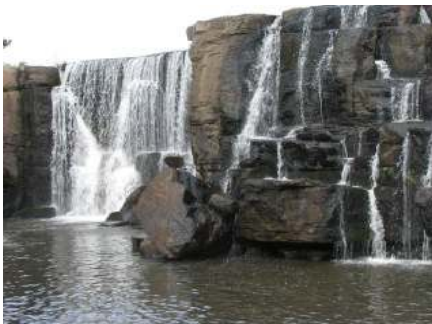
Figura 14 – Cachoeira dos Venâncios.

Localizada a 22 quilômetros de Cambará do Sul, formada pelo Rio Camisa, que nasce dentro do Parque Nacional Aparados da Serra. A Cachoeira dos Venâncios possui uma série de quedas de água cristalinas, cercada pela exuberante beleza da mata ciliar, de araucárias e dos campos verdes amarelados de Cima da Serra.