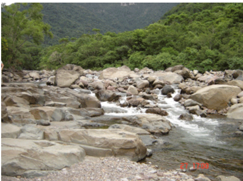
Figura 12 – Trilha do Rio do Boi.

de 80% dentro das margens do Rio do Boi, sobre pedras. O leito do rio é a única trilha que dá acesso ao interior do Cânion do Itaimbezinho. Nela pode-se observar a Mata Atlântica, sua fauna e flora e também aspectos geológicos de beleza rara, além dos deliciosos banhos nas piscinas naturais e cachoeiras.