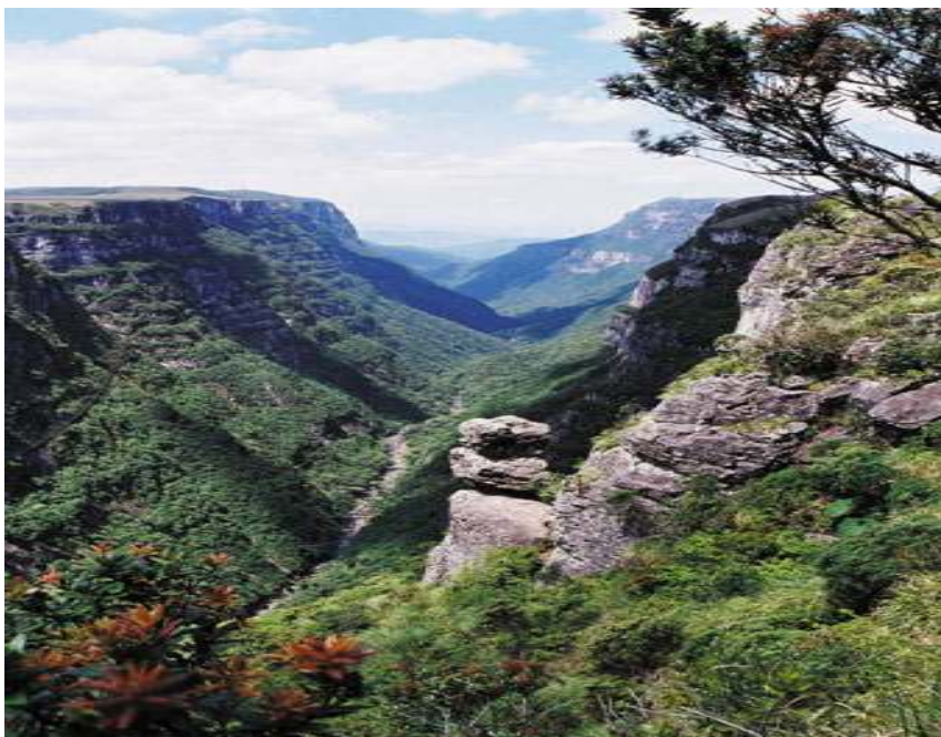
Figura 7 – Cãnion Fortaleza – Pedra do Segredo – Parque Nacional da Serra Geral.