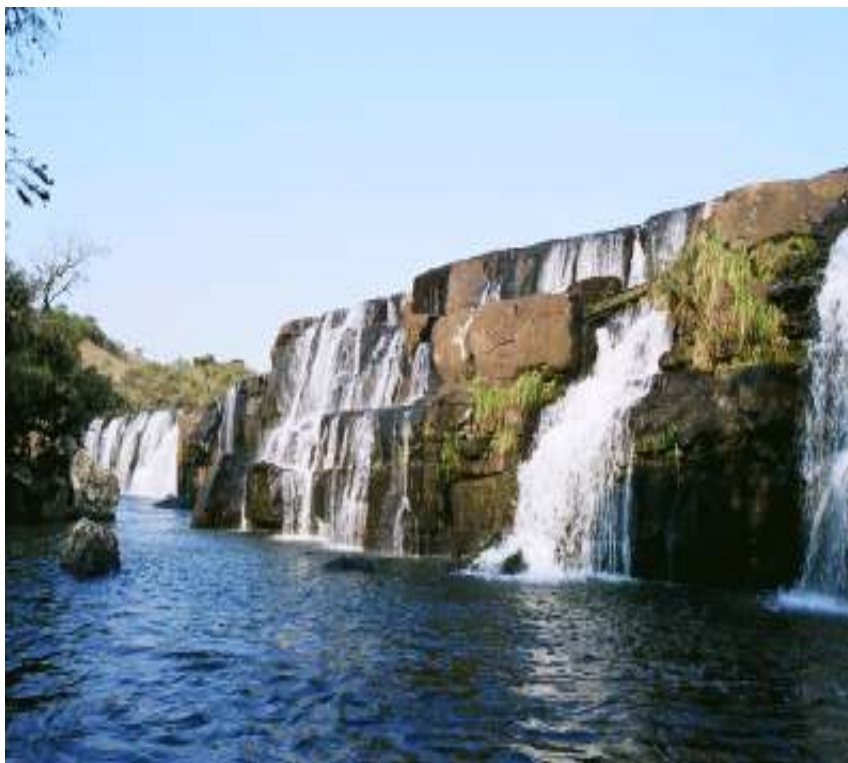
Figura 15 – Cachoeira dos Venâncios.