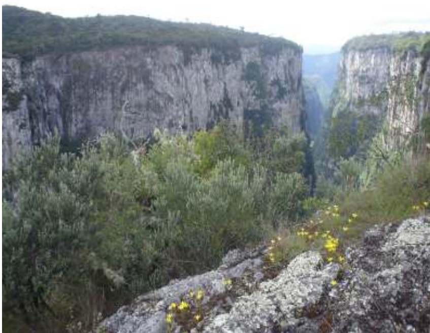
Figura 11 – Cânion Itaimbezinho – Parque Nacional Aparados da Serra.

O Cânion Itaimbezinho, localizado a 18 quilômetros da cidade de Cambará do Sul, é o principal atrativo do Parque Nacional Aparados da Serra. A altura das paredes do Cânion é de até 720 metros; a largura é de aproximadamente 600 metros e a extensão é de 5.800 metros.