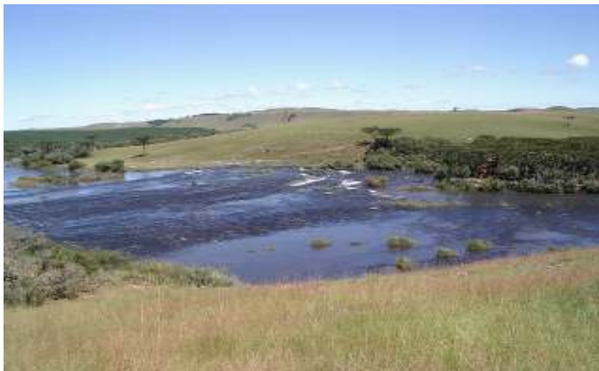
Figura 18 – Passo da Ilha.

Um belo lugar onde o rio Tainhas é cortado por uma estrada que liga a RS 020 (entre Cambará do Sul e Tainhas) à RS 110 (entre Várzea do Cedro e Bom Jesus). Neste ponto, o rio Tainhas torna-se raso e corre sobre um lageado, onde existe uma ilha no centro com recantos maravilhosos.