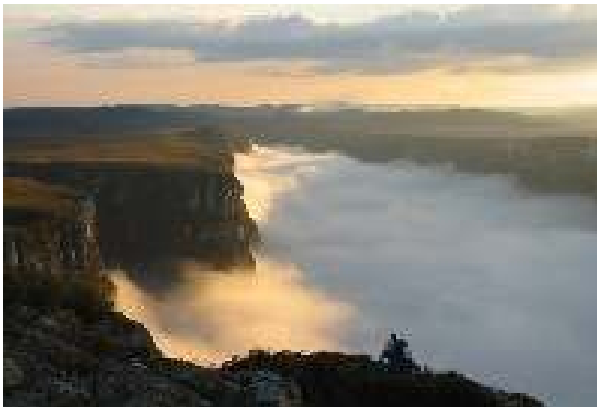
Figura 6 – Cãnion Fortaleza.