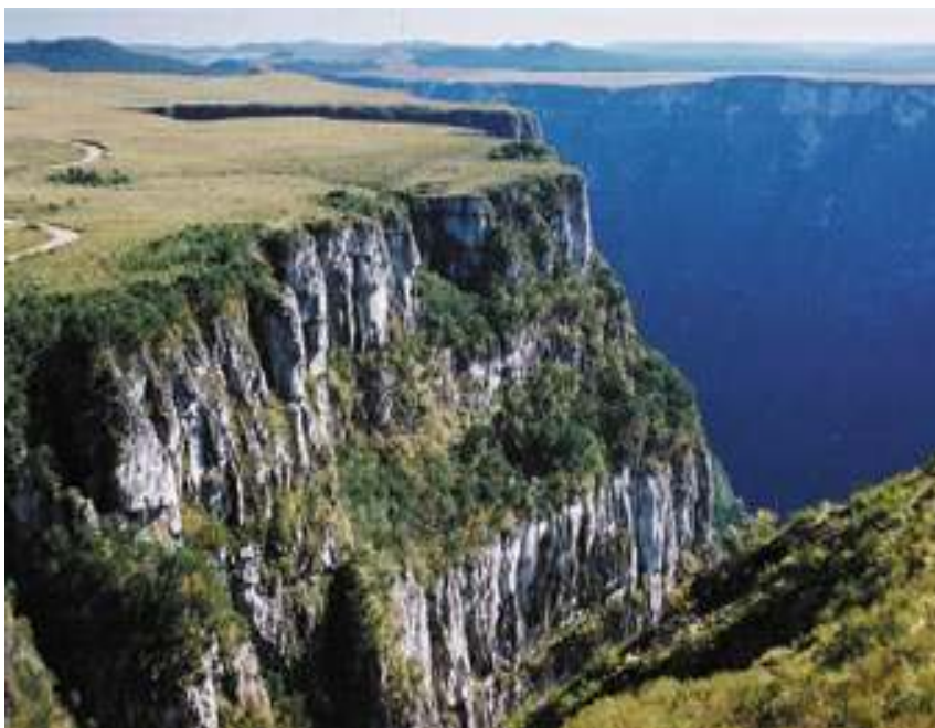
Figura 2 – Cãnion Fortaleza – Parque Nacional da Serra Geral.

O nome Fortaleza é devido ao formato de suas paredes e gargantas, pois tem-se a impressão de que se está diante de uma Fortaleza com suas torres e muralhas.