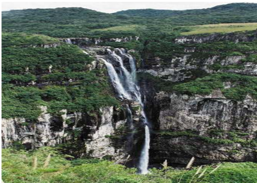
Figura 4 – Cãnion Fortaleza – Cachoeira do Tigre Preto – Parque Nacional da Serra Geral.

Seus principais atrativos são a Pedra do Dedo de Deus, Cachoeira do Tigre Preto e a famosa Pedra do Segredo. Para percorrer trilha leva-se em média duas horas e trinta minutos, e seu percurso total é de 4,5 quilômetros (ida e volta).