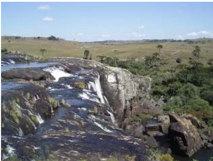
Figura 19 – Passo do S.