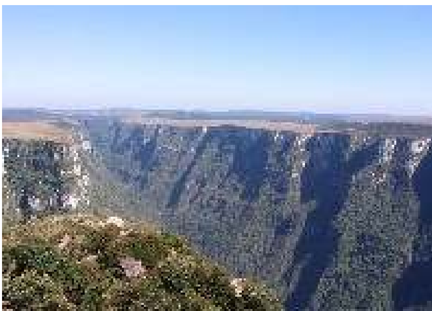
Figura 3 – Cãnion Fortaleza.

O nome Fortaleza é devido ao formato de suas paredes e gargantas, pois tem-se a impressão de que se está diante de uma Fortaleza com suas torres e muralhas.