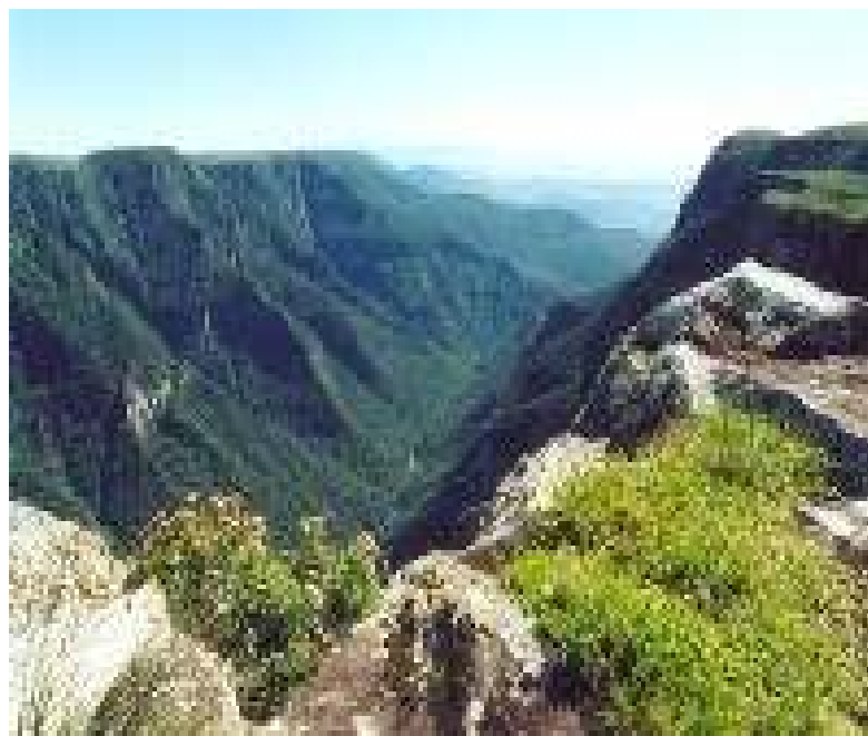
Figura 5 – Cãnion Fortaleza.

Seus principais atrativos são a Pedra do Dedo de Deus, Cachoeira do Tigre Preto e a famosa Pedra do Segredo. Para percorrer trilha leva-se em média duas horas e trinta minutos, e seu percurso total é de 4,5 quilômetros (ida e volta).