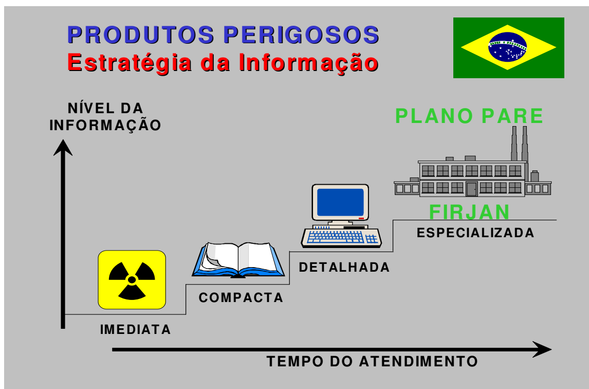
FIGURA 6: “ESCALA DE INFORMAÇÕES” DA ESTRATÉGIA DE INFORMAÇÕES.

DEGRAU 1: INFORMAÇÃO IMEDIATA - CERCA DE DOIS MINUTOS APÓS A CHEGADA NO LOCAL. INDICA AS CARACTERÍSTICAS E OS PERIGOS À PRIMEIRA VISTA. PARA SUA APLICAÇÃO, É FUNDAMENTAL O TREINAMENTO PARA A UTILIZAÇÃO CORRETA DO PAINEL DE SEGURANÇA, DO RÓTULO DE RISCO, DO NÚMERO DA ONU E DO NÚMERO DE RISCO. A INDÚSTRIA QUÍMICA, COMO CO-RESPONSÁVEL, DESEMPENHA UM PAPEL FUNDAMENTAL, POIS DEVE AUDITAR E EXIGIR DAS TRANSPORTADORAS O CUMPRIMENTO DA LEGISLAÇÃO.