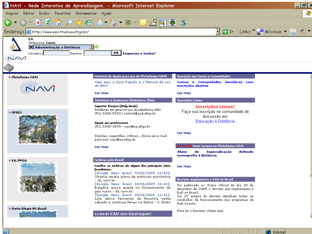
Figura 1 – Tela inicial da Plataforma NAVi

Unicamente para fins de ilustração, a seguir, são apresentadas telas da página de uma das versões da Plataforma NAVi, nas Figuras 1 e 2.