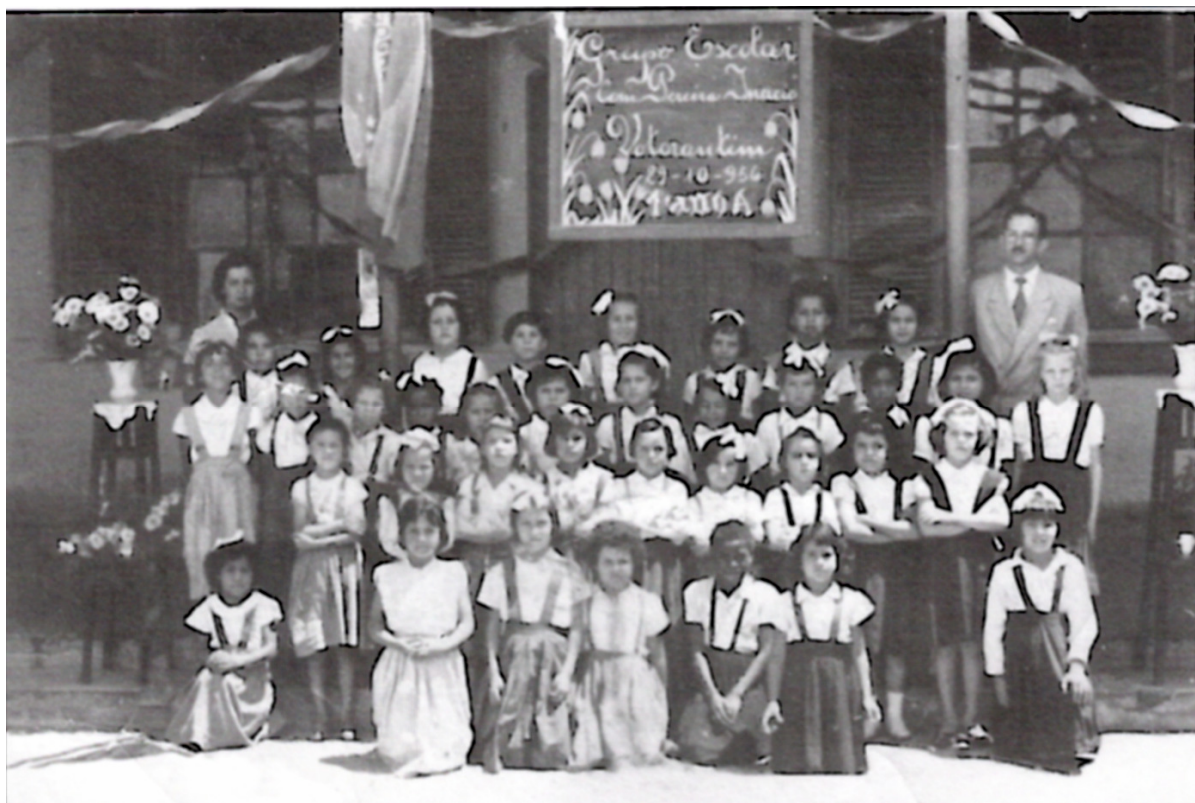
Fig. 05 Grupo Escolar “Comendador Pereira Ignácio”

Acima, a iconografia do Grupo Escolar mantido pelo Grupo Votorantim, permite enxergar a dimensão das relações acima citada, em que todos os destinos, diretamente ou indiretamente, submetidos às decisões empresariais.