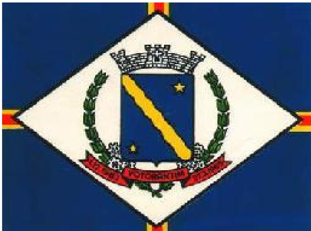
Fig. 6 – Bandeira do Município de Votorantim

voltado ao trabalho, devotado aos recursos naturais e caminhando para o progresso.