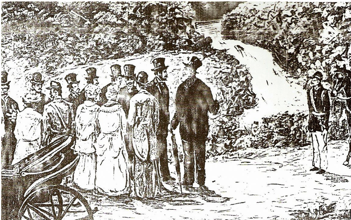
Fig. 01 – Visita de D. Pedro II à Cachoeira de Votorantim.