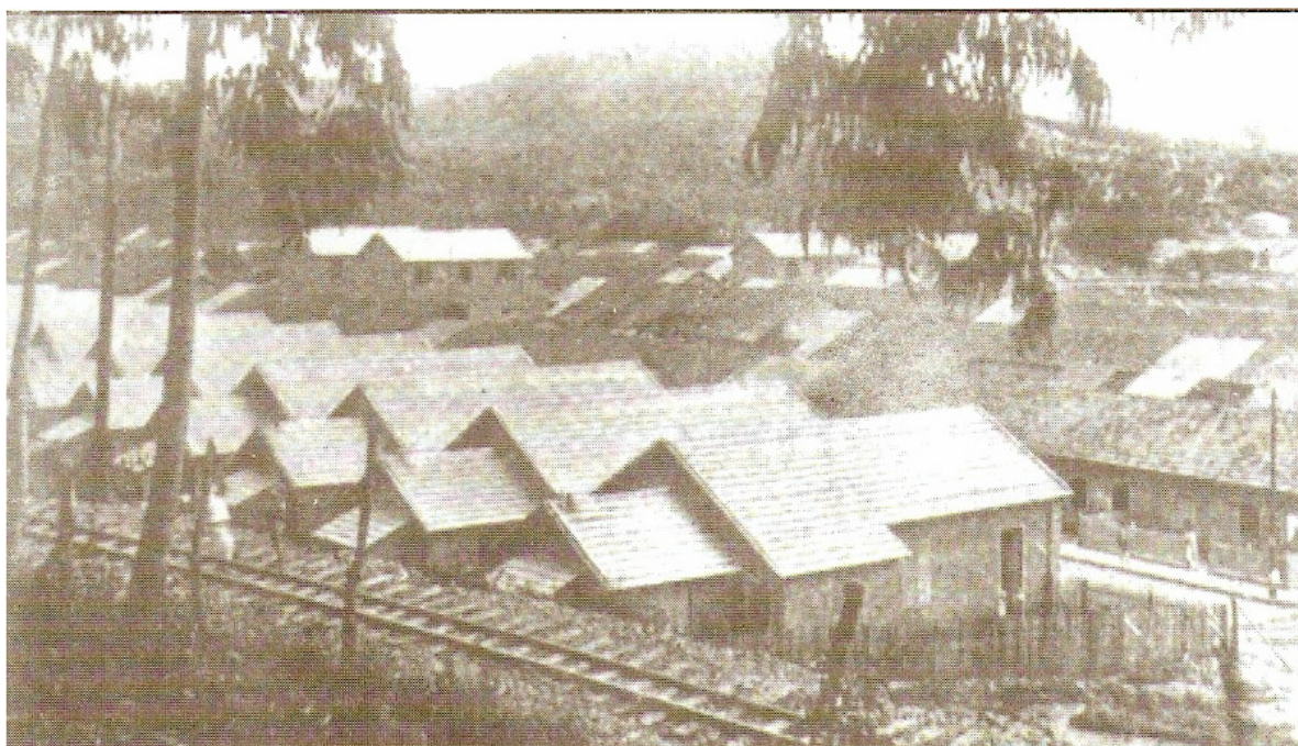
Fig.07 – Bairro da Chave, 1918

Conforme já mencionado, a mão-de-obra especializada utilizada entre mestres e contramestres foi a dos imigrantes ingleses, que habitavam o Bairro da Barra Funda. Ali, as casas eram sobrados suntuosos, grandes e confortáveis, que possuíam porões, característica da arquitetura Inglesa. Em contrapartida, o Bairro da Chave, com casas pequenas e simples, eram destinadas aos operários Italianos, possibilitando perceber que a hierarquização posta na Fábrica, estendia-se para além de seus muros. Portanto, foram os Ingleses que, delineando a organização da Fábrica a mando do grupo detentor do poder econômico e político, trouxeram as técnicas empregadas e o modelo de hierarquização, presentes até mesmo fora das fábricas: basta lembrar as diferentes vilas, os diferentes modelos de arquitetura e mesmo o tipo de lazer.