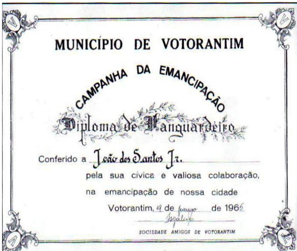
Fig.03 Diploma de Vanguardeiro

Quando foi aprovada no Palácio Nove de Julho, no Parque Dom Pedro II, em São Paulo, a Lei que autorizava o plebiscito, os vanguardeiros, eufóricos se atiraram nos lagos em frente ao Palácio. Realizado o plebiscito, o “sim” venceu, e Votorantim desmembrou-se de Sorocaba.