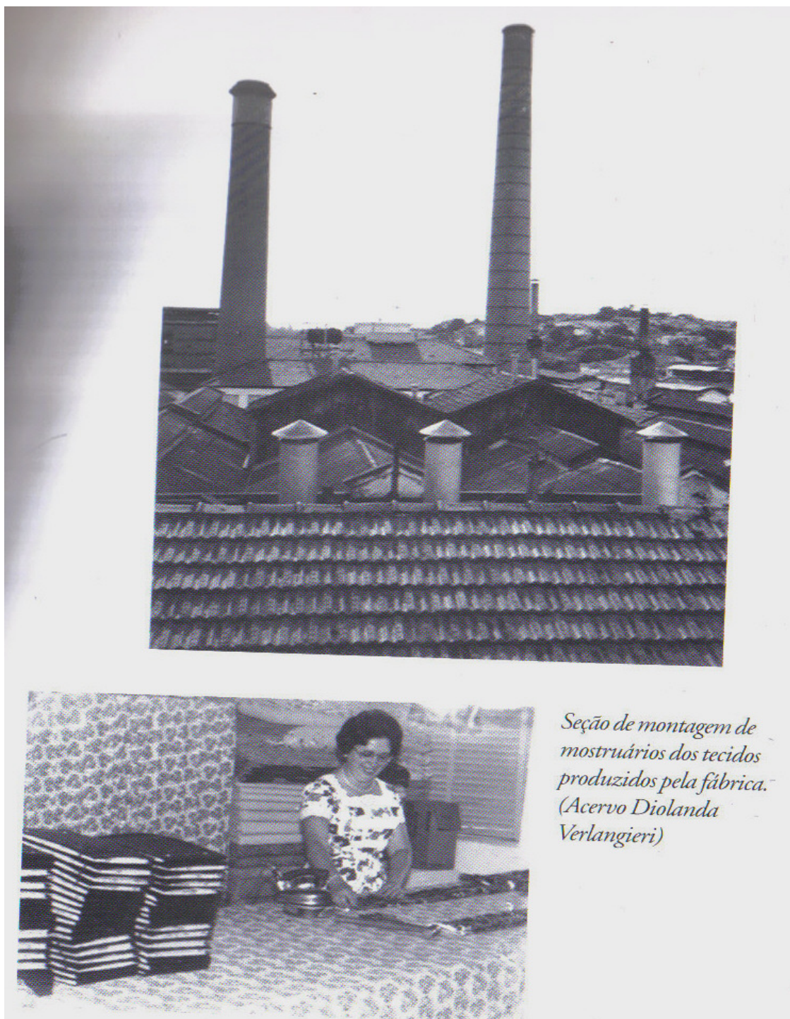
Fig. 09 – Vista da Chaminé da Fábrica e o trabalho da operária

É importante percebermos que a escolha das iconografias e a sua disposição não são neutras e evidenciam uma concepção histórica. A primeira iconografia nos dá a dimensão e o significado da Fábrica e a segunda a importância da Operária, não enquanto operária, e sim pela sua contribuição para o desenvolvimento da fábrica e a “naturalização” da sua função.