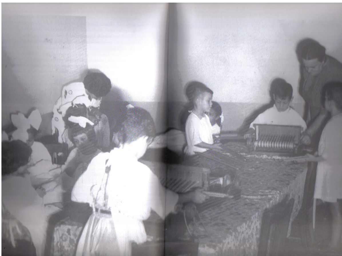
Fig. 10 Crianças manuseando teares na Creche em Votorantim.

implicando um mal-estar ao ter que opor-se àquele que oferece escola, casa e trabalho, isso sem contar que os baixos salários e as longas jornadas seriam perdoáveis diante de tantos benefícios recebidos.