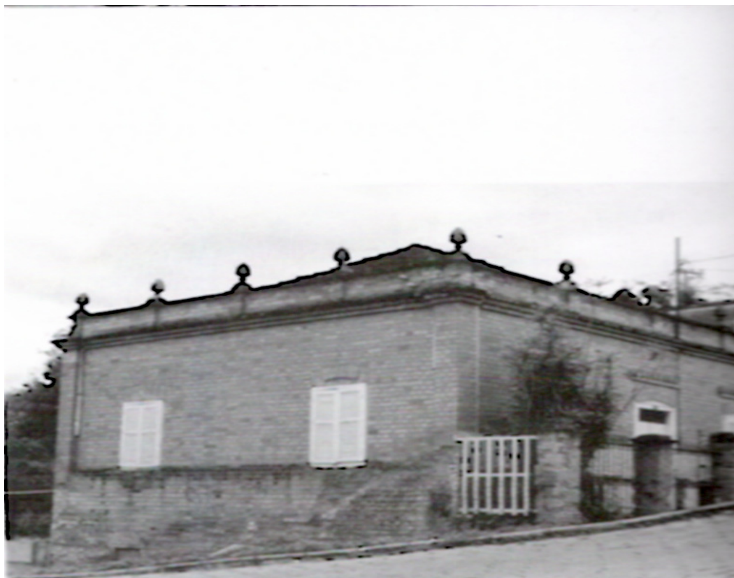
Fig.08 – Residência para chefes, Barra Funda

Essas iconografias deixam clara a hierarquização presente na sociedade, e isso sequer é mencionado pelos autores ora estudados, que não se aprofundam nas relações sociais, naturalizando desigualdades, as quais, muitas vezes, acabam compreendidas como decorrentes de processos naturais.