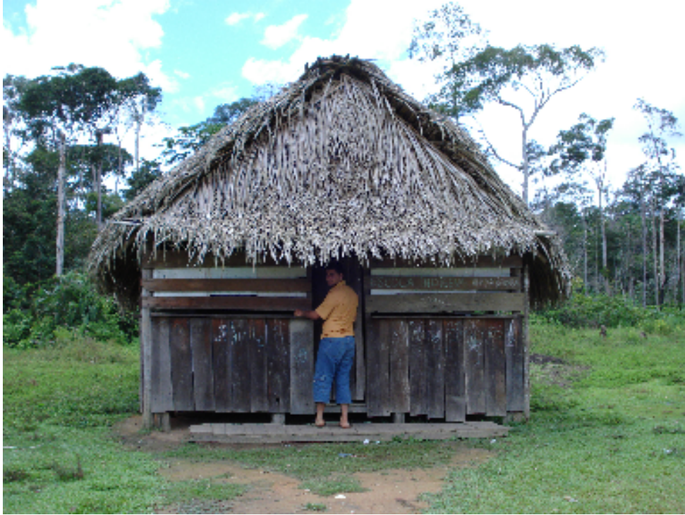
Figura 10: Escola da aldeia Central.

um sistema de radiocomunicação instalado na comunidade. O prédio da escola fica muito distante das casas (figura 10).