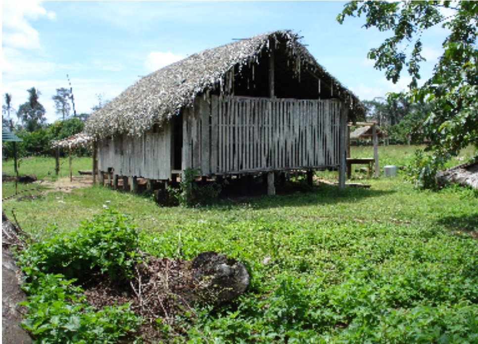
Figura 06: Escola da aldeia Marmelinho.