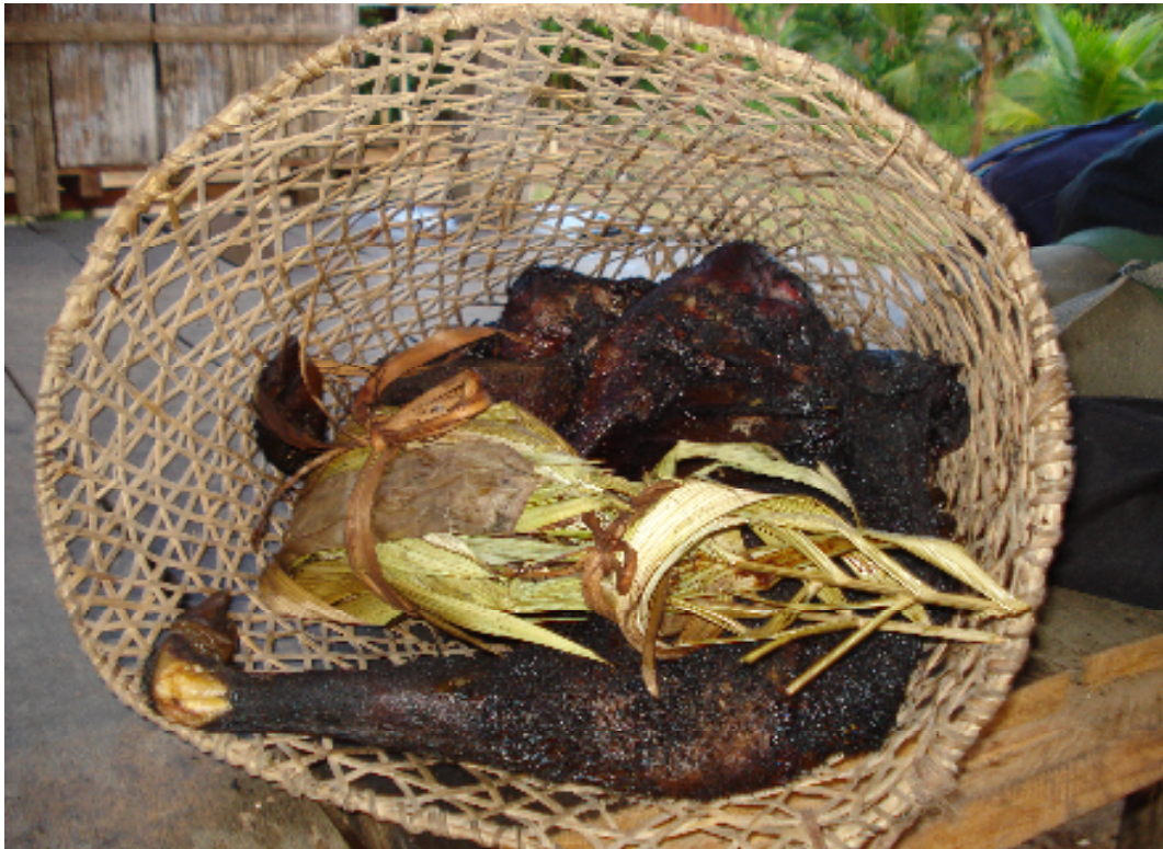
Figura 05: Balaio para o transporte da caça moqueada.