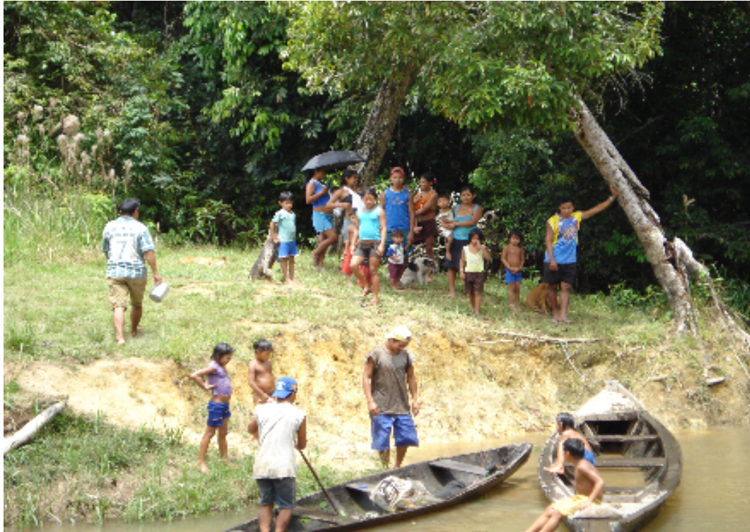
Figura 07: Travessia do rio Marmelo com canoas.