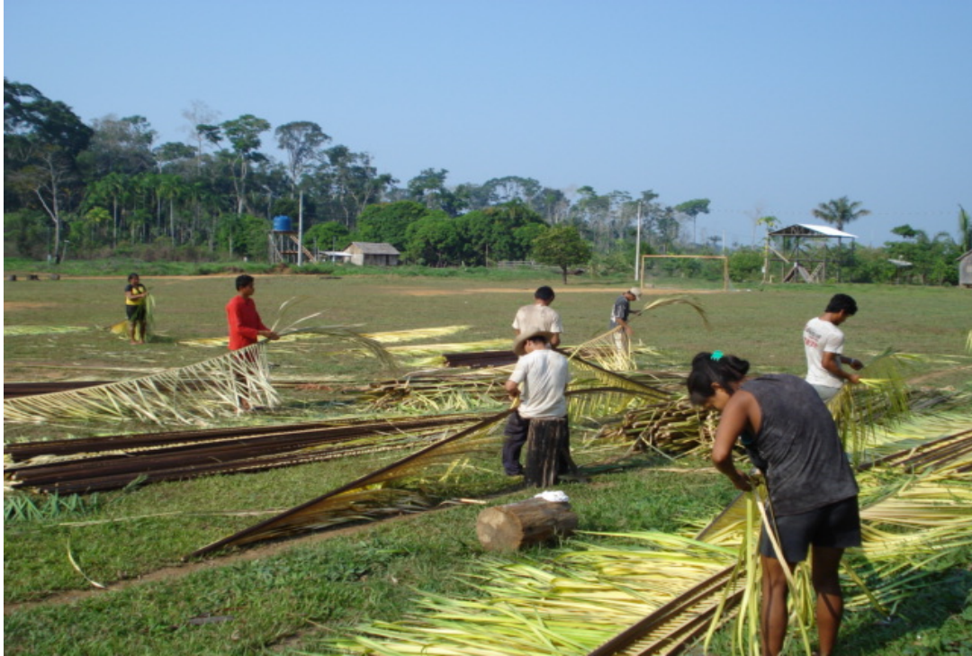
Figura 03: Preparação da palha para a construção de uma casa na aldeia Pedreira.