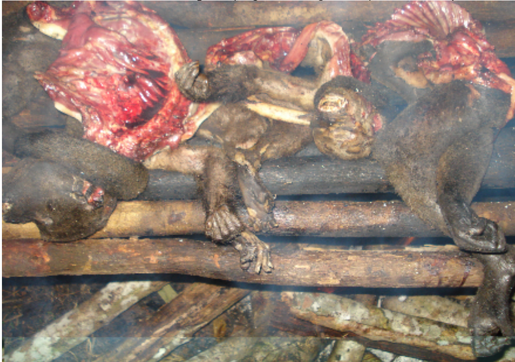
Figura 04: Carne de macaco Barrigudo ( Lagothrix lagothricha ) Xiluwa moqueando.

(Shãpy) 21 a partilha da carne de caça entre os grupos domésticos de acordo com as regras de parentesco, com os parentes mais próximos sendo os mais favorecidos. A carne que não é consumida imediatamente é moqueada de forma a ser preservada (figura 04).