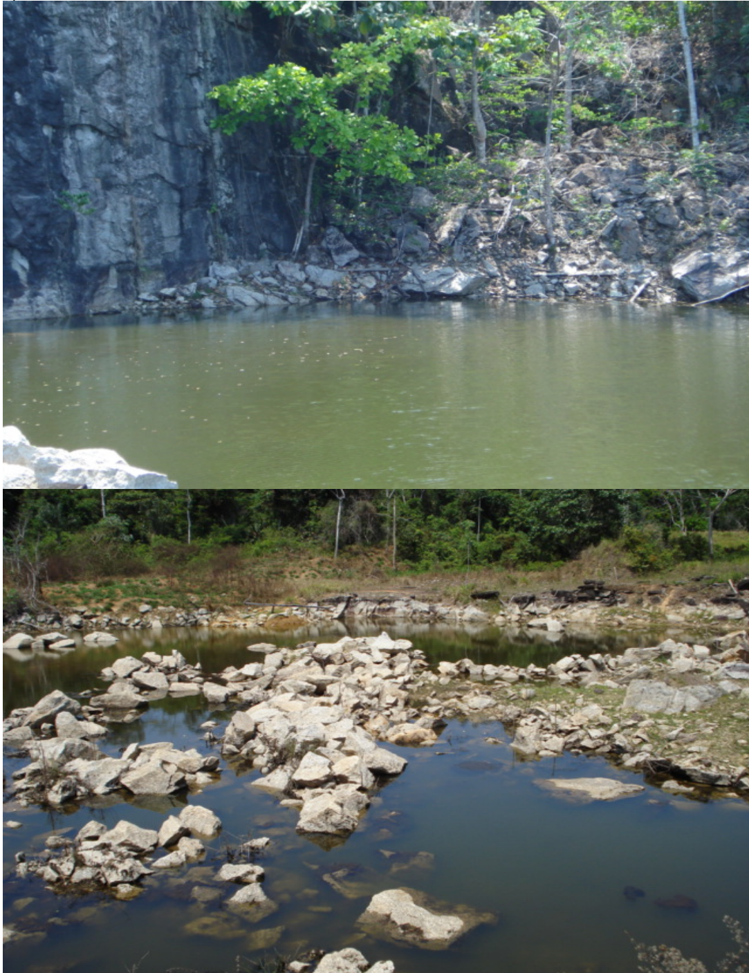
Figura 02: Buraco deixado no lugar de onde foi retirada a pedra brita que com o tempo acabou se transformando em um lago medindo aproximadamente 6.000m 2 com profundidade média de 1 metro e volume de 6.000 m 3 de água (Ação Civil Pública Doc.n.96.0002121. Ministério Público Federal).