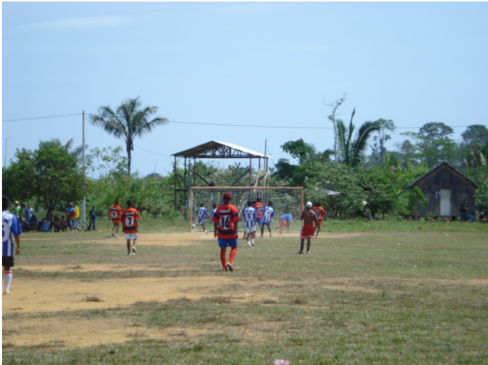
Figura 08: Torneio de futebol realizado durante festa do dia 07 de setembro de 2008 na aldeia Pedreira.

Ocorre na aldeia Pedreira uma grande festa realizada no dia Sete de Setembro (figura 08), quando é disputado um campeonato de futebol com churrasco, muita bebida alcoólica e baile de forró. Deste festejo participam os moradores das fazendas arredores e também pessoas de Rio Branco.