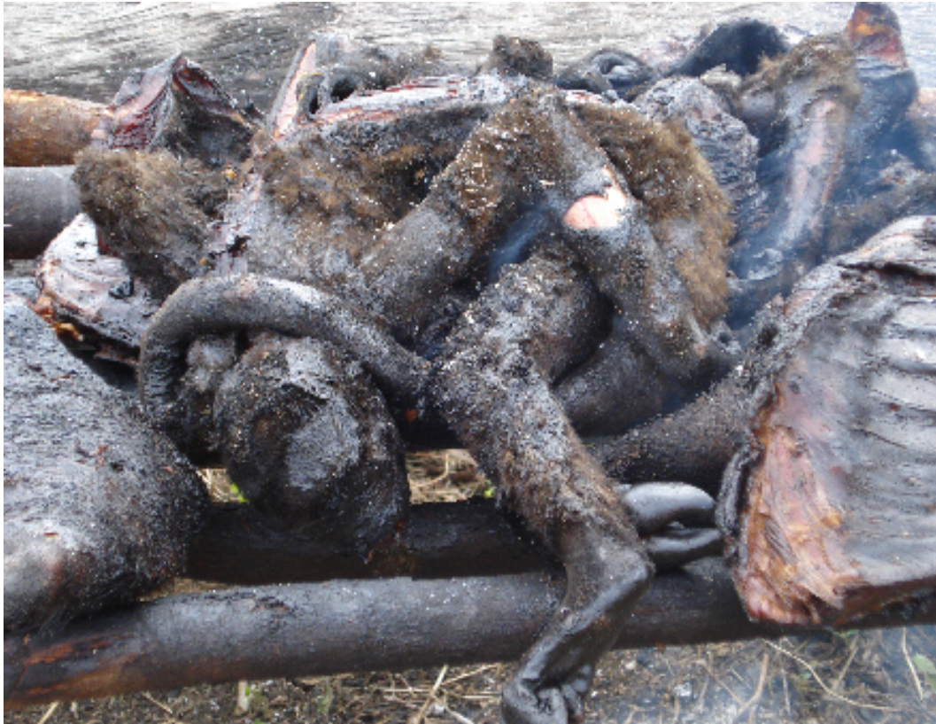
Figura 09: Macaco Barrigudo ( Lagothrix lagothricha ) Xiluwa moqueado.

O que a diferencia é que o dia do índio é comemorado tradicionalmente na aldeia Paxiuba com comidas típicas, apresentações de danças e cantorias, porém devido à falta de transporte e a grande dificuldade de acesso às aldeias Marmelinho, Barrinha e central esta ultimamente tem comemorado de forma individual. A alimentação servida na festa é farta, composta de peixes moqueados e cozidos ao leite da castanha, carnes de animais moqueadas e muita caiçuma (figura 09).