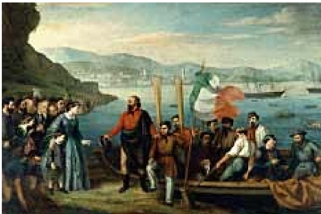
Figura 1 – Garibaldi partindo para a aventura da unificação