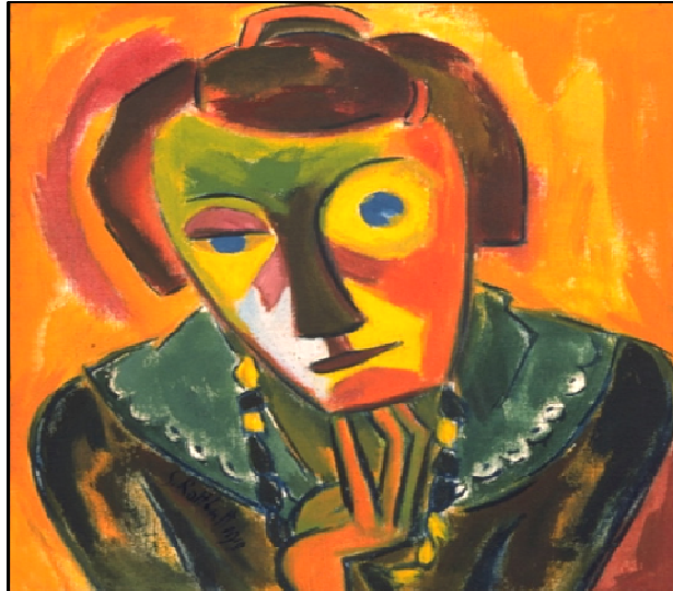
Figura 6: Karl Schmidt-Rottluff – Retrato de Emy: demonstração de trabalho do Expressionismo (movimento de vanguarda europeu).