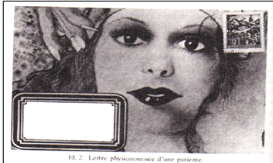
Figura 4: Envelope criado por uma paciente de Leo Navratil, demonstrando sua necessidade de colocar-se na comunicação

No segundo caso (Figura 5), é demonstrada a deformação característica desses momentos de expressão psicótica/esquizofrênica, que expressam a forma pela qual o paciente se vê e entende que é visto também pelo mundo. É, mais uma vez, a identificação da visão de si mesmo com a sua produção artística.