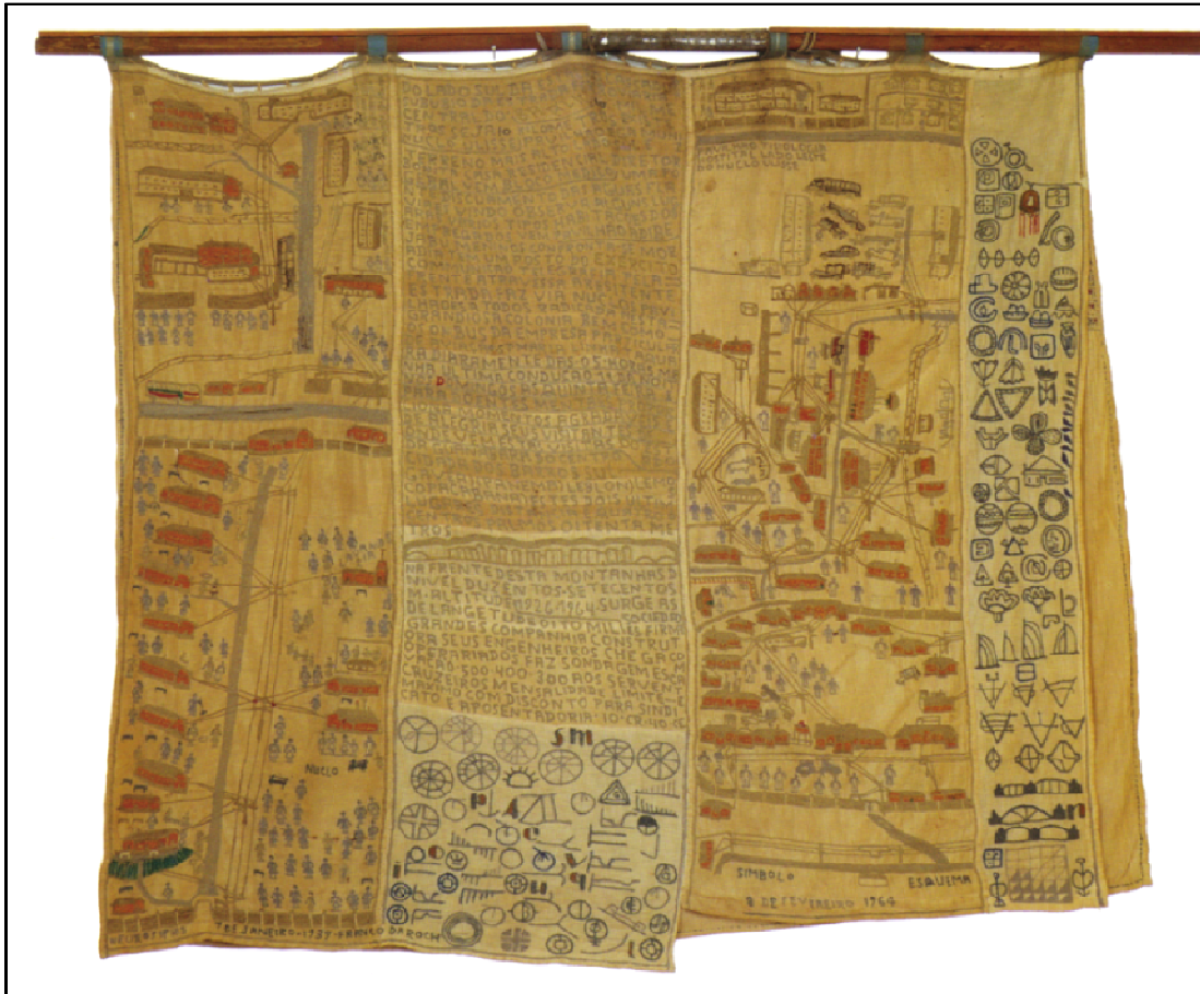
Figura 11: Frente do tecido bordado onde detalha passagens de sua vida e sua primeira crise.

Fonte: Fundação Proa. Disponível em: < http://www.proa.org/exhibicoes/pasadas/inconsciente/salas/id_bispo_6.html > Acesso em: 09 mai. 2008