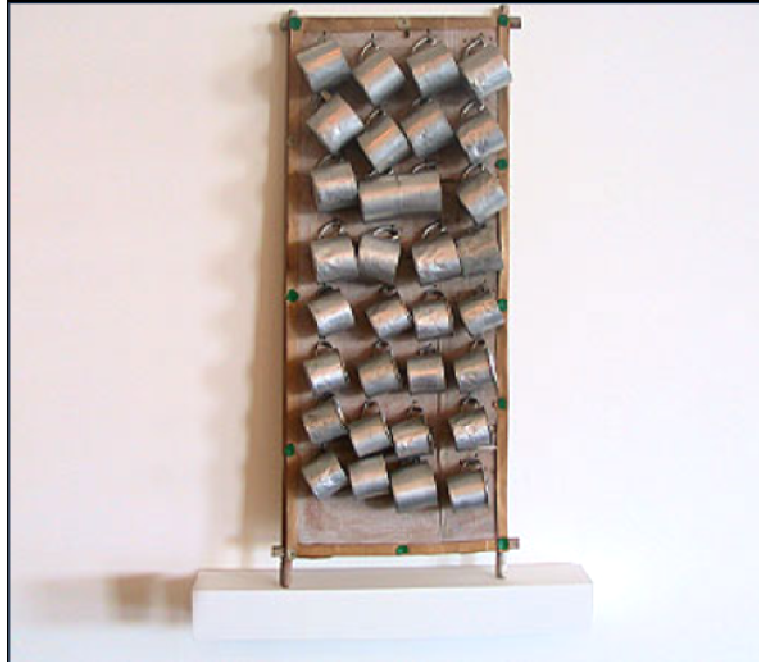
Figura 18: Canecas – ordenação de canecas feitas por Bispo do Rosário de acordo com o tamanho de cada uma delas.

ordenada. É uma característica de algumas obras de Bispo do Rosário, como as demonstradas nas figuras abaixo (18 e 19).