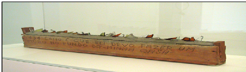
Figura 2: Objeto criado por Arthur Bispo do Rosário com madeira, cimento e vidro. Fonte: Fundação Proa. Disponível em: < http://www.proa.org/exhibicoes/pasadas/inconsciente/salas/id_bispo_4.html > Acesso em: 09 mai. 2008

Paranóide 5 diagnosticada em 24 de dezembro de 1938 conforme atesta seu prontuário na Colônia Juliano Moreira. Com delírios auditivos, foi lotado em espaço exíguo, distante do convívio social, no Pavilhão Ulisses Caldas, destinado a pacientes com sintomas de agressividade e descontrole físico. Cedo expressou essa necessidade humana de se comunicar, ainda que através de cifras, símbolos, frases incompletas e formas espaciais aparentemente desconexas (Figura 2). Ainda apresentou também uma necessidade de segurança, demonstrada também na Figura 2, onde relata uma forma de construir algo que possa lhe garantir estar seguro e protegido dos males externos. Um muro como esse demonstrado por Bispo do Rosário, caracteriza a busca pela proteção daquilo que pode lhe afetar, que pode coincidir também com a sensação de segurança que o artista encontrava no hospital psiquiátrico.