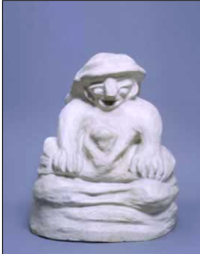
Figura 27: Escultura que demonstra uma suposta afetividade, principalmente no momento em que se faz a ligação entre a figuração de um coração que pode ser visto no lugar do peito. Obra de Adelina Gomes criada no Museu de Imagens do Inconsciente.

Fonte: Produções de Adelina. Disponível em: http://www.museuimagensdoinconsciente.org.br/html/exposicoes.html . Acesso em: 12 mai. 2008