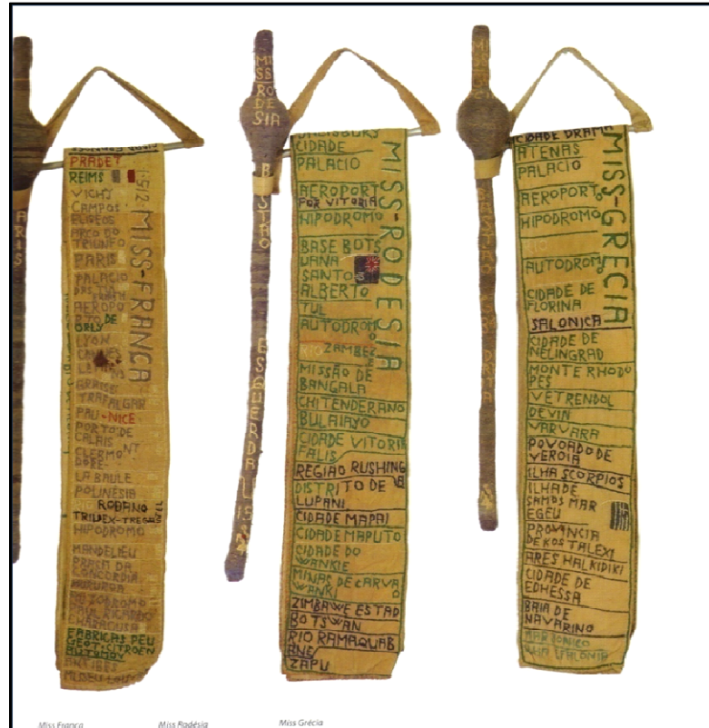
Figura 20: Cartografia das Misses: bordados de Bispo do Rosário que demonstram o catalogar.