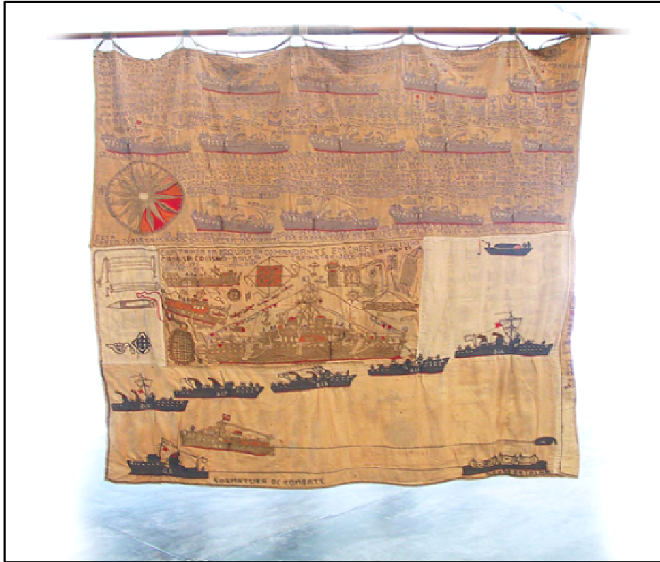
Figura 15: Inscrições com nomes de pessoas e lugares que fizeram parte de sua vida, além das figuras de navios, bordados nos lençóis da Colônia Juliano Moreira