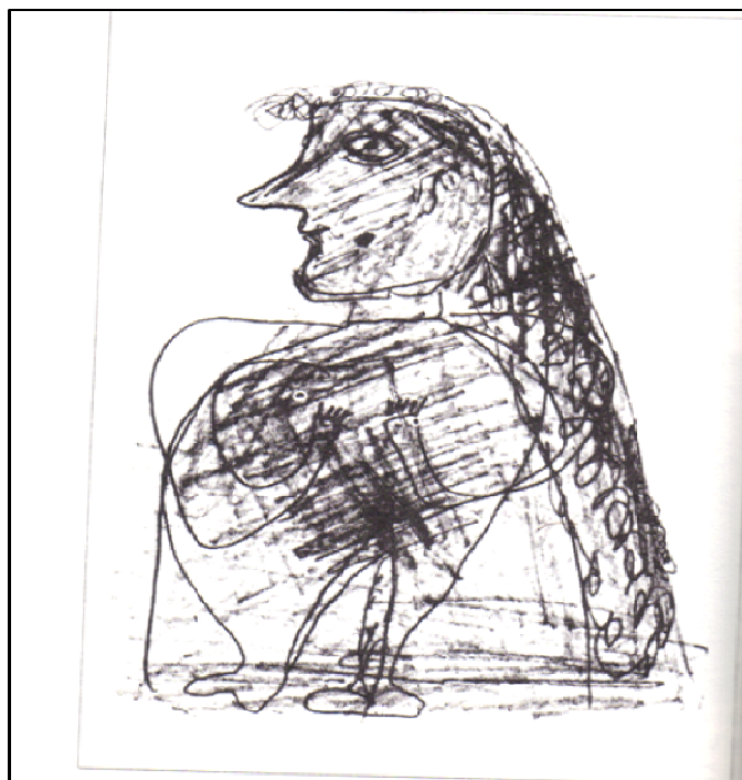
Figura 5: Expressividade extraordinária de um doente mental com a utilização da deformação Fonte: NAVRATIL, Leo. Schizophrénie et art. Paris: Presses Universitaires de France, 1978. p.54

No segundo caso (Figura 5), é demonstrada a deformação característica desses momentos de expressão psicótica/esquizofrênica, que expressam a forma pela qual o paciente se vê e entende que é visto também pelo mundo. É, mais uma vez, a identificação da visão de si mesmo com a sua produção artística.