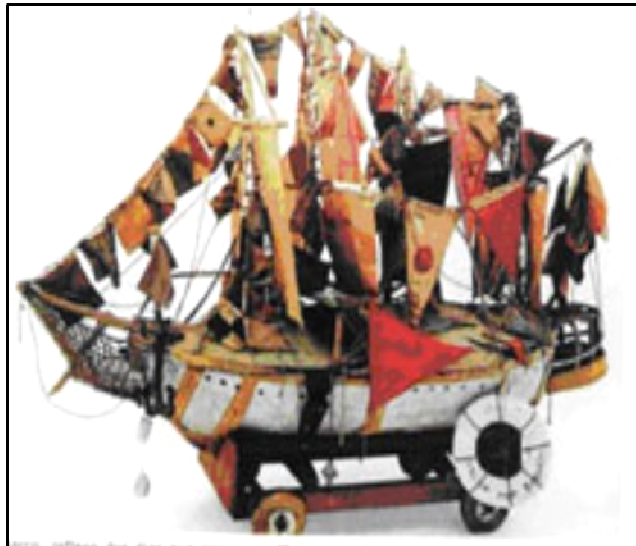
Figura 13: Carrinho de brinquedo que lembra a marinha e o tempo em que esteve lá.