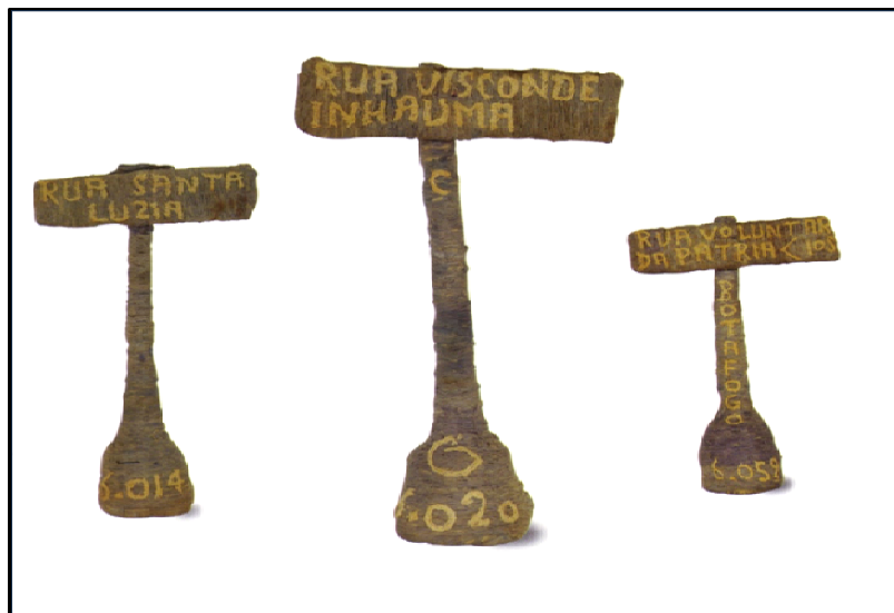
Figura 21: Nomes de ruas em placas – demonstração de procedimento de catalogar em Bispo do Rosário.