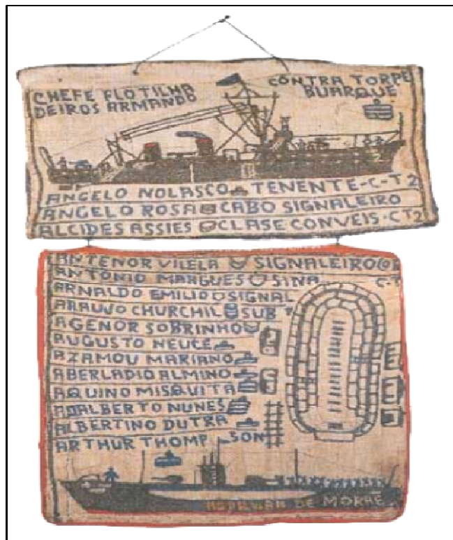
Figura 3: “Chefe Flotilha Contra Torpedeiros Armando Buarque” - Tecido, papelão e madeira, obra feita por Arthur Bispo do Rosário.

Pode-se perceber ainda nesta Figura 3, que o artista apresenta palavras e desenhos que reforçam aquilo que deseja comunicar. Enquanto apresenta palavras e nomes próprios ligado ao seu tempo da Marinha, apresenta também desenhos que remetem a este mesmo período. Barcos vistos de perfil e como um mapa da embarcação (que pode ser analisado também através de uma analogia dos aspectos que envolvem o local em que estava vivendo). Os muros do hospital podem ser tão seguros e definidos para ele quanto os entornos de um navio eram.