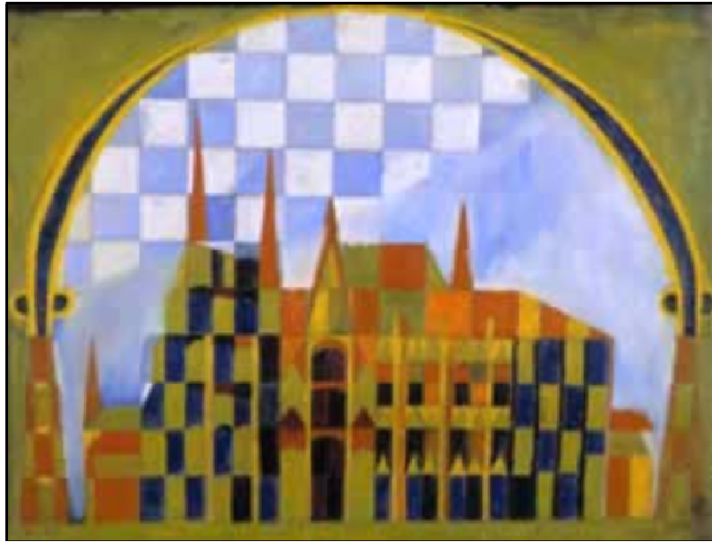
Figura 28: Obra de Carlos Petrius que demonstra grande atividade artística e também uma abertura de caracterização em sua obra.