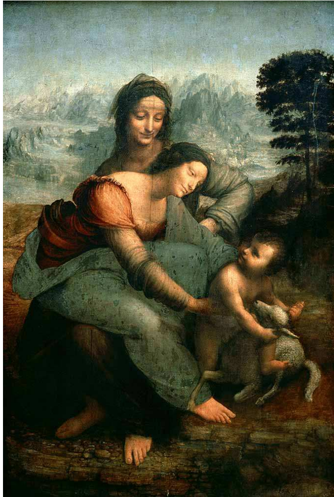
Figura 14: A Virgem, o menino e Sant'ana de Leonardo Da Vinci

O olhar atencioso e analítico para a obra de Leonardo Da Vinci, e conseqüentemente, de outros artistas, pode demonstrar o que as teorias dizem a respeito da expressão de dados inconscientes na projeção figurativa. O artista demonstra projetivamente aspectos seus e de sua vivência na sua obra. É uma forma de expressão e comunicação do inconsciente que se coloca com clareza.