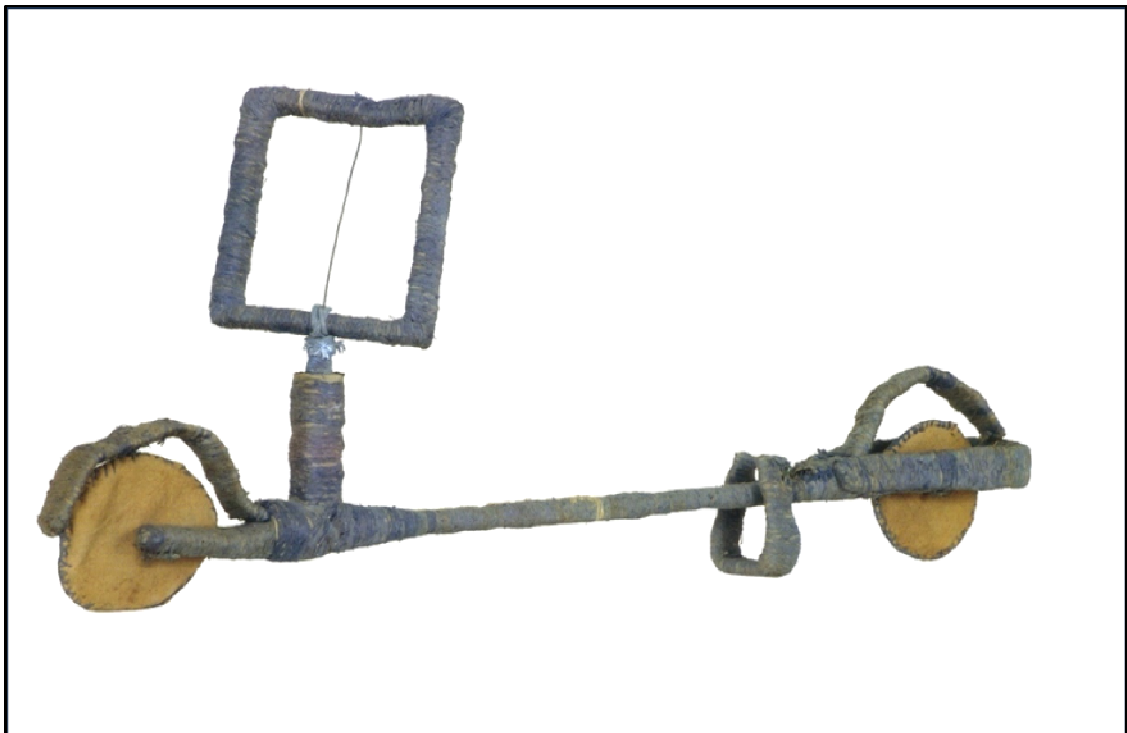
Figura 23: Patinete – objeto que tem todo seu corpo envolvido por linha e tecido.

O quarto e último procedimento que pode ser descrito é o envolver ou encapsular, explicada pelo autor como “...qualidade constitutiva do alicerce sobre o qual o artista ergue sua arquitetura sobre lógicas próprias... Significa também, a marca do desejo de se colocar como o guardião, aquele que é maior, pronto para proteger o envolvido. “ (SILVA, 2003, p.65). É neste momento da obra de Arthur Bispo do Rosário, que ele envolve ou encapa objetos dando uma nova forma e uma transformando peculiaridades dos mesmos, assim como camuflando também alguns aspectos destes mesmos objetos. As figuras a seguir são também para exemplificar esse procedimento; na figura 23 é demonstrada uma obra na qual Bispo do Rosário envolveu objetos com linha e tecido, fazendo com que ficasse totalmente encapsulada e a partir daí montou o que ficou conhecido como Patinete (nome dado pela semelhança com o objeto em jogo); já na figura 24, o artista envolve um objeto no formato de caixa e alguns gravetos que, por sua vez, envolvem uma telha guardada no interior da caixa.