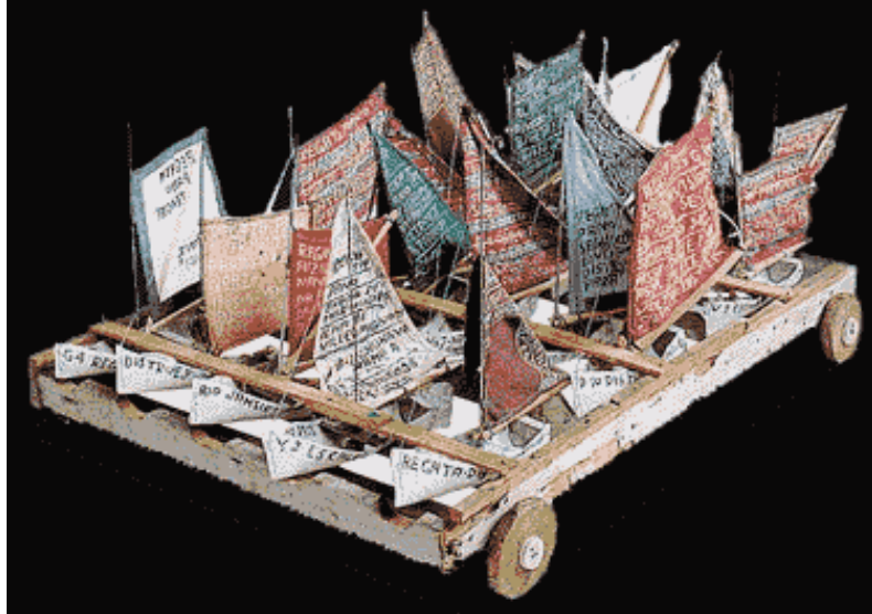
Figura 7: 21 Veleiros – de Arthur Bispo do Rosário – criada durante sua permanência na Colônia Psiquiátrica Juliano Moreira.