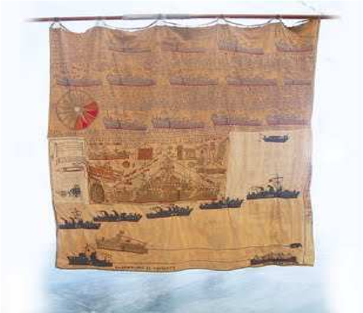
Figuras 9: Demonstração do comportamento estereotipado de repetição do mesmo desenho (o navio), criada por Arthur Bispo do Rosário nomeado de Estandarte