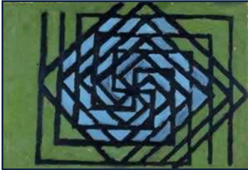
Figura 26: Labirinto – criação de Fernando Diniz, obra presente no Museu de Imagens do Inconsciente

Fonte: Produções de Fernando Diniz. Disponível em: http://www.museuimagensdoinconsciente.org.br/html/exposicoes.html . Acesso em: 12 mai. 2008