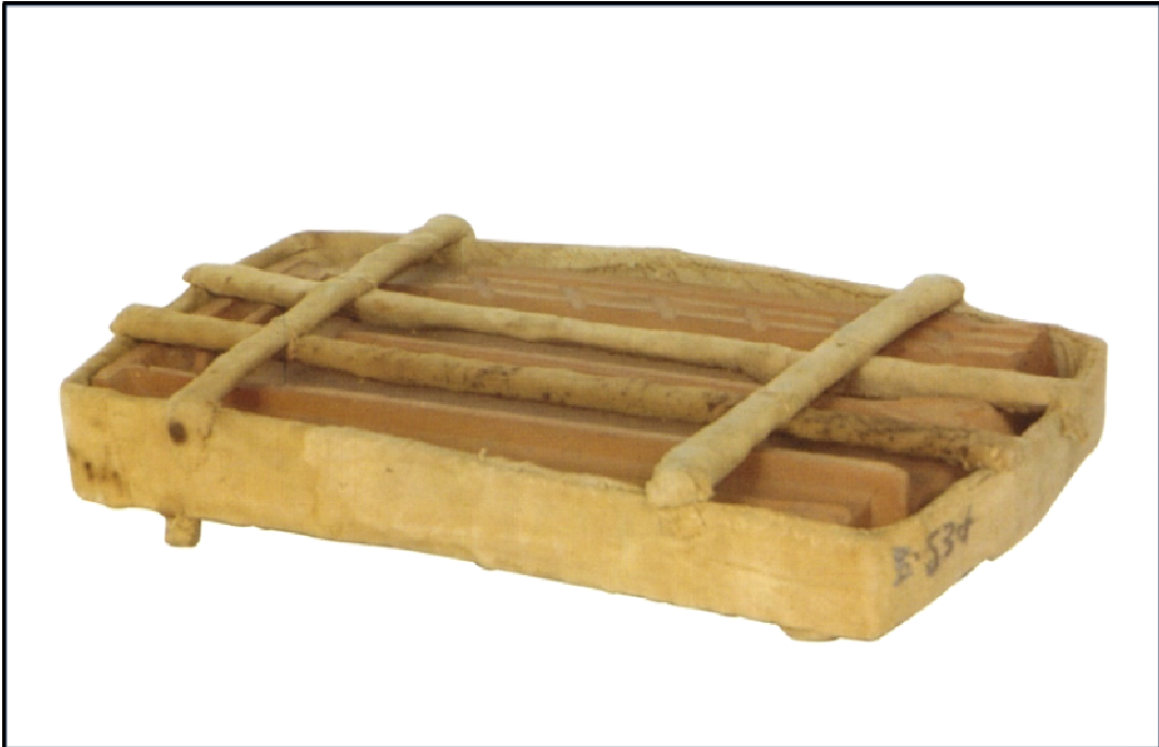
Figura 24: Telha – objetos que demonstram o procedimento do Envolver ou Encapsular.

Fonte: Fundação Proa. Disponível em: < http://www.proa.org/exhibiciones/pasadas/inconsciente/salas/id_bispo_1.html > Acesso em: 09 mai. 2008