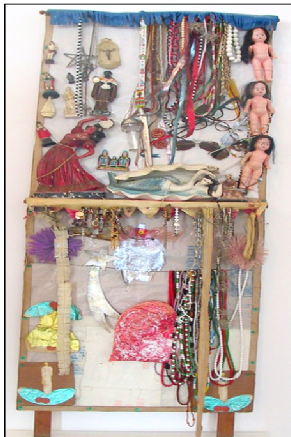
Figura 10: Macumba – de Arthur Bispo do Rosário – criada com plástico, madeira e outros materiais, através do qual demonstra suas noções de religiosidade, demonstração de formulação simbólica.

Esta terceira função, caracterizada pela criação simbólica na busca constante desta comunicação, pode ser vista na obra de Arthur Bispo do Rosário a partir do momento em que é perceptível a utilização de materiais, de formas simbólicas de expressão. Por exemplo, quando ele expressa sua religiosidade ou seu conhecimento neste âmbito através da montagem demonstrada abaixo (figura 10).