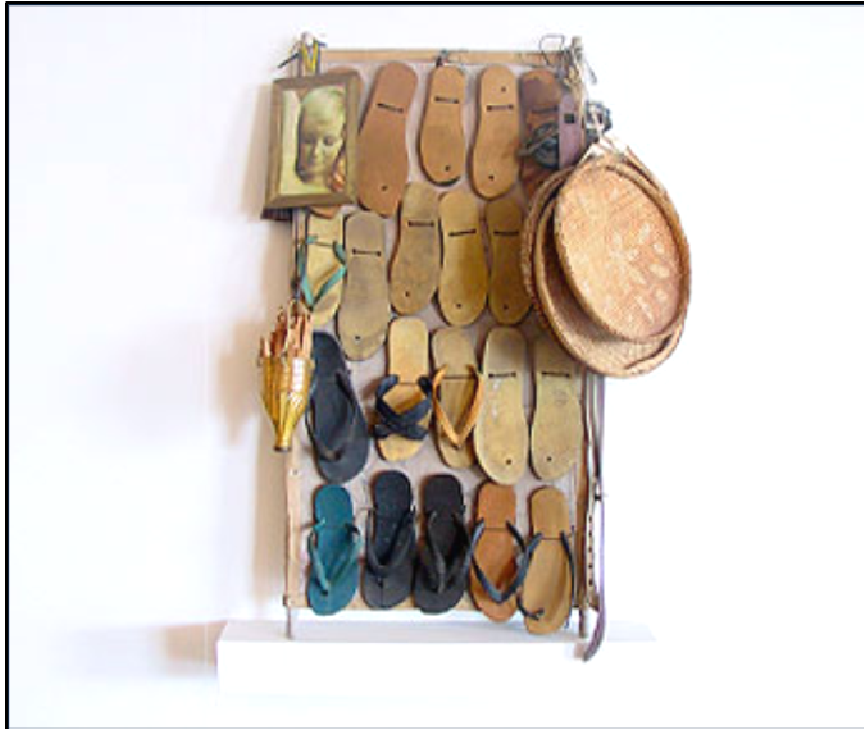
Figura 19: Sandálias e Peneiras: organização de materiais realizados por Bispo do Rosário na ordenação daquilo que era recebido e apreendido como parte de sua obra.

Fonte: Fundação Proa. Disponível em: < http://www.proa.org/exhibiciones/pasadas/inconsciente/salas/id_bispo_9.html > Acesso em: 09 mai. 2008