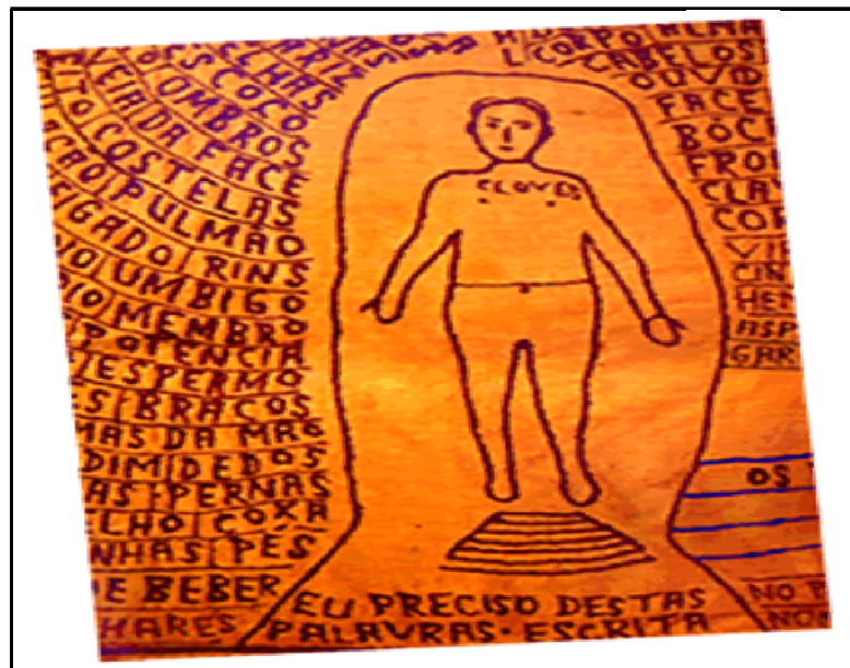
Figura 1: Bordado Feito por Arthur Bispo do Rosário durante o tempo em que esteve na Colônia Juliano Moreira e que exprime sua necessidade de se comunicar.

Esta figura demonstra ainda dois fatores que podem ser observados: o primeiro é o desenho do homem colocado sobre um pedestal e o segundo é este mesmo desenho realizado com um único traço. Analisando estes dois aspectos pode-se dizer que mais uma vez Arthur Bispo do Rosário demonstra sua busca de reconstituição enquanto ser completo e inteiro, dando a importância ao ser humano e também pode-se entender como uma intenção de proteção deste homem, visto que além de ser feito em um único traço é também envolvido em uma couraça.