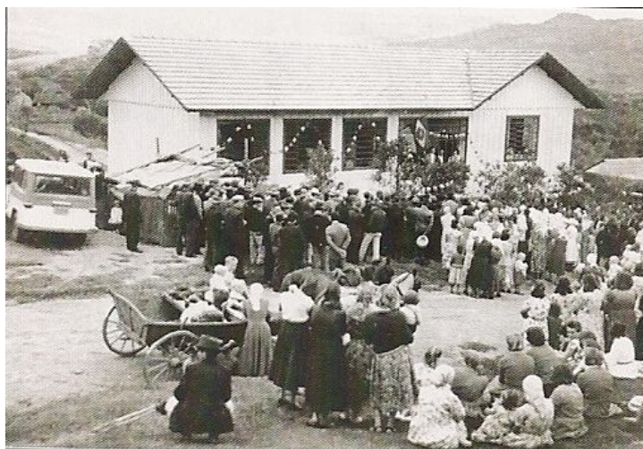
Imagem 6. Inauguração da Escola São Miguel de Itapará, em 1960.

Ilustramos o nosso trabalho apresentando duas imagens da escola localizada na comunidade de Itapará. A primeira é uma imagem da escola na década de 1960 e a segunda é uma imagem atual da escola.