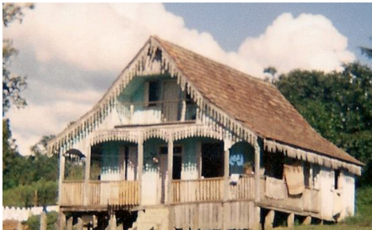
Imagem 10. Casa de Itapar com modelo idntico s casas na Ucrnia.

Ademais, a respeito das dificuldades que sofreram os imigrantes ucranianos em Itapar, Sebasto relata que no havia escola na comunidade e que, para estudar, as crianas tinham que ir a p mais de trs quilmetros, at chegarem  escola mais prxima.