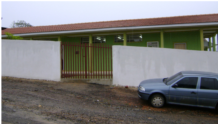
Imagem 7. Escola da comunidade de Itapar, em 2009.

Em Itapar h duas igrejas catlicas, uma do rito romano e outra do rito ucraniano. Nosso trabalho faz referncia aos aspectos religiosos relacionados  igreja do rito ucraniano. Apresentamos imagens da igreja ucraniana localizada na comunidade de Itapar, nas quais se podem ver claramente aspectos religiosos e arquitetnicos caractersticos desse rito.