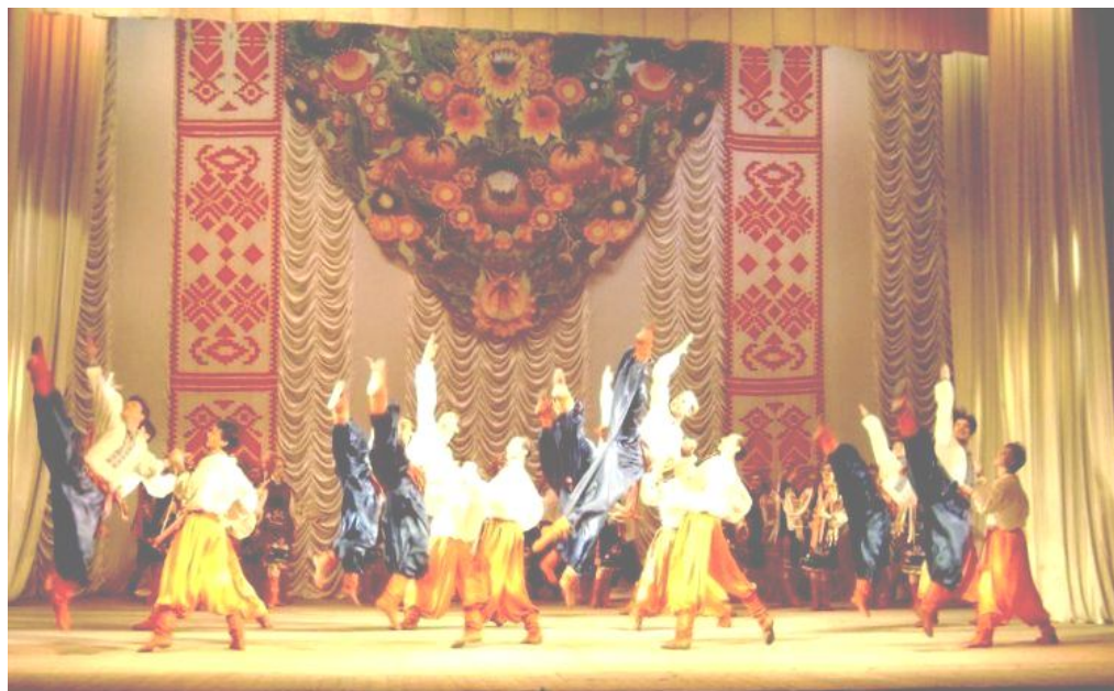
Imagem 3. Grupo folclórico ucraniano Ivan Kupalo .

Ivan Kupalo , e também, deveriam pendurar seus vinothok (coroa de flores que simboliza a feminilidade) nos galhos das árvores, pois assim seus futuros amores iriam escolhê-las sob o consentimento de Ivan Kupalo . Com o advento do cristianismo, este personagem foi associado a São João Batista. Essas informações citadas acima foram obtidas junto ao atual coreógrafo e dançarino do grupo Ivan Kupalo . Apresentamos, a seguir, uma imagem de uma das apresentações do referido grupo folclórico.