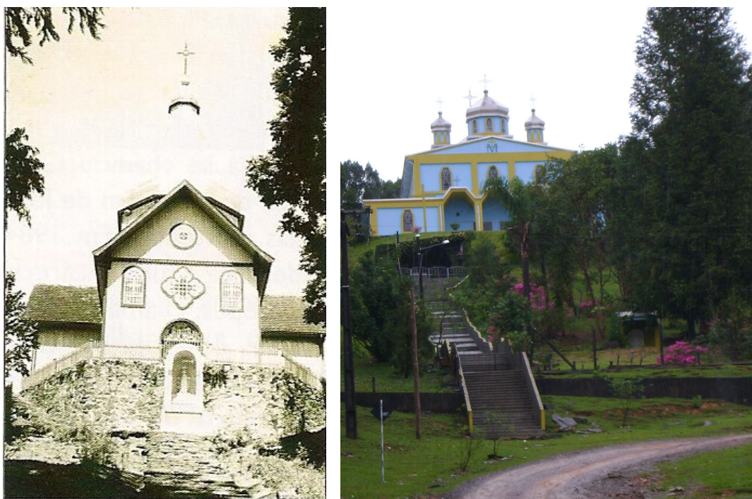
Imagem 8. Igreja ucraniana de Itapar, em 1936 e em 2009. Fontes: Irati: revista do centenrio e acervo do autor, respectivamente.

Em Itapar h duas igrejas catlicas, uma do rito romano e outra do rito ucraniano. Nosso trabalho faz referncia aos aspectos religiosos relacionados  igreja do rito ucraniano. Apresentamos imagens da igreja ucraniana localizada na comunidade de Itapar, nas quais se podem ver claramente aspectos religiosos e arquitetnicos caractersticos desse rito.