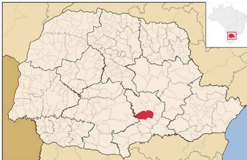
Imagem 2. Mapa do Paraná com destaque para o município de Irati 10 .

No que concerne à parte histórica do nome do município, é válido expor que Iraty , antes com “y” e depois com “i”, após a reforma ortográfica realizada no primeiro governo do presidente Getúlio Vargas, na década de 1930, etimologicamente significa ira = mel, ty = rio, logo, rio de mel, em idioma indígena. A referência feita ao seu nome ocorreu em virtude de um rio que corta a cidade, hoje conhecido, como Rio das Antas. Além disso, Irati faz referência à abelha nativa Iratim ou Iraxim . Farah, Guil e Philippi (2008, p. 10) apresentam também a genealogia do município de Irati da seguinte forma: