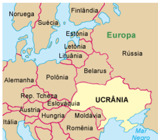
Imagem 1. Mapa de uma parte da Europa com destaque para a Ucrânia 8 .

Brasil, Argentina e Canadá 7 . Para ilustrar o nosso trabalho, apresentamos, a seguir, um mapa de uma parte da Europa, com destaque para a Ucrânia.