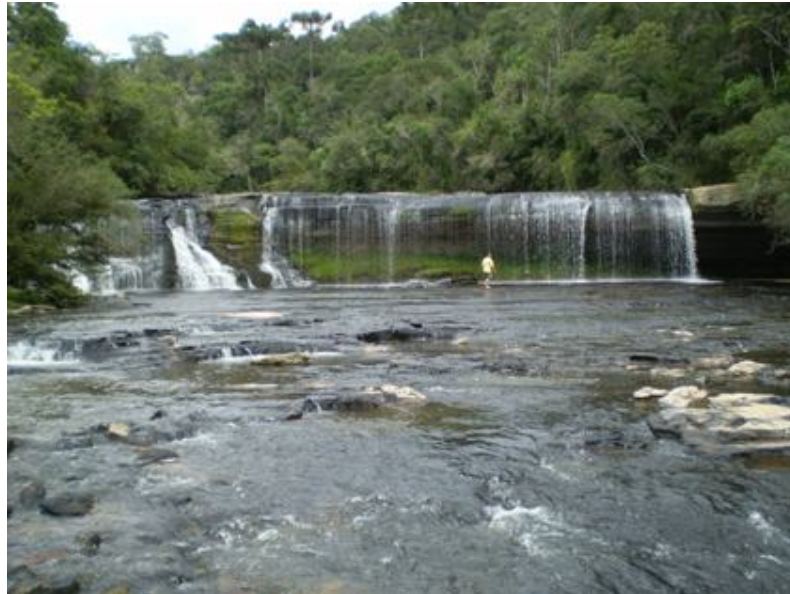
Imagem 5. Uma das cachoeiras de Itapara 12 .

A comunidade de Itapara e conhecida, tambem, pelas inumeras cachoeiras. Sao muitos os turistas que visitam a regiao para conhecer a terra de ucranianos e ter contato com a natureza. O acesso e difıcil, porem, a beleza do lugar compensa qualquer sofrimento para chegar ate la. Ilustramos, a seguir, isso que dissemos com uma imagem de uma das cachoeiras de Itapara.