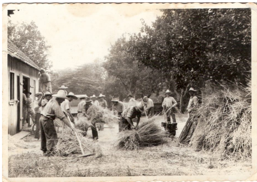
Imagem 9. Imigrantes e descendentes ucranianos de Itapará trabalhando na colheita do trigo na década de 1960.

base de milho moído num instrumento chamado jorna . Percebemos, in loco , que em muitas propriedades de Itapará ainda há, em funcionamento, essa máquina de moer milho. Outra questão significativa para nossa análise, é que existe, por parte da informante, um sentimento de nostalgia do passado, pois afirma que não havia brigas, que as pessoas eram mais unidas e todos se ajudavam. Cabe mencionar, ainda, que a união é uma das principais características do povo ucraniano. Sobre isso, ilustramos, por meio de uma imagem, como eram os mutirões 24 na comunidade de Itapará na década de 1960. 25