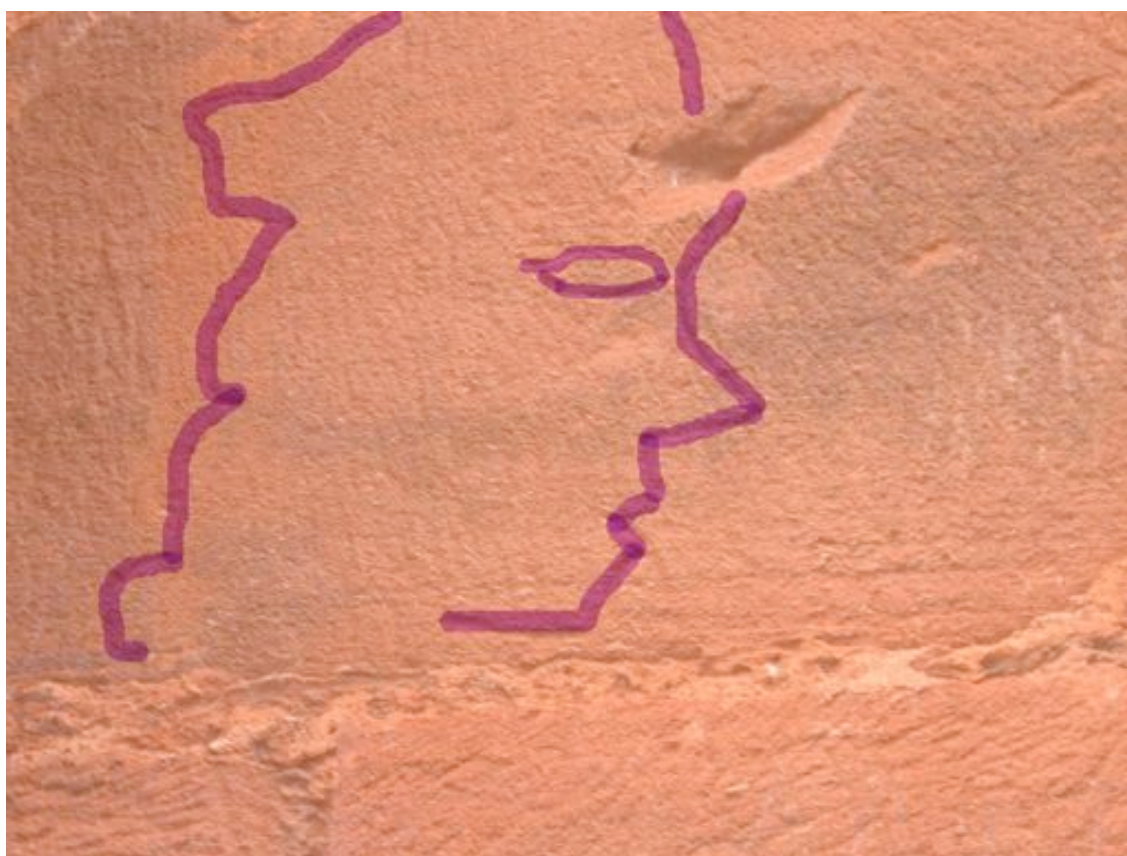
Marca deixada por visitante em parede das ruínas (realce em roxo feito com computador). Indício do tesouro deixado por jesuítas, de acordo com Chico. Setembro de 2006.

a leitura dos 216 medidores residências de água que o lugar tinha em 1988. Somados aos hidrômetros do colégio, da Cooperativa Agrícola e de alguns poucos comércios, cerca de 220 estabelecimentos recebiam água encanada naquele ano. Durante as filmagens ele interrompeu sua fala e pediu para gravarmos um rosto riscado em uma das pedras das ruínas. Na parte superior do desenho havia uma pequena falha na rocha. Chico explicou que muita gente achava que aquela ilustração era uma pista para o tesouro deixado pelos jesuítas. A pedra lascada era sinal de alguma marreta utilizada contra a parede para encontrar o ouro dos padres espanhóis. Ele dizia não acreditar que aquele fosse o esconderijo e até suspeitava se realmente há alguma fortuna por ali. Mas contou que nunca foram encontrados os túneis que permitiam aos jesuítas percorrerem os Sete Povos das Missões sem terem sua movimentação descoberta pelos guaranis. Ninguém jamais descobriu o que os espanhóis guardavam nestas passagens, segundo ele.