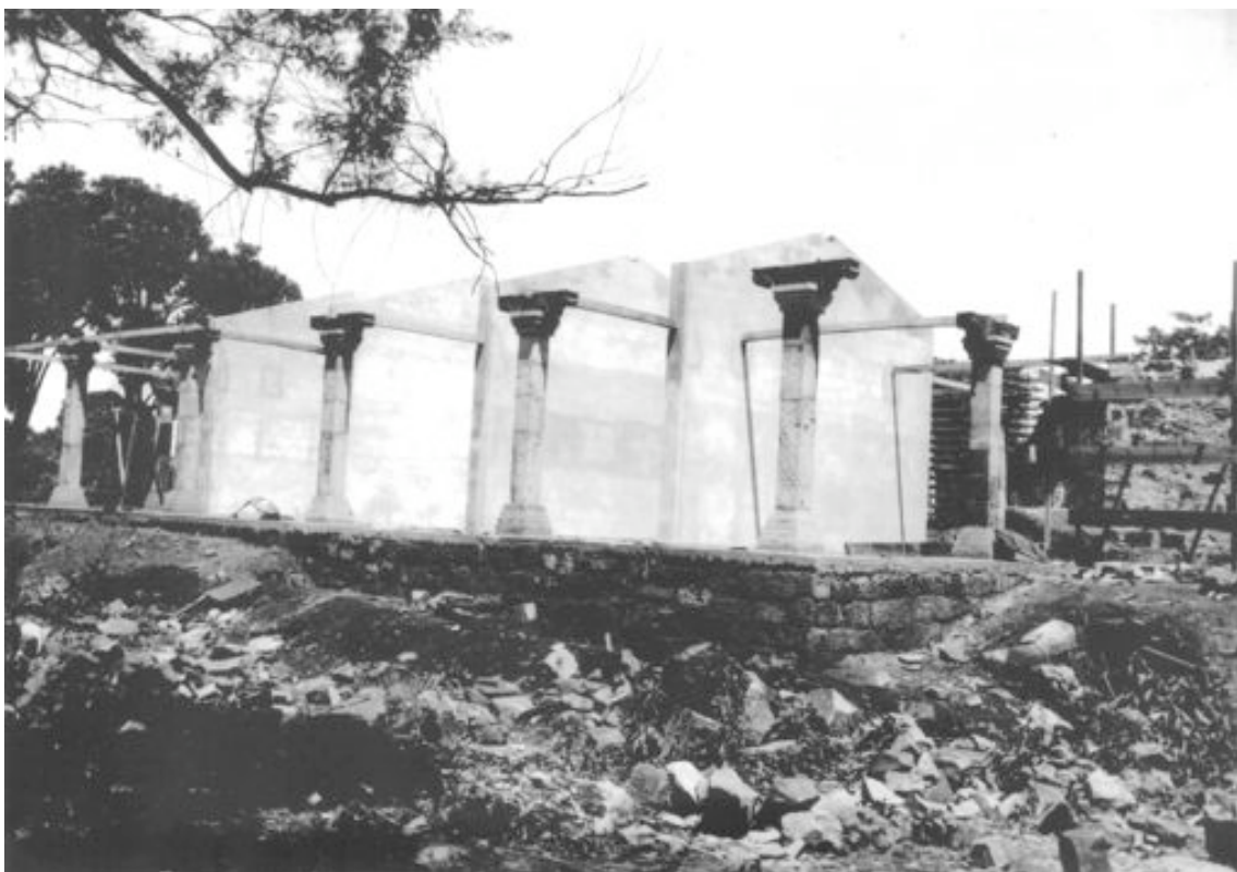
Museu das Missões em construção.