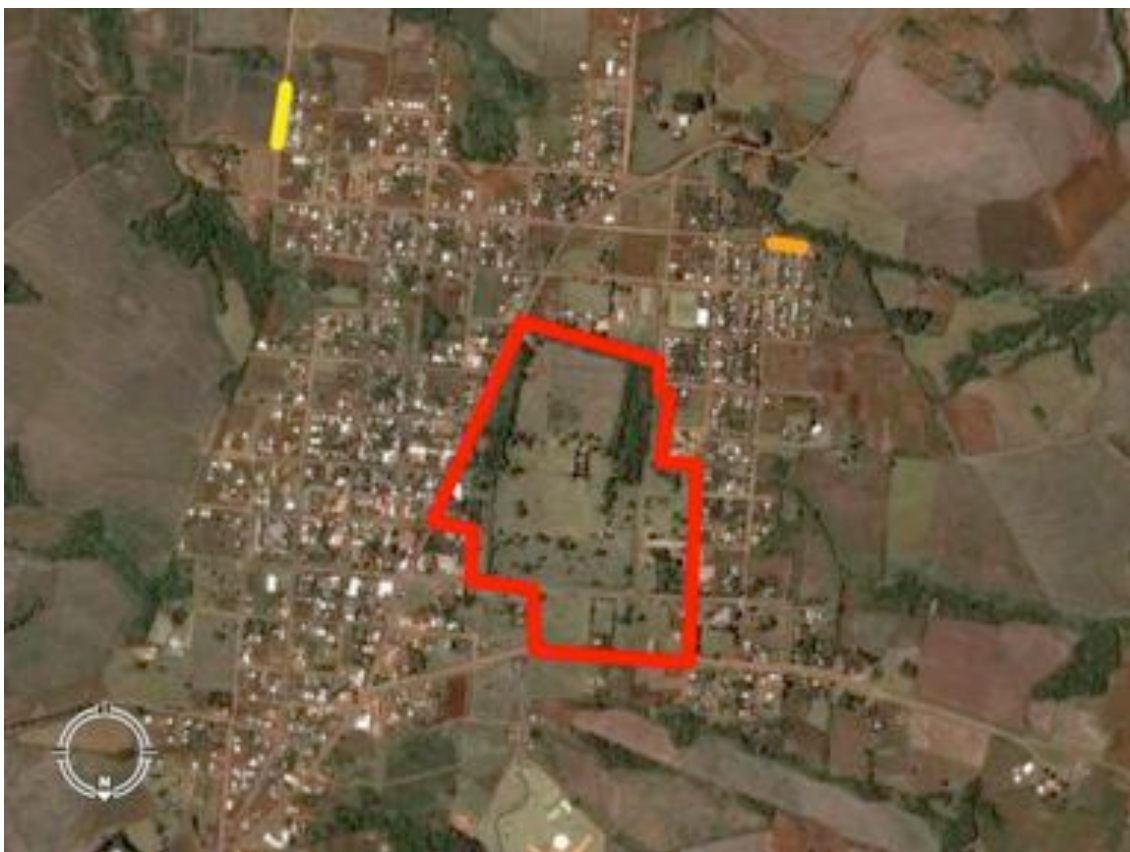
Foto área da zona urbana de São Miguel das Missões em 2006. Em vermelho a área protegida pelo Iphan. Em amarelo e azul, respectivamente, as últimas rua do conjunto habitacional Arco Íris e do Bairro Alegria.

Iphan. O restante dos trabalhadores se ocupava com o pequeno comércio local e também com a escola vinculada ao governo do estado do Rio Grande do Sul, o Colégio Padre Antonio Sepp.