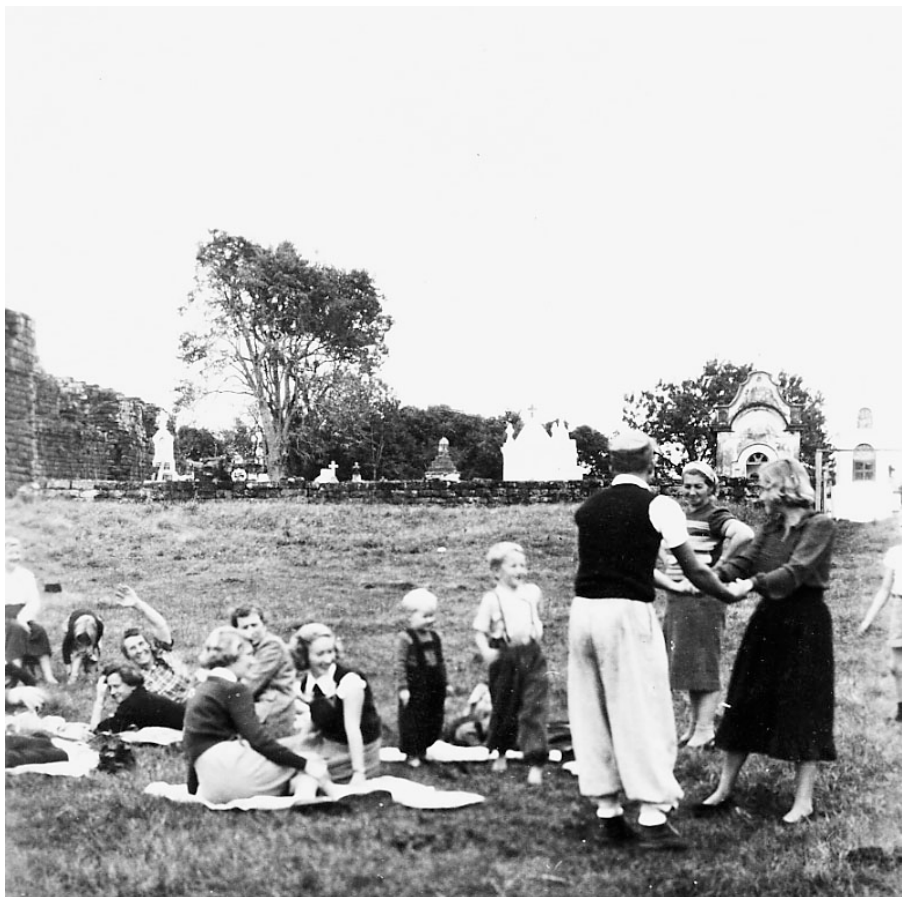
Família reunida para piquenique em frente ao antigo cemitério. Sem data.