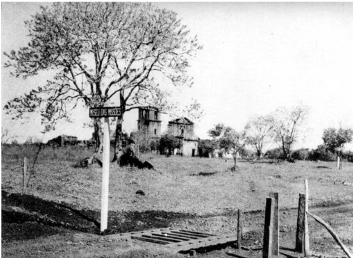
Mata-burro e pequena cerca utilizados pelo Iphan para impedir a entrada de animais na área protegida. Arquivo Iphan – São Miguel das Missões/ RS. Sem data.

Após a restrição do acesso ao local, a medida seguinte foi desapropriar alguns imóveis construídos nas redondezas das ruínas, entre eles a escola, o clube de lazer dos miguelinos, a delegacia e o prédio da empresa responsável pela telefonia no município. Ele conta que antes das duas levadas de desapropriações na vizinhança, a área cercada era pequena e sem muito controle. “Primeiro desapropriaram o restaurante utilizado pelos turistas que passavam o dia nas ruínas e algumas construções mais próximas e depois tiraram um pedaço maior”.