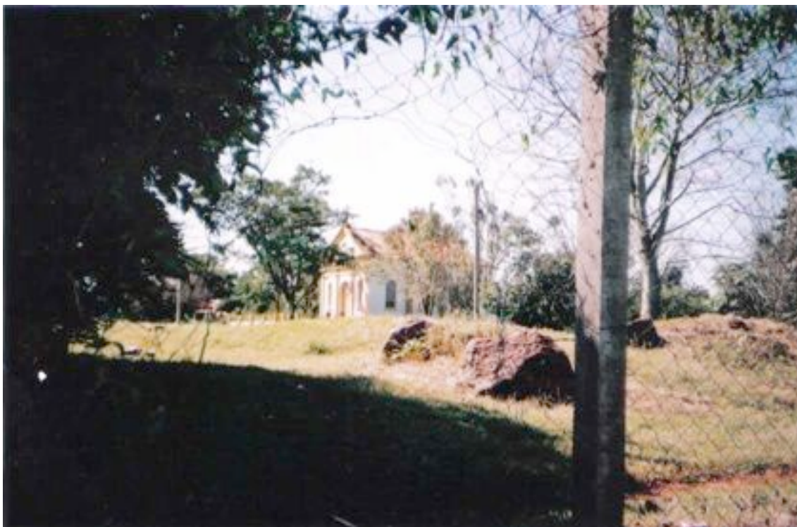
Um dos buracos feitos na cerca que protege a área protegida pelo Iphan em São Migueu das Missões. Abril de 2006.

ele era o responsável por abrir o portão e permitir a entrada dos visitantes. “Pouca gente freqüentava a fonte nessa época. Mas de noite as pessoas iam até lá e retiravam o cadeado, com corrente e tudo. Isso aconteceu tantas vezes que resolveram não colocar mais cadeado. Hoje fica tudo aberto.” Além da fonte, as violações também se estendiam às outras cercas que circundam as ruínas. “O povo não respeita e acaba cortando a tela. É uma judiaria.” É comum encontrarmos os buracos nas telas a que se refere seu Flor. O acesso dos guaranis a casa de passagem localizada no interior do terreno tombado, por exemplo, é feito por um destes orifícios. Outros buracos também permitem aos miguelinos seguirem de suas casas para o trabalho ou para a escola cruzando o interior do Museu.