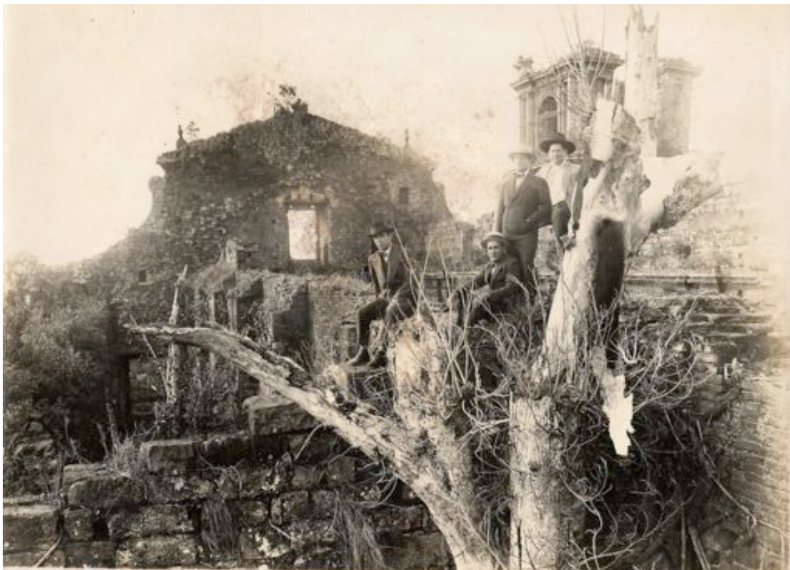
Antes da remoção de árvores do interior das ruínas, famílias aproveitavam as plantas para subirem nas paredes e conseguirem o melhor ângulo para a fotografia. Arquivo Iphan São Miguel das Missões/ RS. Sem data.

ruínas. Os carros estacionavam em frente aos restos do pórtico da igreja e não era raro aparecerem grupos para acampar dentro do patrimônio. O alpendre do prédio modernista construído por Lucio Costa servia de parada de ônibus para aqueles que vinham de outras cidades. Era um museu-rodoviária.