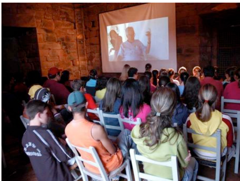
Alunos assistem ao documentário O fim e o Princípio , de Eduardo Coutinho, dentro da sacristia da antiga redução jesuítico-guarani.

O projeto foi dividido em três fases. Uma de exibição de documentários, outra de definição sobre o que filmar e a terceira com a captação e seleção de imagens. Na primeira, os alunos assistiam a alguns documentários para se familiarizar com o tipo de linguagem audiovisual que trabalhariam. Os filmes eram apresentados dentro da antiga sacristia da redução de São Miguel Arcanjo, no coração das ruínas e do Museu das Missões, com as exibições abertas para toda a população. Além de apresentar aos estudantes os jargões cinematográficos, como movimentos de câmera e tipos de enquadramento, as exposições também aproximavam os outros moradores do projeto. A presença de outros miguelinos, que não os alunos, às sessões e a visibilidade que as exibições deram ao Cinema nas Ruínas permitiram que a minha inserção e a dos alunos com câmeras no meio a ser observado fosse realizada de maneira muito receptiva, coisa que dificilmente aconteceria sem esta etapa preliminar. O projeto foi parar em jornais gaúchos e freqüentou algumas TVs durante o noticiário regional e nacional. Essa exposição midiática também facilitou a tarefa de convencer as pessoas sobre a importância de colaborarem com o Cinema nas Ruínas.