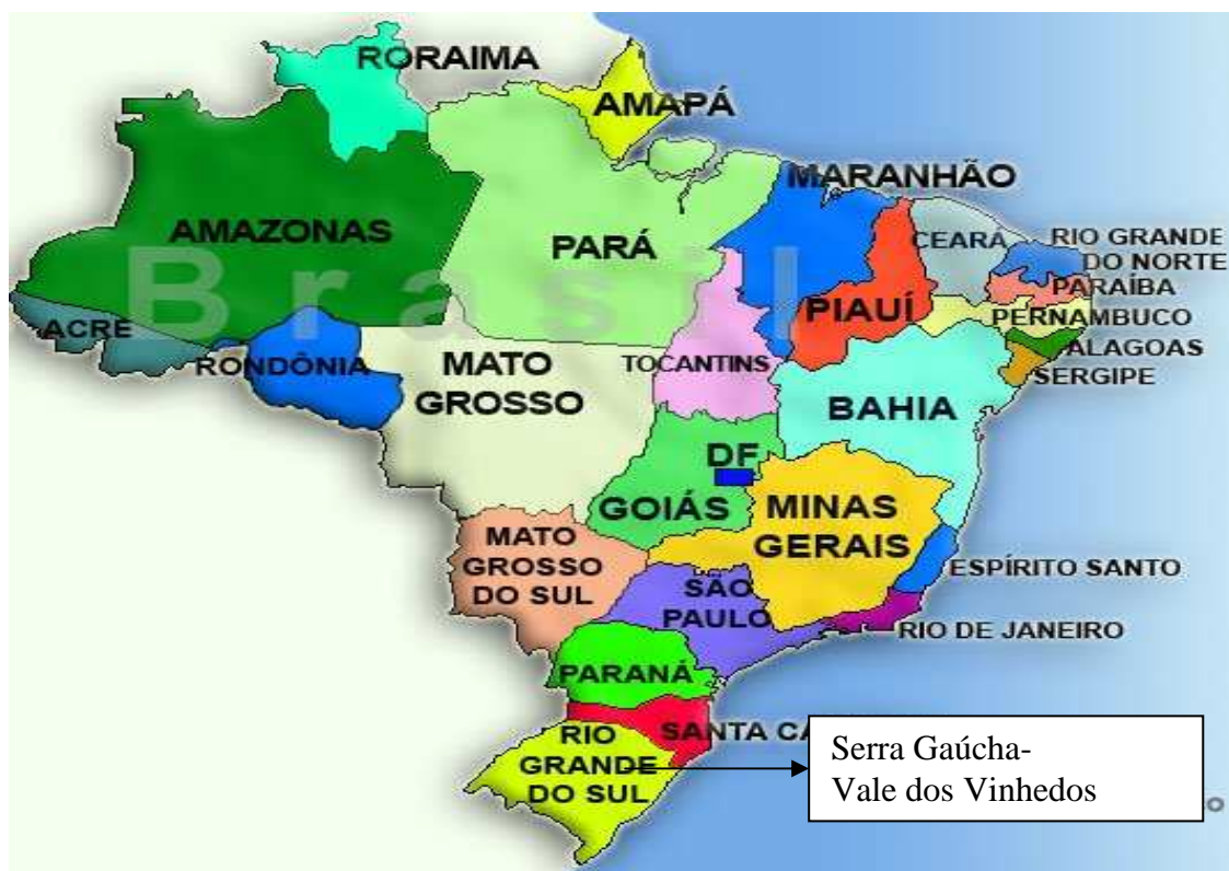
Figura 01: Localização da Serra Gaúcha no mapa do Brasil

A delimitação geográfica (DG) abre-se como uma nova fronteira representacional, está relacionada à área para a produção e comercialização de vinhos com a indicação de procedência 3 (IP) e está mais coerente com os limites socioambientais e práticas culturais da região. Assim, em conformidade com as representações sociais, “as comunidades constroem fronteiras por meio de ações relacionais. Fronteiras podem ser de diferentes tipos, desde geográficas, físicas e administrativas, até linguísticas, religiosas, étnicas, sociais e culturais” (JOVCHELOVITCH, p.134, 2008).