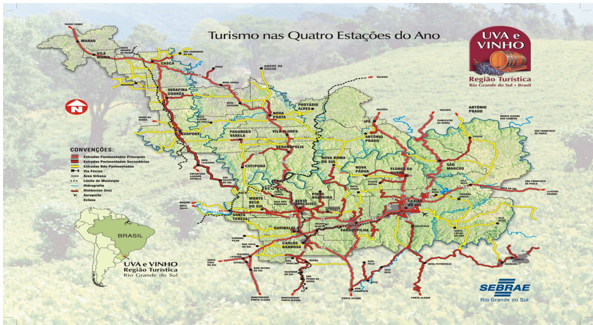
Figura 2: Mapa da Região Uva e Vinho

desenvolvimento do turismo regional são realizadas pela Governança Regional da Atuaserra - Associação de Turismo da Serra Nordeste -, seguindo os parâmetros definidos pelo Programa Nacional de Turismo (PNT) e pela Lei Geral do Turismo n.º 11.771/08, de 17 de setembro de 2008.