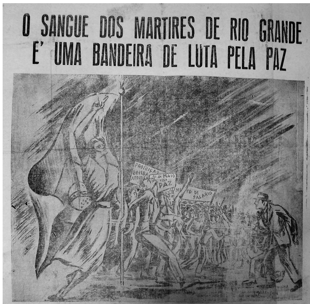
(Fig. 6) Panfleto "O sangue dos mártires de Rio Grande é uma bandeira de luta pela paz".