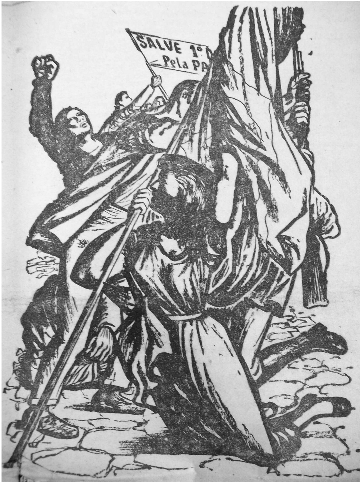
(Fig. 5) Detalhe do desenho da capa do Voz Operária de 13 de maio de 1950.