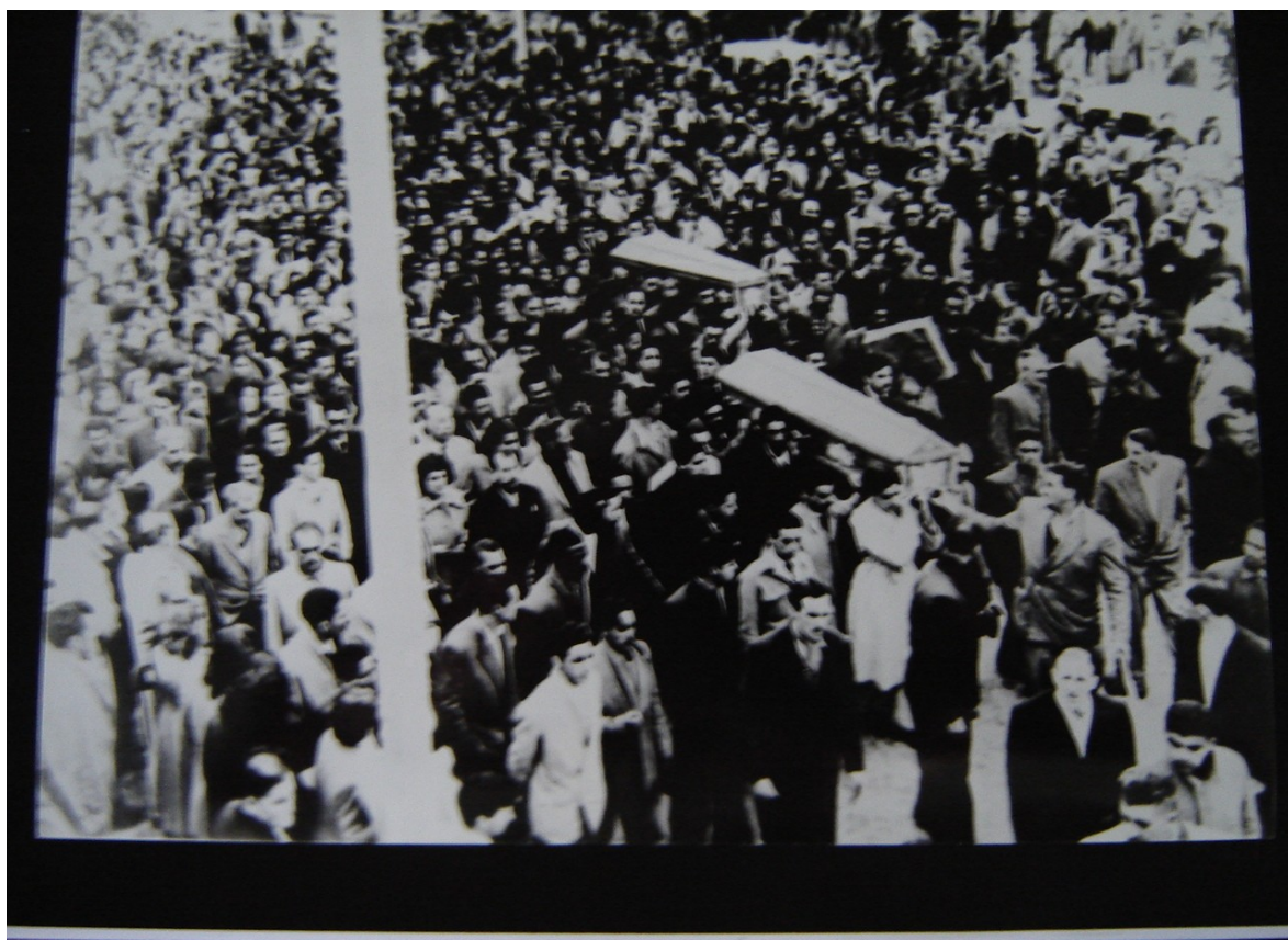
(Fig. 7)Foto do cortejo do funeral dos quatro operários mortos nas manifestações de 1° de maio de 1950 na cidade de Rio Grande.