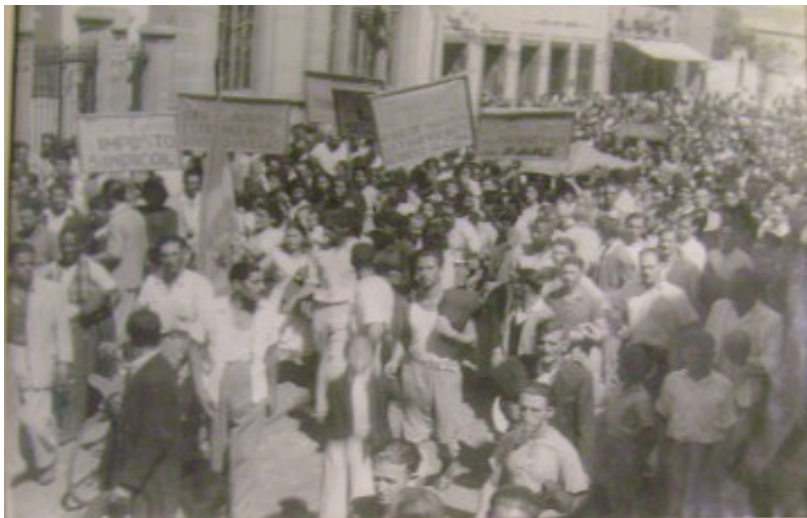
(Fig. 1 e 2): Fotos da manifestação de 8/3/1949. Fotógrafo ignorado. As fotos estão no processo-crime aqui citado.