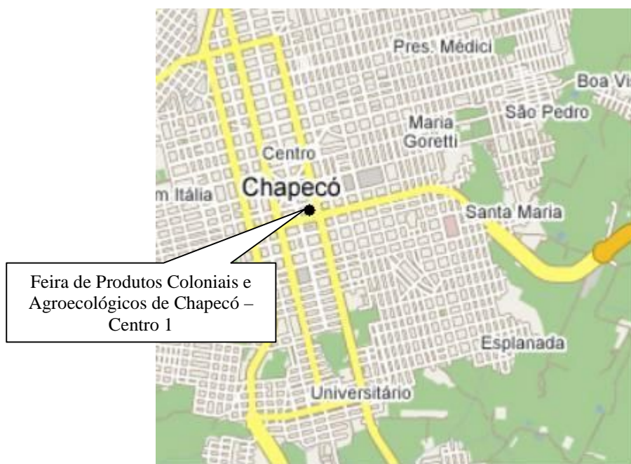
Figura 1. Localização da Feira