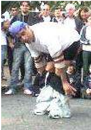
Fig.15. O Homem do Gato