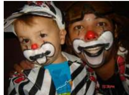
Fig.17. Mixaria e CocaCola