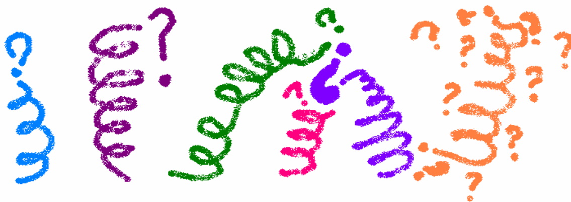
Fig.4. Coisa-brincante sem nome

De repente, escuto a voz de Birindelli, bem firme: “Isto!!! Este salto aí não é Sacchet”. O quê??? Um salto solto, meio louco para o nada? Com formas e impulsos em curto-circuito, eis que finalmente fiquei tão feliz de ter feito uma única coisa que “NÃO ERA SACCHET”, que saltei e saltei, saltei e saltei, saltei e saltei toda uma alegria surpreendente... tão idiota aquilo de estar contente em saltar, que escapou do corpo uma gostosa gargalhada. “É isto aí! Dar risadas, assim, também não é Sacchet”. E dava vontade de rir mais... saltar mais e melhor, tantas formas divertidas que eu poderia saltar ali por horas, desde que continuassem gostando. Meus colegas vibravam, riam muito comemorando comigo, e sei lá que brinde tão bom era aquele... Pipocavam comigo as rufadas de ar nos pulmões, chacoalhavam miolos no cérebro, embaralhavam-se as idéias fixas, que pareciam prontas, num estado de coisas-felizes-em-mim. Tudo tão bobo e intensamente especial. Tudo-ali era apenas uma coisa-brincante, sem nome “clown” ou “palhaço”. Brincando de clownear-palhaçar.