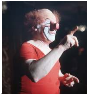
Fig.16. Charlie Rivel