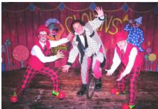
Fig.18. Família Colombaioni