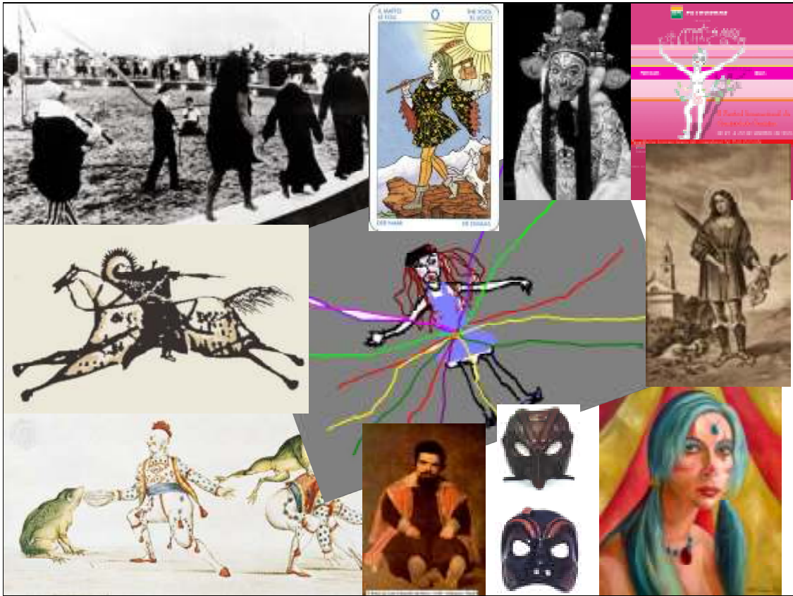
Fig.2. Multiplicidade clownesca

Existe uma origem do clownear? Teria o palhaço se originado nos circos como muitos afirmam? Eis um dos pontos chave da nossa argumentação que não trabalha com a idéia da posse ou exclusividade da arte do clown/palhaço pelo circo, geralmente apoiada na idéia de que a arte do palhaço começou embaixo da lona e somente ali seria legítima.