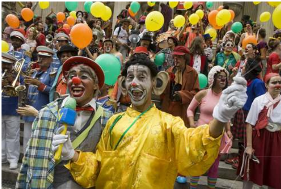
Fig.9. Palhaceata clownesca

teatro também, sempre que necessário, bebeu do circo, para ênfase em um treinamento físico dos atores, criando a dança-teatro, o teatro físico, a biomecânica de Meyerhold, o Circo Contemporâneo. Há clowns, os nossos Trapalhões , com seus filmes, fazendo rizoma com outros cômicos da televisão de outros cantos do planeta: o Chaplin , O Gordo e o Magro , Jerry Lewis, Os Três Patetas , Os Irmãos Marx . Fazem rizoma o Mazaropi e o Buster Keaton, ambos clown-colonus , broncos e ingênuos. E os palhaços contemporâneos, por sua vez, a cada edição dos festivais de palhaços, formam um espesso novelo rizomático, exibindo-se na forma de um grande cortejo de rua como este 40 :