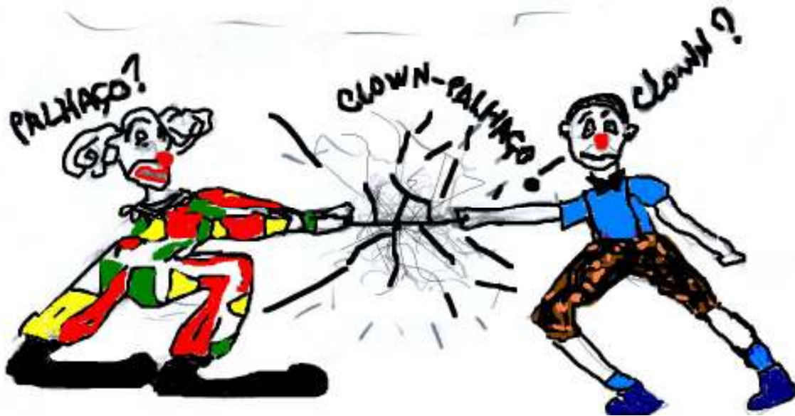
Fig.1. Palhaço versus Clown

Assim começa! Com um aparente cabo de guerra entre um clown 3 e um palhaço, representando as diversas discussões acerca da diferenciação entre eles. E o que alimenta estas tantas diferenciações? Entre eles há uma espécie de novelo com fios emaranhados, envolvendo os aspectos que cutucam estas duas figuras mutuamente. Na imagem, dois tipos, que podemos considerar como sendo estereótipos de um palhaço típico do circo guerreando com um clown típico do teatro, competem e medem forças e, às vezes, nem imaginam o que se passa no meio: um fio de alta voltagem, soltando faíscas - opiniões cotidianas, palhacescas ou clownescas, pesquisadoras circenses, teatreiras, rueiras, apaixonadas, provocativas, não-iniciadas, leigas, enfim, humanas.