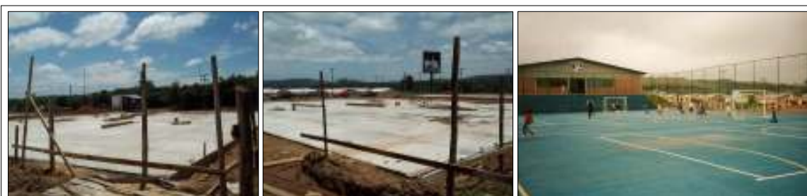
Fig. 3: etapas da construção do centro de atendimento na 5ª unidade da Restinga

Ele pressupunha a criação de um centro de atendimento na zona sul da capital gaúcha, no bairro Restinga, onde crianças, adolescentes e suas famílias seriam atendidos com base em quatro áreas de ação, sendo estas: Serviço Social, Acompanhamento Escolar, Educação Física e Arte.