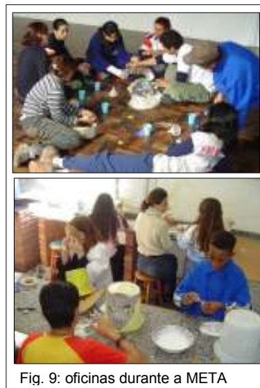
Fig. 9: oficinas durante a META

A idéia de realizarmos a META surgiu quando fomos informados, na Restinga, que a escola da ACM-RS no centro da cidade iria organizar uma campanha do agasalho, enviando as doações para as crianças e jovens que atendíamos. Queríamos superar esta visão assistencialista, em que não existe nenhuma interação entre as pessoas, somente um ato distanciado e com significado minimizado. Nosso entendimento era o de que as relações entre estas duas realidades poderiam ser ampliadas, através de um momento de vivência artística, já