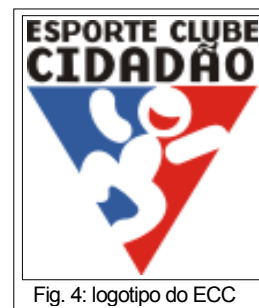
Fig. 4: logotipo do ECC

Como o nome do projeto enviado ao Ministério e à Prefeitura Municipal era Esporte Clube Cidadão, os profissionais da ACM-RS assim se referiam ao local, mais especificamente “ECC”. Mas esse projeto também envolvia a criação de outros centros de atendimento e, quando esses passaram a ser construídos e a funcionar, começaram a chamar o centro de atendimento na Restinga de ACM Vila Restinga Olímpica (ACM VRO). No cotidiano de trabalho, professores, estagiários e demais funcionários passaram a chamar simplesmente de “Projeto”. O entendimento desses tantos nomes é importante, pois diz respeito à época em que cada sujeito esteve vinculado a essa instituição. Alguns dos jovens em suas falas dizem “ACM”, simplesmente, justamente aqueles que participam de ações vinculadas aos outros centros de atendimento, tendo uma visão mais ampla da instituição.