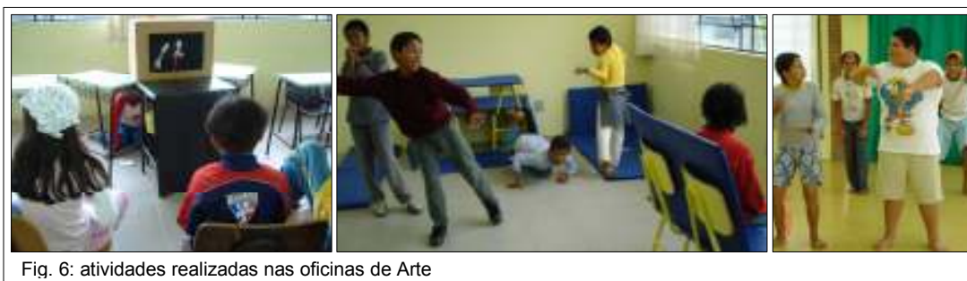
Fig. 6: atividades realizadas nas oficinas de Arte

execução ficava a cargo dos profissionais de cada uma das três áreas de atendimento (na área de Serviço Social, o atendimento era individual ou em grupos de familiares). Cada criança/jovem vinha ao projeto três vezes por semana, em turno inverso ao turno escolar, e passava pelas três oficinas, obrigatoriamente, cada uma com a duração de uma hora e dez minutos, em turmas organizadas segundo a idade dos participantes. No início do Projeto, as turmas eram denominadas pelo ano de nascimento dos participantes, sendo elas: 90/91 – aqueles que tinham onze e doze anos na época; 92/93 – aqueles com nove e dez anos; 94/95 – aqueles com sete e oito anos. Mais tarde, quando os jovens das turmas 90/91 alcançaram seus quatorze anos, o grupo de educadores foi mobilizado a pensar outra forma de atendimento, onde os interesses desses jovens pudessem ser desenvolvidos de maneira mais apropriada. Criamos então o projeto Juventudes, que será abordado adiante.