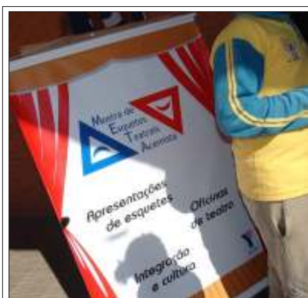
Fig. 8: Mostra de Esquetes Teatrais Acemista

Surgiram sessões de cinema dentro do Projeto, mais tarde ampliadas para sessões de cinema para a comunidade, atividades com oficinas do bairro, festas coletivas com os aniversariantes de cada mês, semanas de teatro, na qual cada turma de uma oficina mostrava sua produção a outras turmas e às famílias, além da Mostra de Esquetes Teatrais Acemista (META), organizada pela equipe da área de Arte do Projeto.