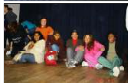
Fig. 11: Mães em cena e após apresentação

mantido pela área. Este grupo, denominado pelas próprias participantes de MECA (Mães Engajadas em Construir o Amanhã) já existia antes desta proposta, e era formado por mães de crianças e jovens que eram atendidos no Projeto. Criaram “Sítio do Picapau Amarelo – Capítulo 1 – O Reino das Águas Claras” a partir de vídeos do programa infantil de televisão e do livro de Monteiro Lobato. Além de se apresentarem nesta mostra, o grupo acabou se apresentando em escolas infantis do próprio bairro, além de realizar outras apresentações dentro do Projeto, para seus próprios filhos e seus colegas.