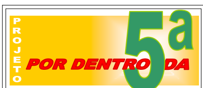
Fig. 5: logotipo do projeto Por Dentro da 5ª

compreensão de que currículo é uma prática social, formado em situações reais e não hipotéticas, devendo ser assim encarado. Dentro dos vários trabalhos que criamos em conjunto, ao longo dos três anos e meio em que trabalhei no Projeto, a invenção desse momento onde estagiários de Arte e de Serviço Social pensariam juntos sobre suas práticas e o currículo que desenvolveríamos junto à comunidade atendida foi especialmente rico.