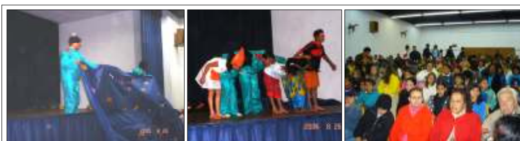
Fig. 10: apresentação de “O Reino Encantado” na META 2004

As atividades realizadas ao longo do ano de 2004, nas oficinas de teatro, possibilitaram o desejo e a decisão de um grupo de jovens de participar desta mostra com um espetáculo. Após semanas de ensaios, envolvendo não somente eles, mas também suas famílias, uma vez que havia diferentes horários para ensaiar e, a cada nova agenda, a família teria de estar de acordo, foi criado o espetáculo “O Reino Encantado” que, por força de uma das músicas da trilha, acabou sendo lembrado como “Os Peixinhos do Mar”.