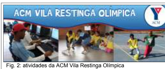
Fig. 2: atividades da ACM Vila Restinga Olímpica

Voltei ao local onde trabalhei por três anos e meio, a Vila Restinga Olímpica (VRO), uma unidade de atendimento social da Associação Cristã de Moços do Rio Grande do Sul (ACM-RS), situada no bairro Restinga, região extremo-sul da capital gaúcha.