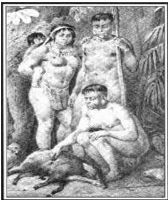
Figura 8: família de índios botocudos (FAYET, 2006).

Os habitantes nus do Brasil quinhentista (Figura 8) causaram profundo desalento ao Pe. Manuel da Nóbrega que tudo fez para vesti-los desde que chegou à Bahia: quis dar a roupa sobressalente dos padres para os índios batizados; pediu roupas ao Pe. Simão Rodrigues; considerou a possibilidade de os próprios índios fiarem o algodão de seus vestidos; e incluiu essa medida no plano geral de aldeamento de 1558.