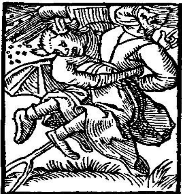
Figura 3: Uma feiticeira e seu demônio cavalcando um fálico cabo de vassoura rumo a um sabá (MOLITOR, 1549).

Mesmo falando em século XVI, Michel Foucault (1988, 2007, 2008) é mais do que pertinente em nossa análise já que ao se preocupar com o corpo visa compreender como o poder influencia e é exercido nos microespaços pelos indivíduos e pelos diversos grupos de uma sociedade. Assim, estudar o controle e o processo de normatização das condutas, atitudes e comportamentos das índias, traduz-se em Foucault numa análise apaixonada e cabível, mas que desencanta a sociedade deste período.