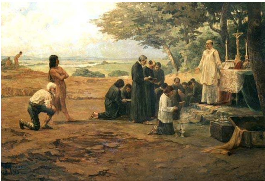
Figura 9: A primeira missa de São Paulo de Piratininga: o marco do nascimento da cidade (FERRAZ, 2004).