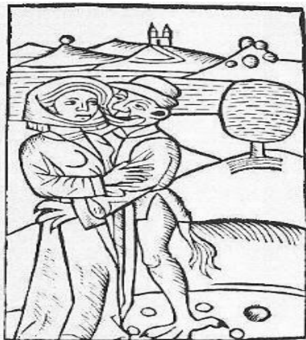
Figura 7: O diabo que faz amor com a bruxa. (MOLITOR, 1489).

Acreditava-se, como mencionado anteriormente, que a mulher tinha ligações íntimas não com Deus, mas com o diabo (Figura 7) – travestido no corpo de uma serpente, por exemplo -, sendo considerada um ser terreno tirado da costela de Adão e motivo da perdição deste e da sua expulsão do paraíso.