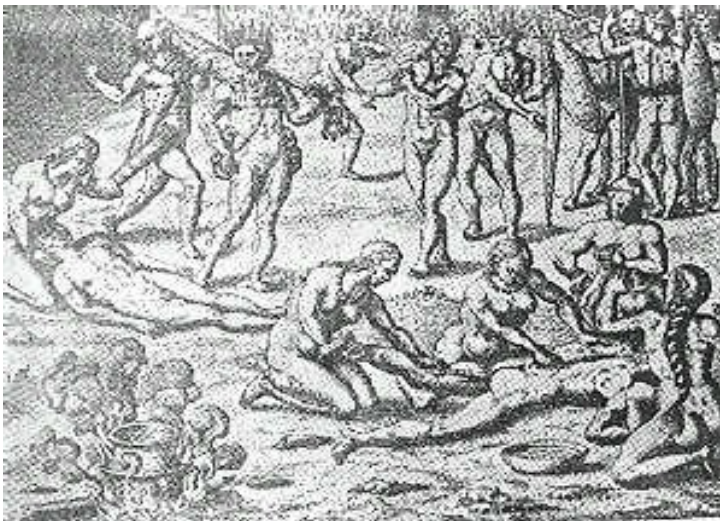
mulheres da tribo retalham o morto (BRY, 1540).

Repugnáva-lhes, antes de tudo, o canibalismo (prática inteligível e assustadora para o missionário), fato que corroborava a visão do ameríndio como ser animalesco, selvagem e monstruoso (Figura 6). Mas inquietava-os, em grande medida, o que consideravam falta de lei, ausência de interdições quanto à exibição do corpo e às relações sexuais.