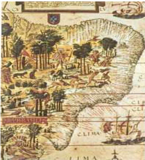
Figura 1: Mapa do Brasil no século XVI

Enquanto D. João III nomeia a Tomé de Souza primeiro Governador Geral do Brasil, o Provincial de Portugal, Simão Rodrigues, nomeia o Pe. Manuel da Nóbrega para fundar a nova Missão além-mar. A 29 de março de 1549 chegam a Bahia (Figura 1) onde se instala a sede do Governo Geral (FERREIRA, 1957). Curioso, porém, é a nomeação de Nóbrega para esta missão evangelizadora, pois quem recebera licença de D. João para desembarcar em solo brasileiro, e lá permanecer por três anos, foi o Ir. Simão Rodrigues (FERREIRA, 1957; LEITE, 1955b).