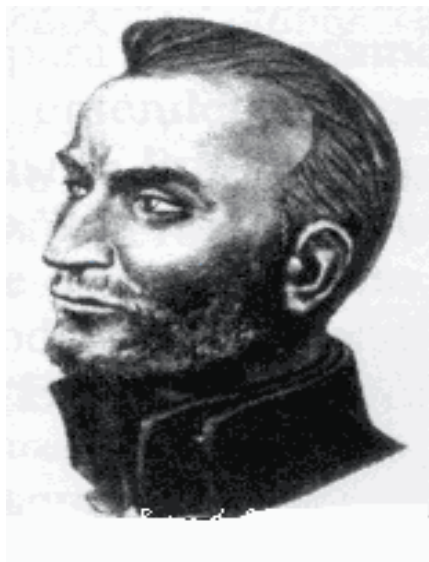
Figura 2: Busto do Pe. Manuel da Nóbrega (BAIRRO DO CATETE, 2009).