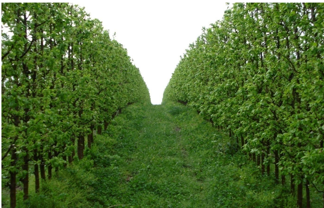
Figura 03 – Filas do pomar onde se efetuou a poda radicular em plantas de Pyrus communis cv Abbé Fetel, Vacaria, RS, 2007.

analógico, obtendo-se o diâmetro médio das plantas; volume de copa, obtido pelas medidas de largura, espessura e altura da copa, medida a partir da inserção do primeiro ramo basal do tronco com o auxílio de uma fita métrica; comprimento de 5 ramos aleatórios de cada planta, demarcados aleatórios na mesma, medido através de uma fita métrica; contagem do número de gemas dos mesmos 5 ramos demarcados, para estabelecer a relação entre número de gemas e comprimento de ramos; após o período de pegamento dos frutos, foram contados o número total de frutos de cada planta para avaliação da produção e determinação das relações entre tronco e número de frutos; e volume de copa e número de frutos.