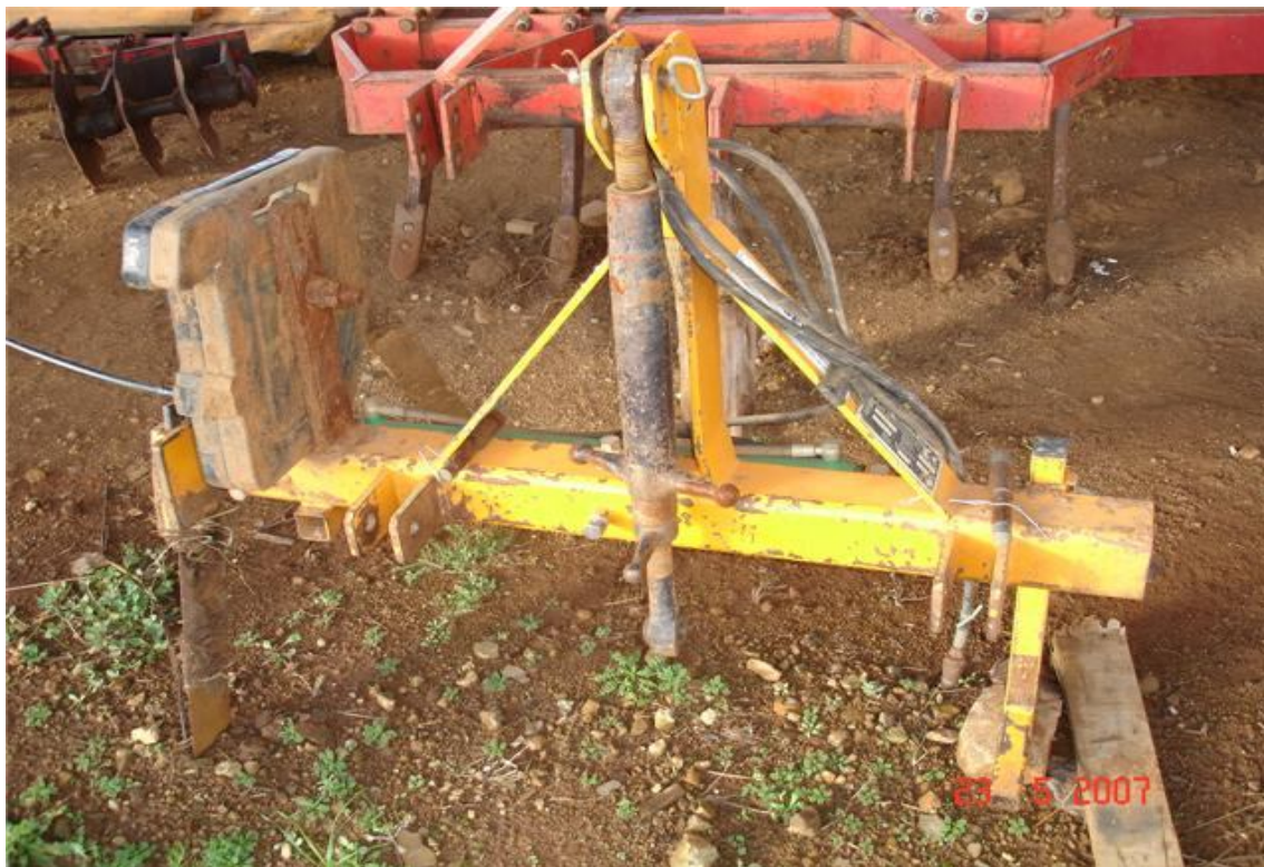
Figura 02 – Implemento usado para efetuar a poda radicular em pêras cv. Abbé Fetel, na Empresa Frutirol, Vacaria, RS, 2007.

Em ambos os tratamentos o corte radicular foi efetuado em uma profundidade aproximada de 30 a 40cm. Os tratamentos foram dispostos em blocos casualizados, com cinco tratamentos e quatro blocos, cada tratamento com cinco repetições, cada repetição, composta por duas plantas, totalizando 20 parcelas. As bordaduras das parcelas foram de 5 plantas em cada lateral. Foi realizada a comparação de médias pelo teste de Tukey em nível de 5% de probabilidade de erro. Após a coleta dos dados, procedeu-se à análise estatística dos mesmos, utilizando-se o programa estatístico WinStat.