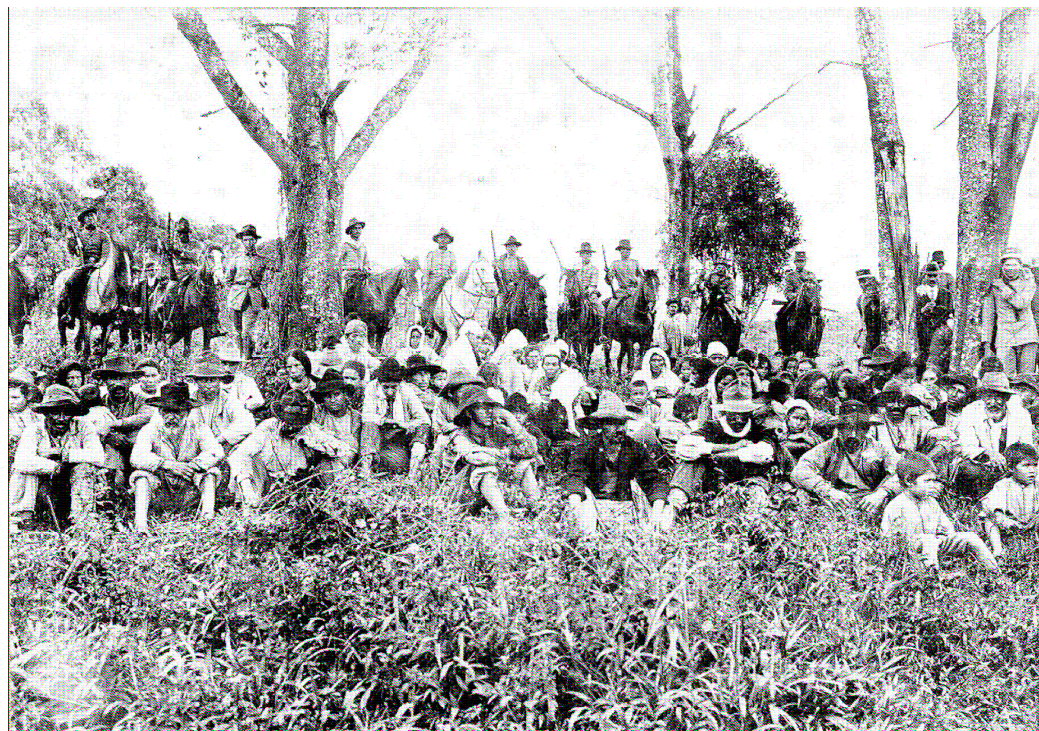
Grupo de rebeldes do reduto de Antônio Tavares aprisionados pela Coluna de Leste, destacando-se a presença de mulheres e crianças

A imagem estereotipada do trabalhador rural se renovaria assim, no próprio processo da intervenção armada contribuindo decisivamente para consolidação da hegemonia capitalista. O estigma a que foram submetidos os caboclos que lutaram no Contestado e também aqueles que, mesmo sem a participação efetiva na Guerra, carregavam as características físicas do caboclo (em comparação com os europeus), após a guerra e até bem recentemente, podem ser encarados com as marcas mais perenes e cruéis desta violência simbólica 117 .