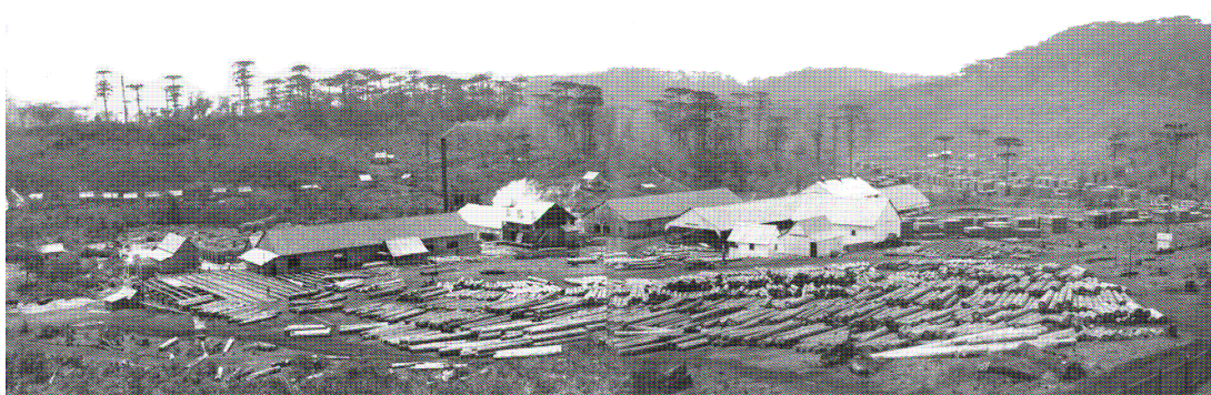
Serraria da Fazenda São Roque, em Calmon.