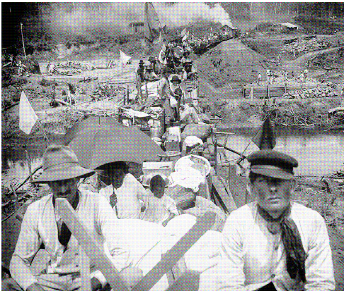
Fonte: D'ALESSIO, Vito. Claro Jansson : o fotógrafo viajante. São Paulo: Dialeto Latin AmericanDocumentary, 2003. p. 27 apud VALENTINI, 2009, p. 106

Catarinense, pois como o caboclo resistiu decisivamente também a esta nova modalidade de intervenção, só restaria ao Estado a violência explícita da Guerra, mas isso é assunto para os próximos capítulos.