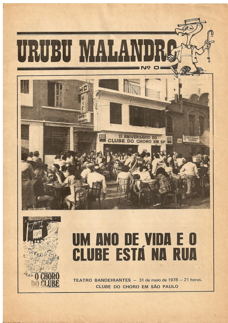
Capa do Urubu Malandro n. Zero (1978).