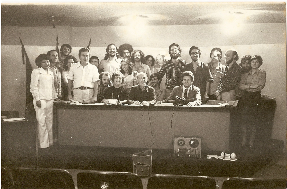
Posse da primeira diretoria do Clube do Choro, no Auditório Vladimir Herzog: 1977. Para maiores informações sobre a composição da Diretoria, consultar o Capítulo II.