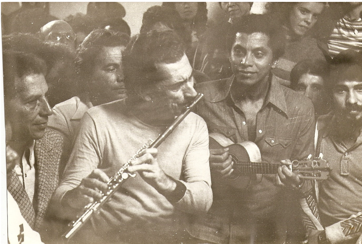
Show promovido pelo Clube no Sindicato dos Jornalistas do Estado de São Paulo em 1977. Em primeiro plano Paulinho da Viola ao cavaquinho e Carlos Poyares na flauta.

sócios e deu uma feição mais profissional ao Clube. Ela trabalhava em plantões de segunda a sexta-feira, das 14 às 17 horas, tratando de assuntos gerais do clube e também da filiação de novos sócios.