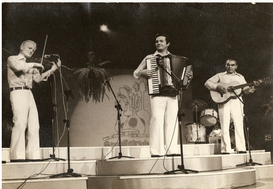
Trio D'Angelo, ligado ao Clube do Choro, no Festival 'Brasileirinho', em 1978.

Apesar do Clube do Choro de São Paulo não estar diretamente envolvido na produção do festival, ajudou a divulgar e até mesmo inscreveu alguns participantes. Através de seu presidente, o Clube esteve bem no centro da polêmica 'tradição versus inovação', que tomou conta dos jurados. Os membros do Clube fizeram questão de apoiar seu presidente, uma vez que um dos objetivos das pesquisas do Departamento de Arquivo e Memória era conhecer o passado para modificar o futuro. Além disso, foi através do Clube que Araújo conheceu o intérprete de seu choro no Festival: