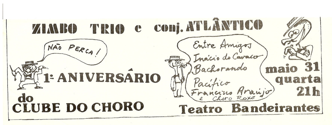
Convite do Show de primeiro aniversário do Clube no Teatro Bandeirantes (1978). Desenhado por Laerte.