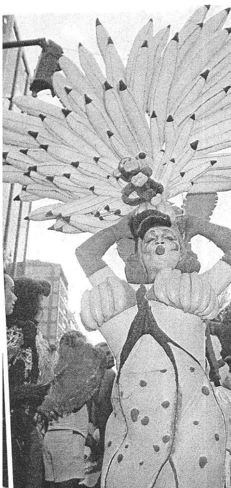
Figura 15: As famosas bananas de Carmen Miranda inspirando uma fantasia na antiga Banda da Carmen Miranda. (Revista Manchete, 10 de março de 1990)