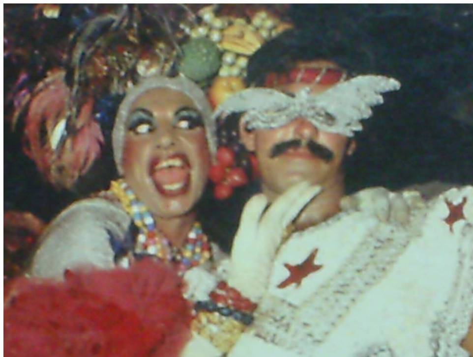
Figura 17: Carmen Miranda e seu mascarado no Grande Gala Gay. (Revista Fatos e Fotos/Gente, 08 de março de 1982)