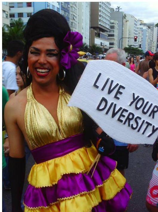
Figura 6: A versão drag da polêmica cantora britânica Amy Winehouse pede que todos “vivam a sua diversidade” na Parada Gay carioca de 2008.