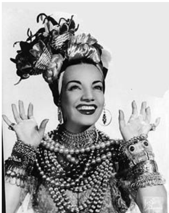
Figura 14: Carmen, em uma foto publicitária tirada logo após sua chegada aos Estados Unidos. (BARSANTE, Cássio Emmaniel. Carmen Miranda . Rio de Janeiro: ELFOS Editora, 1995, p.49.)

Em Bananas is my business , a famosa jornalista cinematográfica Luella Hopper, interpretada pela atriz Cynthia Adler, diz que