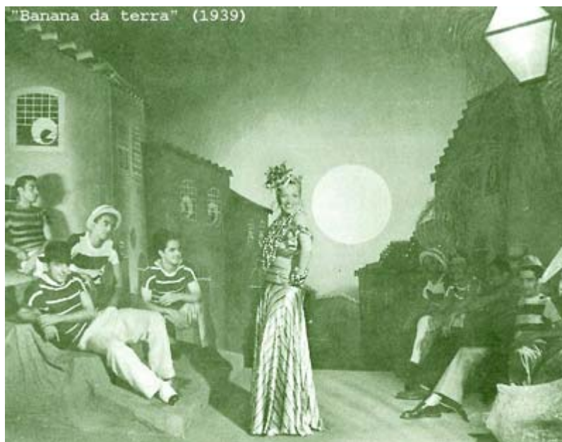
Figura 13: A primeira baiana de Carmen Miranda, no filme Banana da terra , de 1939. (FERREIRA, Felipe. O livro de ouro do Carnaval brasileiro . Rio de Janeiro: Ediouro, 2004, p. 259)

Carmen soube aproveitar ao máximo tudo o que esta indumentária tinha a lhe oferecer. Com grande senso de oportunidade, a artista provavelmente intuiu que vestir baianas extravagantes (e apelar para o humor) seria uma grande estratégia para o sucesso de sua carreira norte-americana. Quando foi para os Estados Unidos, Carmen declarou que, em sua bagagem, levava os seus grandes trunfos: