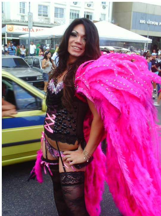
Figura 2: Gisele Bündchen, top model brasileira, ganha sua versão drag na Parada Gay do Rio, em 2008.