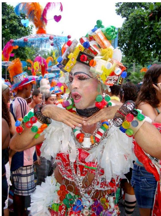
Figura 25: Carmen na sua versão reciclável, toda feita com materiais reaproveitáveis, na Banda de Ipanema em 2009. (Acervo do autor)