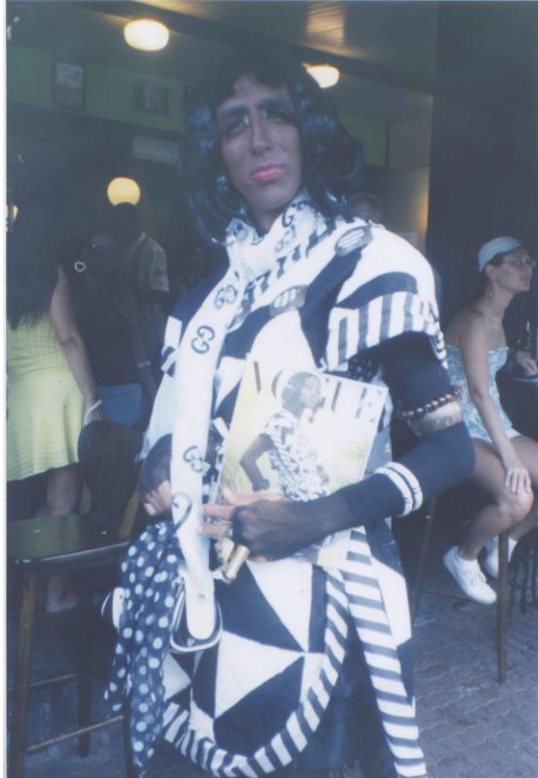
Figura 1: Uma drag queen “incorpora” a modelo britânica Naomi Campbell na Banda de Ipanema durante o Carnaval de 2007.