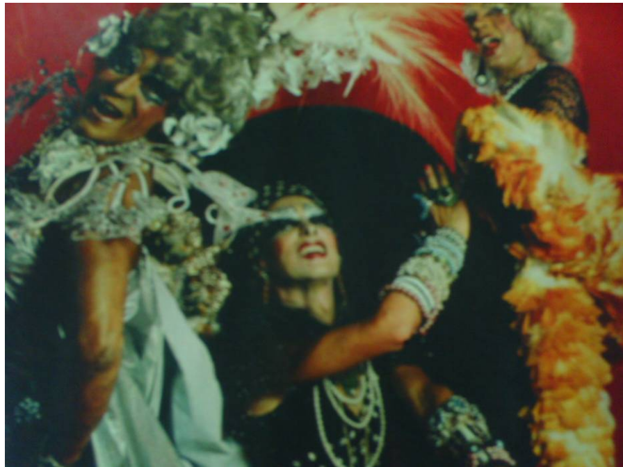
Figura 4: Grupo de caricatas posa para ensaio fotográfico.