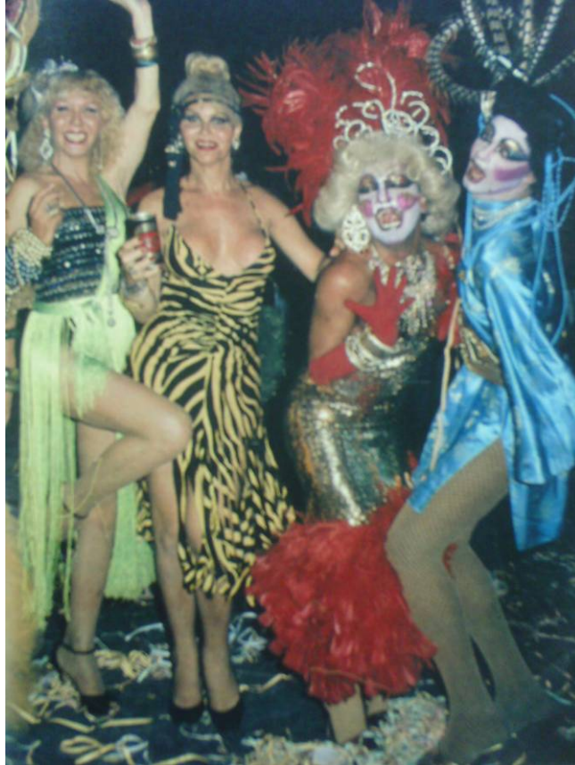
Figura 11: Caricatas e travestis juntas no Grande Gala Gay (Revista Manchete, 20 de fevereiro de 1982)

A impressão que algumas reportagens dos anos 80 passam é que o Grande Gala Gay, apesar de conter em seu título a palavra gay e ser freqüentado por grande número de travestis – indivíduos que, para o senso comum brasileiro, costumam ser associados à marginalidade e que são por natureza transgressores dos papéis heteronormativos de gênero (TREVISAN, 2007) -, era um evento bastante adequado aos padrões de bom comportamento social, diferente da zona da Avenida Gomes Freire e da Praça Tiradentes. A Manchete de 05 de março de 1983 mostra o quão “civilizado” era o GGG: