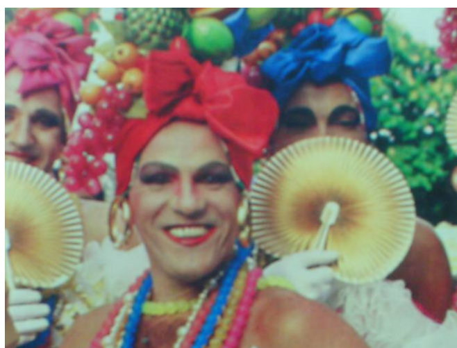
Figura 18: Um grupo de Carmens na Banda da Carmen Miranda, nos anos 80. (Revista Fatos e Fotos/Gente, 10 de março de 1984)