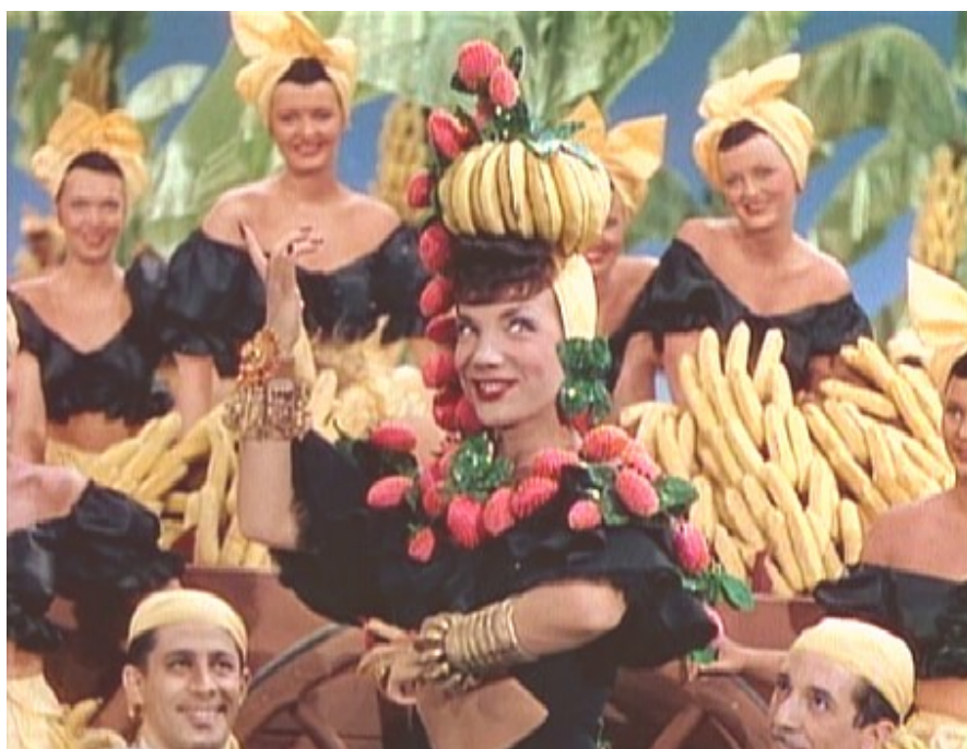
Figura 20: Carmen, na clássica cena de Entre a loura e a morena , quando canta The lady with the titti frutti hat . (BARSANTE, Cássio Emmaniel. Carmen Miranda . Rio de Janeiro: ELFOS Editora, 1995, p.27.)

Neste filme, fica bastante evidente a qualidade da performance da estrela. A sua atuação é bem diferente da dramaticidade normalmente exigida pelo cinema. Carmen faz parte da trama, mas ao mesmo tempo está para além dela. Foi atuando como uma performática, e não como uma atriz convencional, que Carmen conquistou Hollywood. Ela levou para os filmes uma bem-sucedida fusão de vários elementos do espetáculo (música, representação, dança, comédia, moda). (ver figura 20)