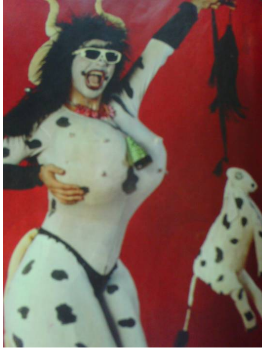
Figura 3: caricata vestida de “mulher-vaca”. (Revista Fatos e Fotos/Gente, março de 1981)