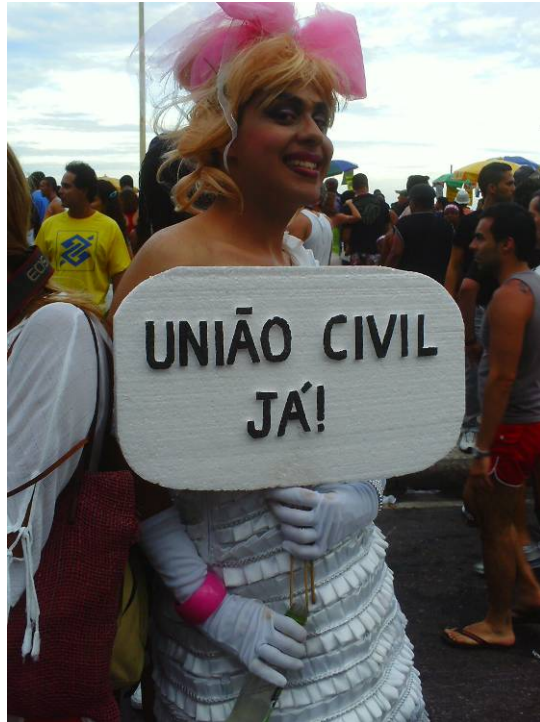
Figura 5: Drag queen ou caricata? Na Parada Gay carioca de 2008, ela fez o seu manifesto político, pedindo a legalização da união civil homossexual.