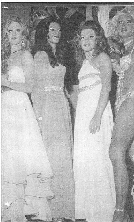
Figura 9: “Travestis” no Baile dos Enxutos.