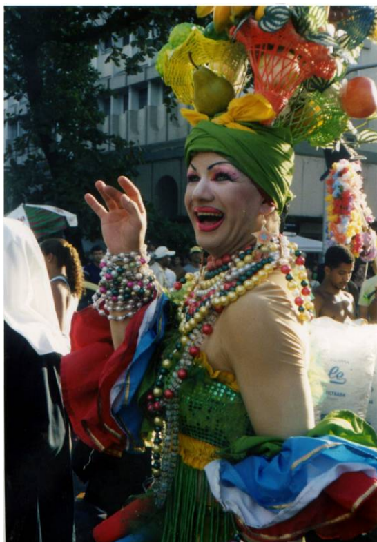
Figura 24: Mais uma “Carmen Drag” na Banda de Ipanema, em 2007.