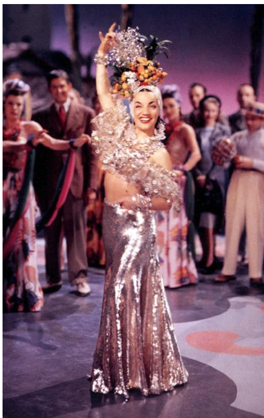
Figura 12: Carmen Miranda, com a sua linda baiana cor de prata, no filme Uma noite no Rio . (BARSANTE, Cássio Emmaniel. Carmen Miranda . Rio de Janeiro: ELFOS Editora, 1995, p.15.)

interessavam, excluindo outras, exagerando e colorindo algumas para, assim, dar à luz o seu personagem glamourizado 120 . As baianas que a estrela tanto viu na capital fluminense foram um produto primeiramente consumido por ela e depois por todas as drags que a representaram (e ainda representam) que, por sua vez, também transformam a imagem da artista de acordo com as suas necessidades de fazedoras cotidianas da cultura popular. (STOREY, 2003) E a sofisticação que ela conferiu às suas baianas provavelmente foi também uma forma de diferenciá-las de todas as outras mulheres vestidas de tal modo; quem mais, além de Carmen, seria dona de trajes tão especiais? (ver figura 12)