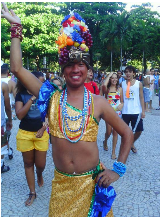
Figura 26: Uma Carmen Miranda vinda do Nordeste para brincar na Banda de Ipanema, em 2009.