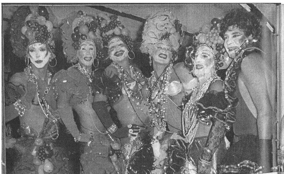
Figura 16: O grupo Irmãs Sisters homenageando Carmen Miranda no Grande Gala Gay.