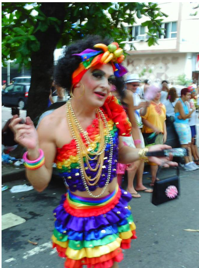
Figura 22: Outra carmen na Banda de Ipanema de 2008.