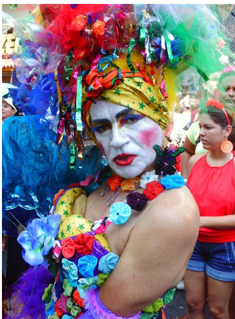
Figura 21: Versão drag queen de Carmen Miranda na Banda de Ipanema, no Carnaval de 2008.

encontradas na Banda de Ipanema, fato que comprova duas coisas: a primeira é que este bloco, de fato, congrega grande parte dos foliões homossexuais cariocas da atualidade; a segunda, mais importante, é que, mesmo depois de tantas décadas, a imagem da Pequena Notável ainda é fortíssima no imaginário gay. Viva Carmen Miranda!