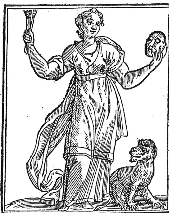
FIGURA 1 – Imitatione FONTE – RIPA. Iconologia . p. 182.