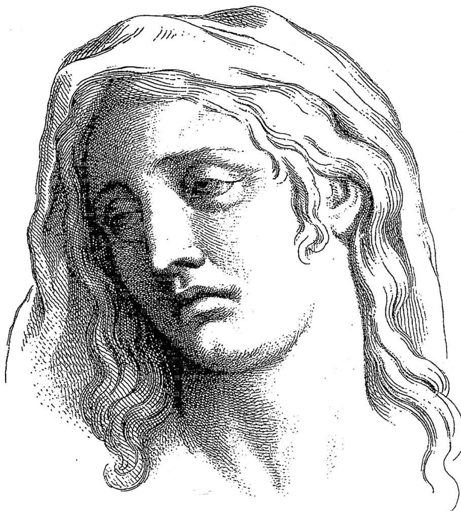
FIGURA 5 – La Tristesse FONTE – LE BRUN. Expressions des passions de l'âme . [p. 12?]