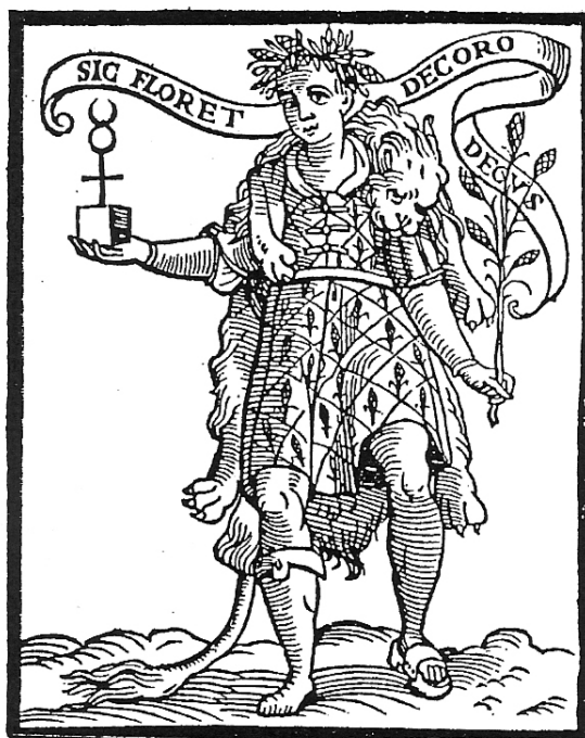
FIGURA 3 – Decoro FONTE - RIPA. Iconologia . p. 91.

Del Signor Giovanni Zarattini Castellini.