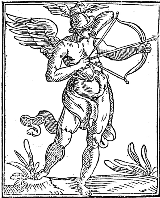
FIGURA 2 – Ingegno FONTE – RIPA. Iconologia . p. 188.

O engenho, sendo um jovem de aspecto vigoroso e corajoso, mostra que a potência intelectual jamais envelhece. Tal vigor é reiterado pela cabeça armada com um elmo e pelo olhar orgulhoso. A águia sobre o elmo, assim como as asas nas costas, significa que os homens de alto engenho alçam vôos muito mais altos que os demais e que possuem uma visão bem mais aguda. Ora, partindo desse último termo, já podemos mencionar a agudeza, a qual, como veremos adiante, é produzida pelo engenho, com base na descoberta de semelhanças entre as coisas. Essas investigações e seu resultado agudo são representados pelo arco e pela flecha, cuja ponta, aguda , mira um objetivo certo.