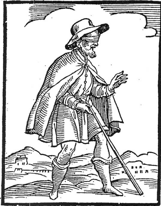
FIGURA 4 – Errore FONTE – RIPA. Iconologia . p. 119.

Um dos principais erros cometidos pelo poeta é edificar suas certezas, seus projetos sobre bases instáveis, que ele acreditava sólidas: