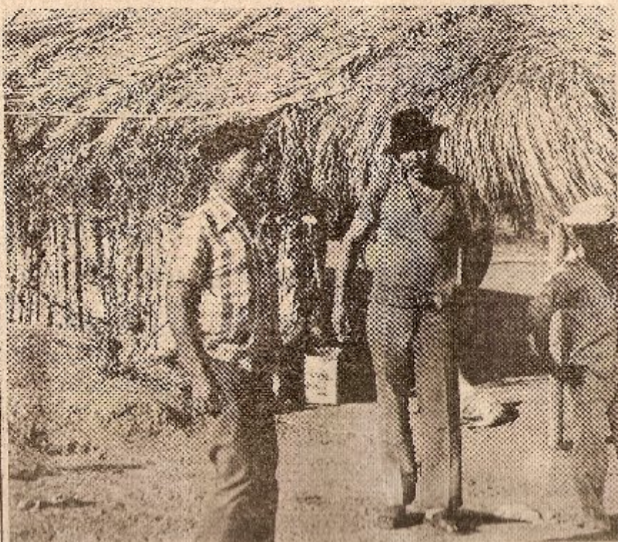
Alguns dos índios da reserva indígena de Rodoquena

cujos contratos terão vigência até janeiro de 1985. Atualmente estão dentro da área indígena, 409 famílias de posseiros, aproximadamente 1.900 pessoas. Além desses, encontram-se 34 arrendatários, que assinaram contratos com a Funai para exploração com agricultura e pecuária, garantindo um rendimento anual para a Fundação de Cr$ 200 milhões. Ainda não foi definida a prorrogação por