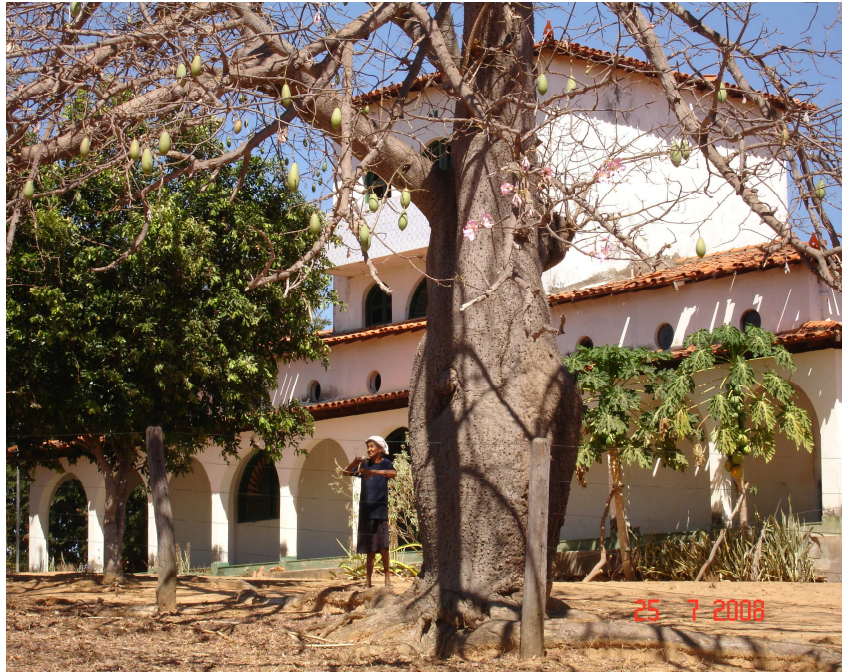
FIGURA 2 – Sede da Fazenda Caitité

Possui uma piscina com aproximadamente 15 metros de comprimento, 7 metros de largura e 2 metros de profundidade.