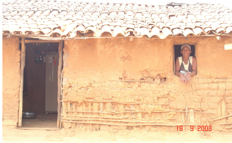
FIGURA 4 – Moradia típica de ex- posseiros da região de Cachoeirinha

A sede dessa fazenda se contrasta com todas as casas dos posseiros que ainda restam na região e, também, com as casas que, na atualidade, foram construídas nos assentamentos (FIG. 4).