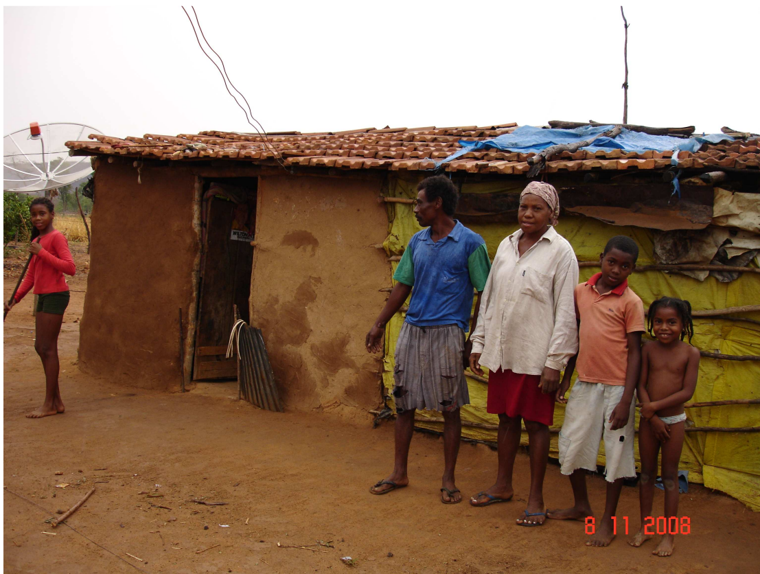
FIGURA 13 – Casa construída, por família de assentado, em um lote de agrovila

Ainda, em conformidade com esse técnico, a Unidade Técnica Estadual (UTE) 25 já autorizou a retirada do material das casas (telhas, madeiramentos, portas, janelas, etc.), para ser utilizado nas casas construídas nos lotes.