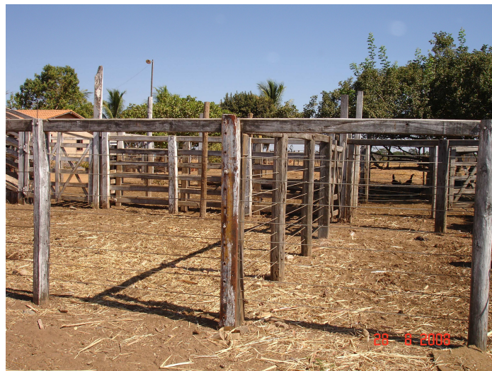
FIGURA 6 – Curral comunitário de embarque de gado

O espírito comunitário também é visível nesse assentamento. No lote de um dos assentados, foi construído um curral de embarque de gado, que é utilizado por todos os outros assentados, sempre que necessário (FIG. 6).