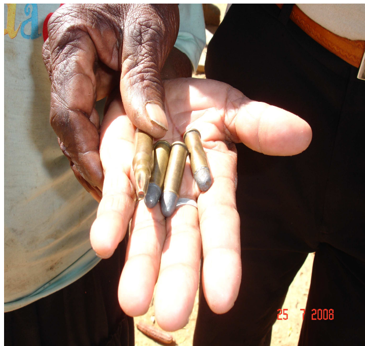
FIGURA 1 – Cartuchos de munição utilizados no conflito de Cachoeirinha

ainda guarda alguns cartuchos de munição (FIG.1) que foram disparados contra a sua casa, no período do conflito. Outra posseira, hoje com 71 anos, também, diz manter guardados, na residência da filha em Belo Horizonte, jornais que noticiaram sobre o conflito de Cachoeirinha.