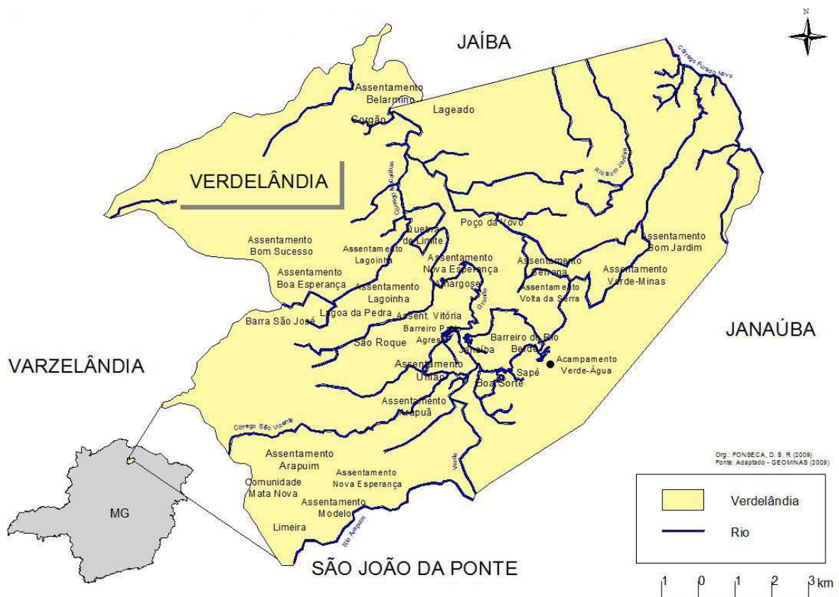
FIGURA 7 – Localização geográfica dos assentamentos e das comunidades rurais de Verdelândia