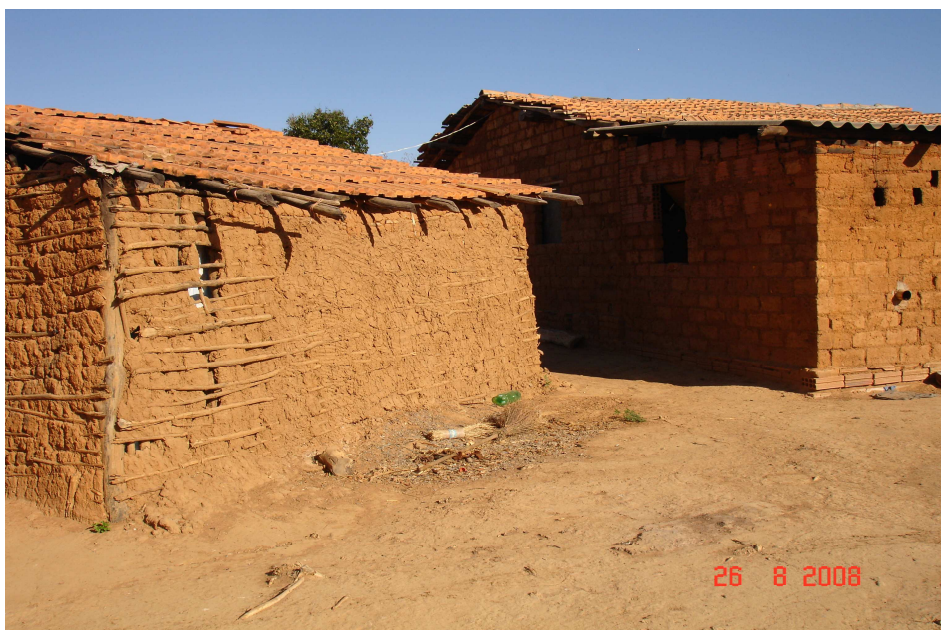
FIGURA 8 – Construções de filhos de assentados, nos lotes

Conforme apresentam os Quadros 3 e 4, percebe-se a existência de um significativo número de famílias de assentados/acampados rurais. No município, há um total de 473 famílias, entre assentadas e acampadas. Esses números podem ser aumentados, se levar em conta os filhos casados residentes nos lotes. Em muitos lotes, encontram-se construções que atendem a essas novas famílias (FIG. 8).