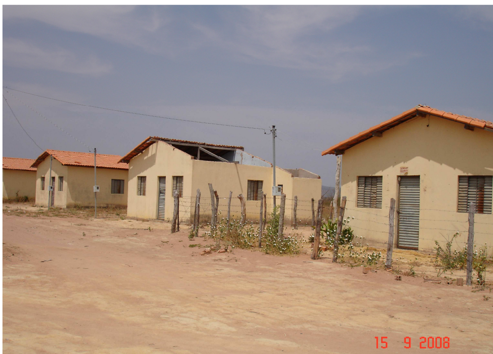
FIGURA. 12 – Assentamento Serrana, agrovila

A TAB. 9 apresenta o número de construções nos assentamentos de agrovilas, em proporção ao número das famílias que residem nas casas. Consta-se que o índice do total de abandonos das casas é de 58,8%.