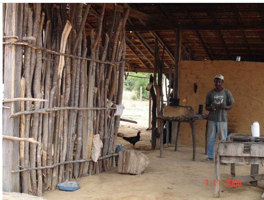
FIGURA 9 – Moradia do assentamento Modelo

No assentamento Modelo, apesar de decorridos 4 anos da sua regulamentação, famílias ainda residem, precariamente, nas construções da antiga fazenda e em barracos de lona preta (FIG. 9). Somente no segundo semestre do ano de 2008, o INCRA liberou recursos para construções de 17 casas das 20 famílias residentes no local, sendo que 3 delas ainda aguardam por soluções de pendências.