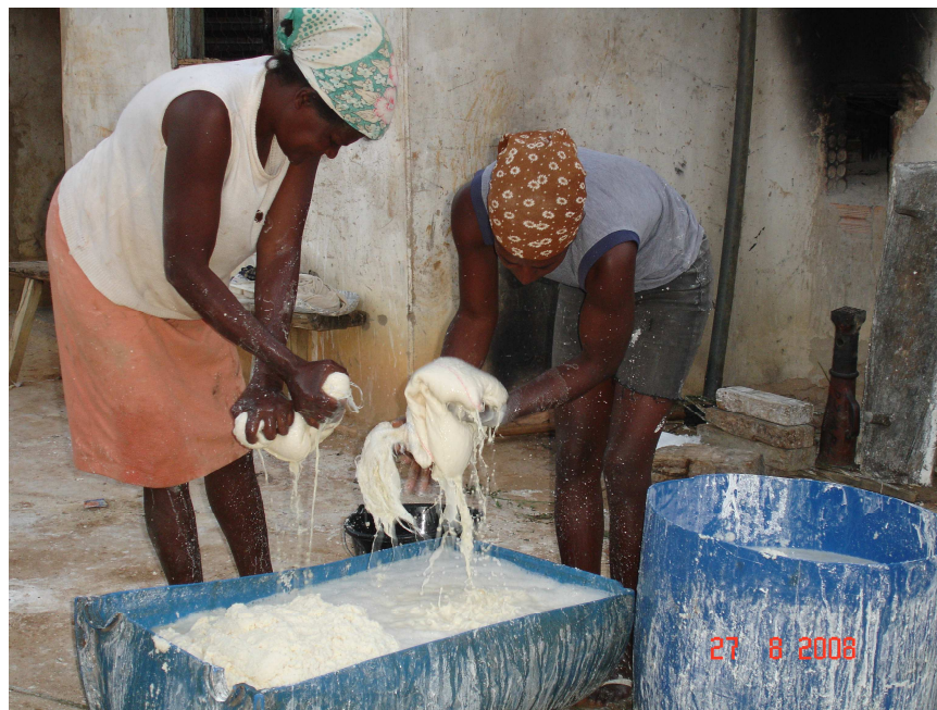
FIGURA 5 – Beneficiamento da mandioca, em mutirão

O ASSENTAMENTO CAITITÉ é a segunda grande conquista dos posseiros. Esse assentamento foi criado em 1983, com a compra da Fazenda Caitité. Possui 33 lotes, com 30 ha cada área. De acordo com o Sr. Jadé, no dia em que o governador Tancredo Neves consumou a reintegração de posse, os posseiros mataram 5 vacas e fizeram uma grande festa.