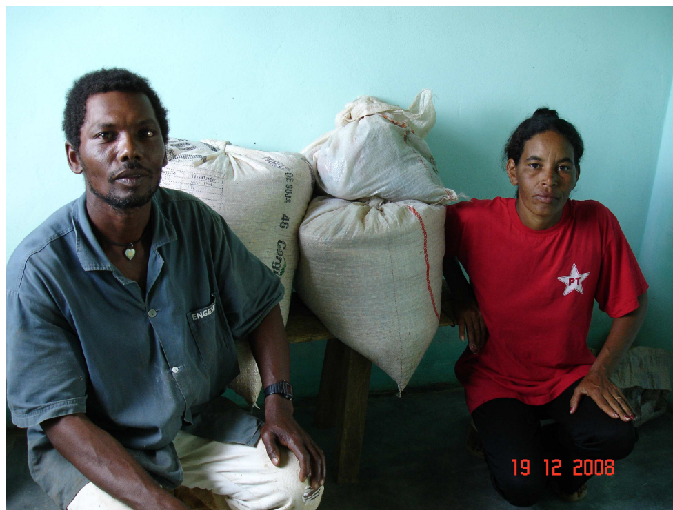
FIGURA 14 - Casa, local de armazenamento de produção

A casa, além disso, é o local onde se armazenam as sementes a serem utilizadas no próximo plantio e a produção excedente a ser vendida ou distribuída (FIG. 14), segundo os padrões de reciprocidade. É nesse espaço que também são produzidos produtos artesanais, como bolos, doces, biscoitos que podem ser comercializados nas feiras do município.