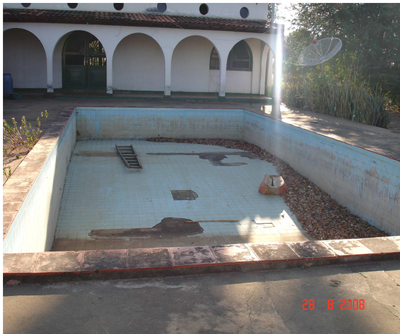
FIGURA 3 – Piscina da sede da Fazenda Caitité

A família que recebeu o lote onde se encontra esse imóvel ocupa somente a parte térrea e externa da casa, sendo que a parte interna e a piscina se encontram totalmente em desuso e danificadas, conforme ilustra a FIG. 3: