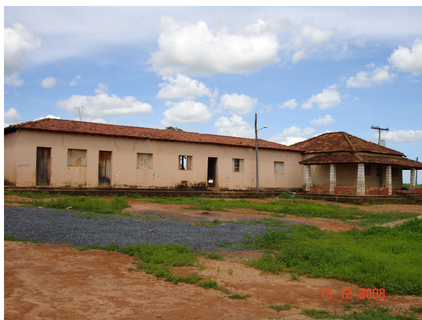
FIGURA 15 – Sede de antiga fazenda, acampamento Verde Água

Alguns dos problemas relativos ao deslocamento dos alunos para escolas de outras comunidades poderiam ser minimizados, a partir da utilização das próprias sedes existentes nos assentamentos como unidade escolar. Em muitos desses assentamentos, as sedes encontram-se deterioradas e totalmente subutilizadas (FIG. 15).