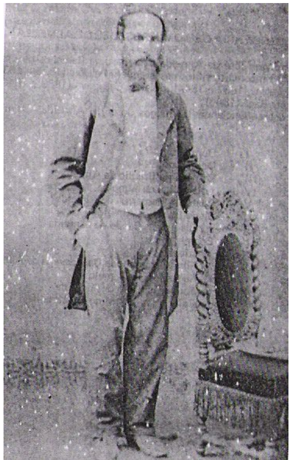
Fig.6.Bernardino de Almeida