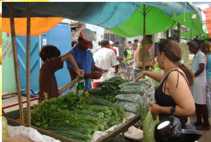
FIGURA 27 – Foto do aspecto das hortaliças.