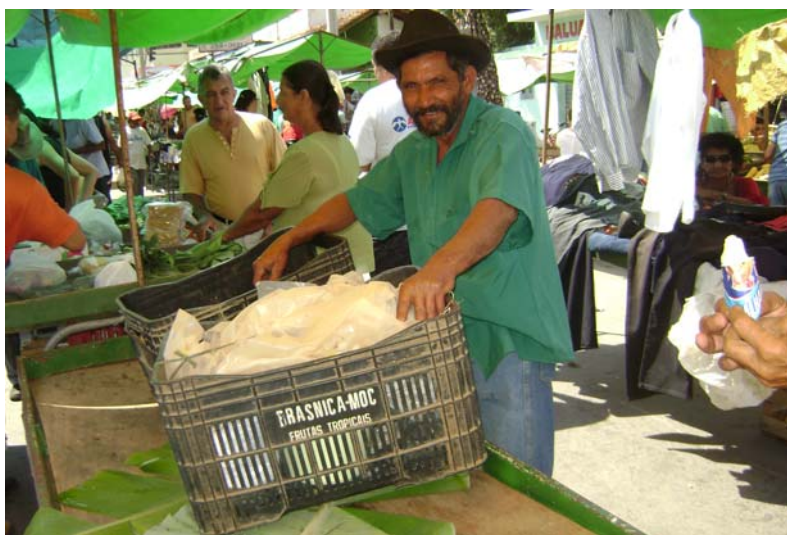
FIGURA 10 – Foto de feirante desmontando sua barraca antes do horário estabelecido.

Foi curioso observarmos que a penúltima recomendação do item Montagem das Barracas, não é totalmente cumprida, pois, quando o produto acaba em alguma barraca, por volta de 11 horas, mesmo antes do término da Feira (por volta do meio-dia até às 13 horas), como vimos em alguns domingos, o feirante “arruma sua tralha” e deixa a barraca totalmente desocupada, limpinha, como se não tivesse havido Feira naquela porção do espaço (Figura 10).