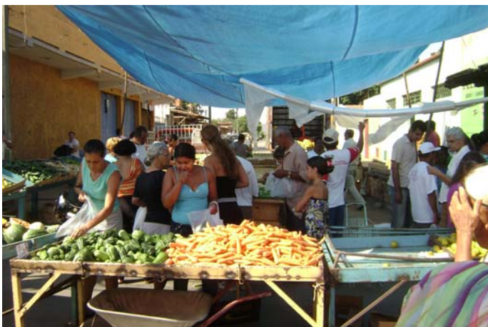
FIGURA 6 – Foto das tendas que abrigam os sacolões.

No item Decoração das Barracas fica claro que as barracas serão montadas obedecendo ao padrão previamente definido pela Associação da Feira Livre do Bairro Major Prates e Região, em conjunto com os expositores e que, qualquer modificação deverá ser aprovada pela Associação, após solicitação prévia. Contudo, observamos um arranjo irregular, bem no final da Feira, onde estão as últimas barracas. Naquele ambiente, observamos tendas – grandes: para os dois sacolões que ocupam o espaço da Feira – e pequenas: dos vendedores de folhas que foram incorporados mais recentemente à Feira, bem como: mesinhas de bar, caixotes, carrinhos de mão e duas lonas estendidas no chão onde são colocadas roupas e vasilhas de alumínio (Figuras 6, 7, 8 e 9).