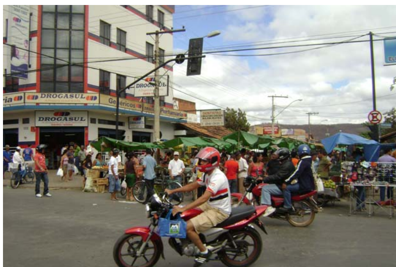
FIGURA 14 – Foto de uma das entradas da Feira (aspecto geral).

o bairro é grande, o mercado municipal é distante, falta condução para quem quer freqüentá-lo no sábado e domingo. Então, a feira é próxima de casa e oferece tudo o que o freguês precisa. Hoje, o pessoal nem lembra do mercado! Se você compra alguma coisa e descobre, em casa, que não está boa, pode trocar, pode falar com o feirante. As pessoas se conhecem, se respeitam. A gente confia uns nos outros e isso é ótimo pra Feira! – conclui Nego ao final da entrevista.