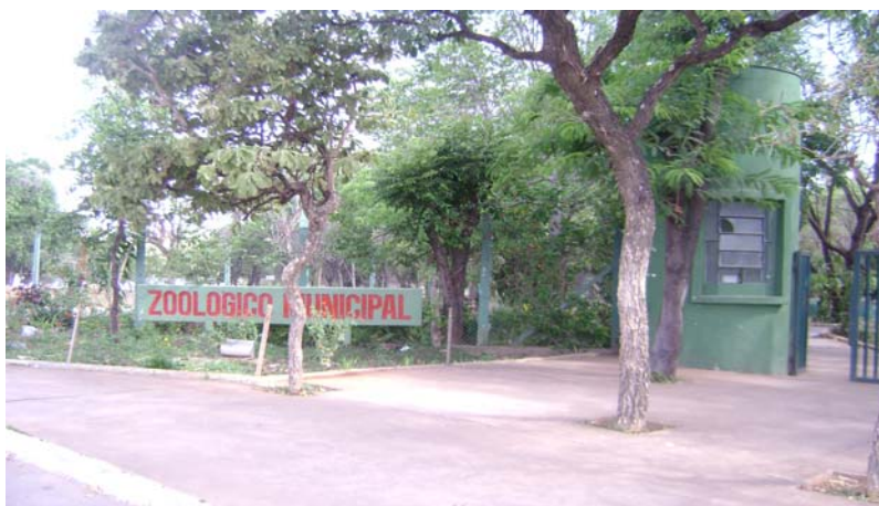
FIGURA 4 – Foto da entrada principal do Zoológico Municipal

Ao lado do Parque, está o Zoológico Municipal (Figura 4), com animais silvestres de espécies variadas.