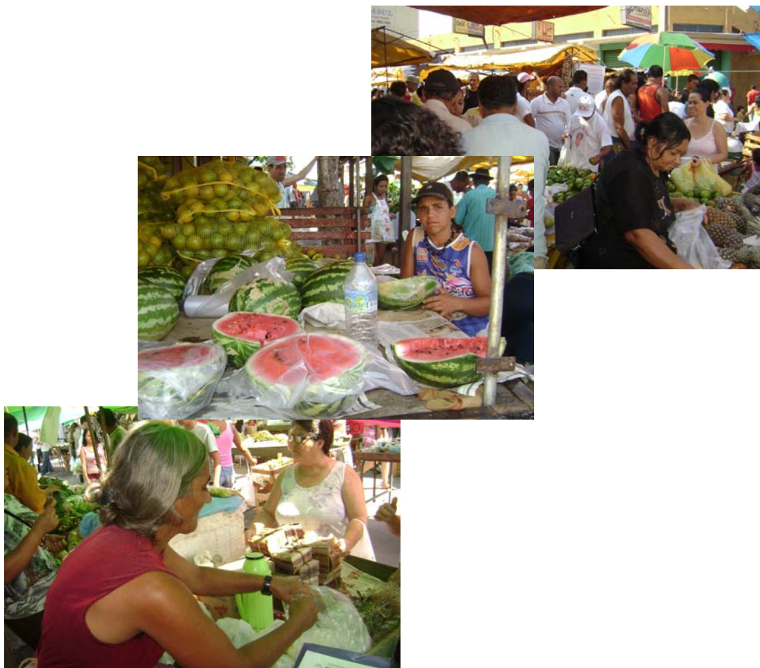
FIGURAS 33, 34 e 35 – Fotos de um dia de feira.

Considerando nossas observações, a Feira apresenta-se como lugar de produção do cotidiano, evidenciando estratégias, táticas e golpes (DE CERTEAU, 1994) de ser feirante e ser freguês, anunciando “o olhar do povo” (BAKHTIN, 1987) sobre sua vida, seu passado e seu futuro, seus gostos e gestos carregados de valores, tradições, saberes e fazeres, construindo suas histórias e a própria vida na história da Feira (Figuras 33, 34 e 35).