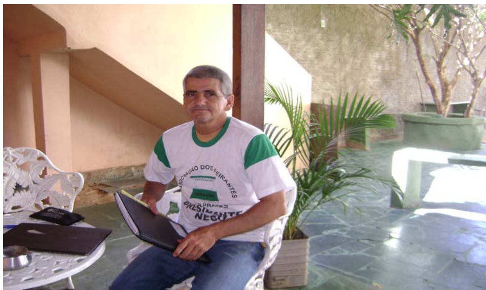
FIGURA 13 – Foto do Presidente da Associação de Feirantes da Feira Livre do Major Prates.

Nossa associação, ainda, não tem sede própria. A sede é, provisoriamente, essa varanda (espaço da casa onde aconteceu a entrevista/ Figura 13). Já tivemos duas reuniões na câmara, duas na Drogasul 15 e duas aqui em casa. As reuniões foram basicamente para discutir o regulamento, para eleger a diretoria e também, para contar as novidades: o ganho das novas barracas e do som (em 2006); e dos dois banheiros químicos (em 2008).