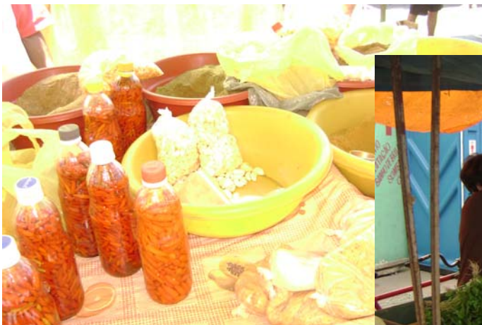
FIGURA 26 – Foto dos produtos vendidos na Feira.

Há bancas que são forradas com encerado 24 . Nas bancas de hortaliças vimos recipientes plásticos contendo água para regá-las, vez por outra, uma estratégia comum, utilizada por quem comercializa folhas, a fim de mantê-las frescas e com viço até o fim da feira.