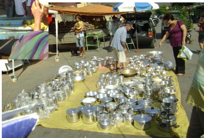
FIGURA 7 – Foto das lonas estendidas no chão para comercialização dos produtos.