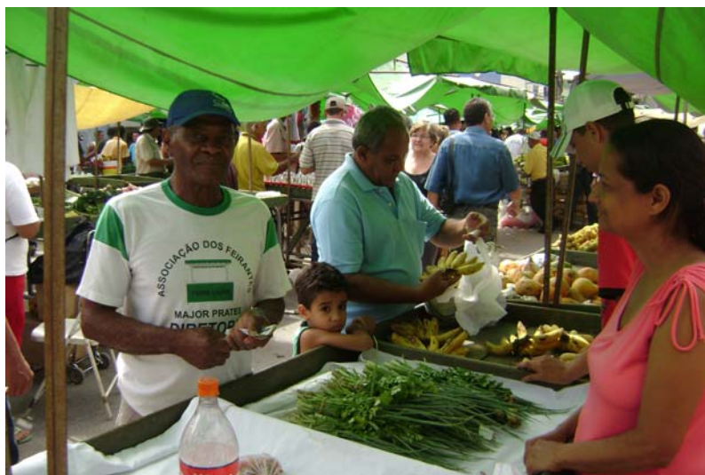
FIGURA 12 – Foto do recolhimento da contribuição para montagem das barracas.

Nós, da diretoria, passamos em cada uma das barracas a partir das 10h, para recolher os dois reais. Só pode receber a contribuição quem está devidamente uniformizado. Isso identifica quem é da diretoria. O feirante não corre o risco de ser passado para trás (Explica Nego na entrevista).