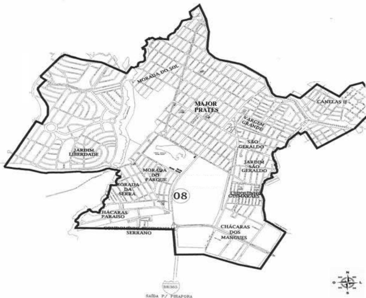
FIGURA 1 – Mapa do Pólo Major Prates

Esclarecemos que, em 2005, o território da cidade de Montes Claros foi dividido em doze pólos regionais, dentre os quais o “Pólo do Grande Major Prates”, que contempla a região circunvizinha e também, o bairro Major Prates, configurando-se como um dos maiores e mais importantes desses pólos. As informações e dados que apresentaremos a seguir foram fornecidos pela Secretaria Municipal de Planejamento e Coordenação Estratégica (MONTES CLAROS, 2004).