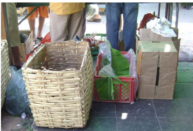
FIGURA 11 – Foto de arrumação das barracas (aspecto limpeza).

Observamos no aspecto Limpeza das Barracas, que as regras são cumpridas conforme estão registradas. Há na Feira um cuidado, por parte dos Feirantes, com a ambiência do espaço: as barracas estão sempre sendo arrumadas, os produtos estragados são recolhidos a todo o momento e o que não será vendido acondicionado em sacos plásticos, cestos e caixas (Figura 11) como previsto no parágrafo anterior.