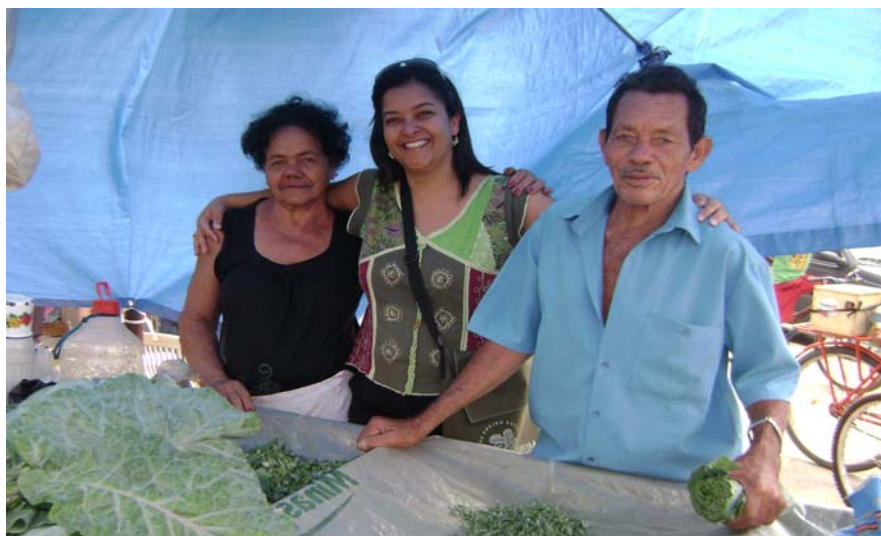
FIGURA 5 – Foto de feirantes – fundadores da feira – e da pesquisadora (ao centro).

Em nosso percurso, nos acompanharam uma máquina fotográfica e alguns formulários – Plano de Observação, Roteiros de Entrevistas – que em certos momentos foram deixados de lado para que pudéssemos apreender daquela Feira suas vivências, suas conversas, seus improvisos e fatos inusitados. Em nossa ação de fotografar a Feira, fomos envolvidos em suas jocosidades, o que nos oportunizou envolvimento e familiarização com aqueles que “fazem a feira”. Assim, entre uma foto e outra, ouvíamos os feirantes brincarem “a foto vai ficar muito boa! O cara aqui é artista! Bate a foto e leva a bandeja de uva prá ajudar! É quatro, mas eu faço três reais pra você!” (Carlos – feirante que comercializa uvas). “Você tem um arrozal? Vai levar as ‘caretas’ pra expulsar os passarinhos?” (Dona Secunda – uma das fundadoras da feira/ Figura 5).