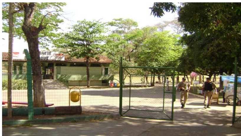
FIGURA 3 – Foto do Parque Municipal Milton Prates

É muito importante destacar que o Parque Municipal da cidade está localizado neste bairro, à Avenida Major Prates, s/nº e fica aberto diariamente. Possui uma extensa área verde – ideal para piqueniques – lagoa com pedalinhos, restaurante, playground, quadras de esportes com chuveiro frio, campo de futebol, pista de bicicross e patins (Figura 3).