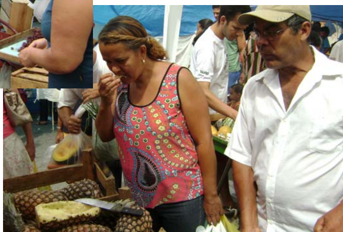
FIGURA 22 – Foto de fregueses experimentando os produtos.