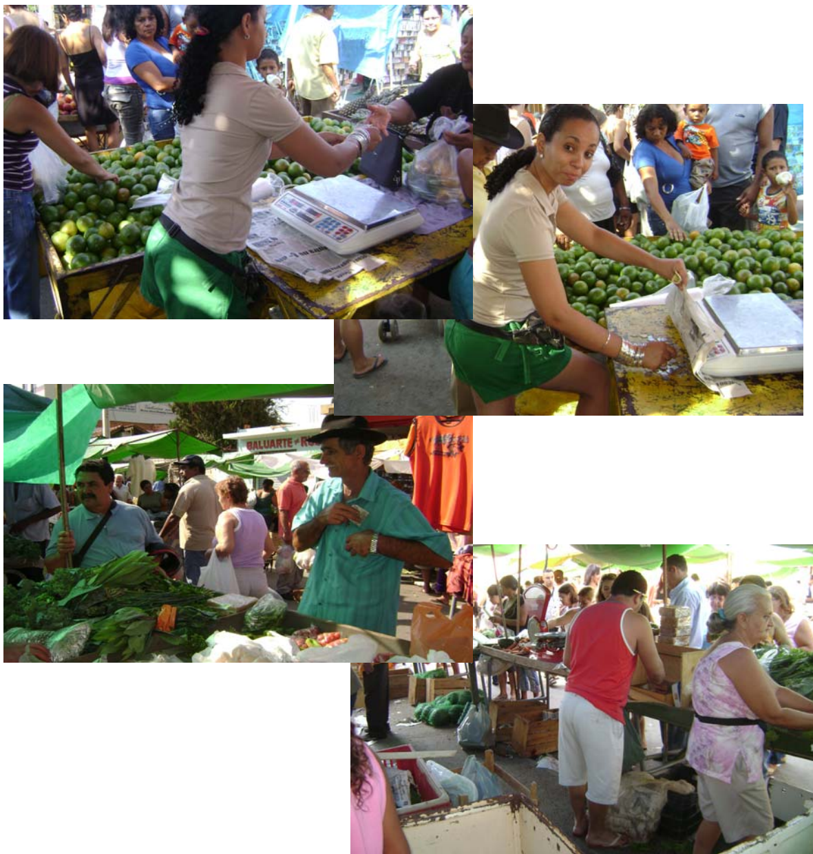
FIGURAS 28, 29, 30 e 31 – Fotos dos locais/ estratégias de acondicionamento de cédulas e moedas para trocos.

Verificamos que não há uma distinção entre os atos de manipulação do alimento e do dinheiro. Ambos são feitos simultaneamente. Embaixo das balanças ou do papelão/jornal colocado sobre as bancas, ou ainda, nos bolsos dos feirantes ou em pequenas caixas de madeira para esse fim, ficam as cédulas e moedas recebidas dos fregueses e devolvidas por ocasião dos trocos (Figuras 28, 29, 30 e 31).