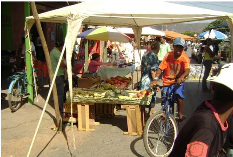
FIGURA 8 – Foto de arranjos improvisados para organização dos produtos.