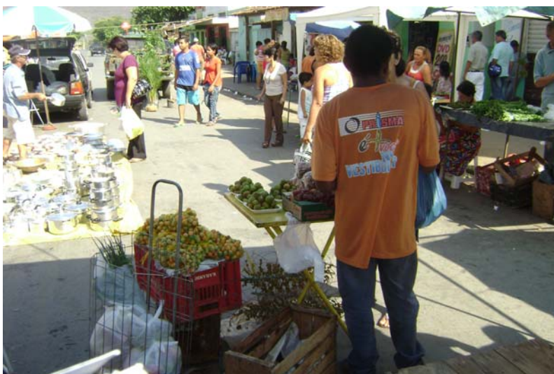
FIGURA 9 – Foto de arranjos improvisados para organização dos produtos.

Quanto à Montagem das Barracas, conforme o regulamento, o Expositor é responsável pela observância de cuidados específicos em relação à utilização da área de exposição, devendo atentar para as seguintes normas: não apoiar, amarrar ou dependurar quaisquer objetos ou produtos expostos, na estrutura, cobertura ou paredes das casas vizinhas às barracas; não utilizar aparelhos de som com volume alto que incomode aos