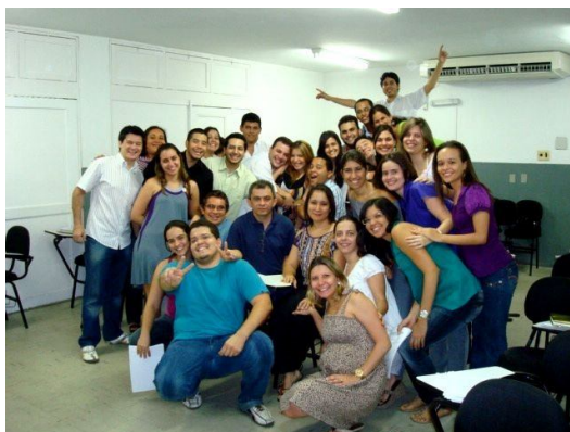
FIGURA 3: Turma que de fui paraninfa em fevereiro de 2009.

fundamentados em saberes e conhecimentos próprios à formação de professores , ou melhor dizendo, os próprios saberes docentes (FURLANETTO, 2003).