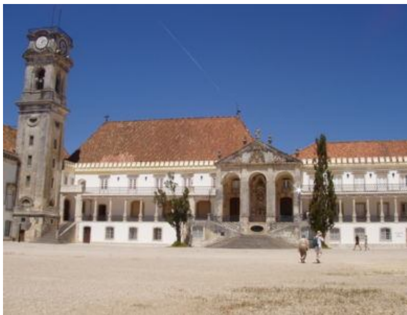
FIGURA 6: Universidade de Coimbra.

A formação da elite brasileira era uma preocupação constante da coroa portuguesa, que tinha como objetivo manter o Brasil como colônia, e assim, não havia interesse em formar uma elite intelectual e política autônoma em solo brasileiro, o que poderia gerar pensamentos separatistas. Mesmo assim, algumas ideias eram desenvolvidas neste sentido, pelos filhos nascidos na colônia e que pouco se identificavam com Portugal, pois se consideravam filhos do Brasil e desejavam a sua independência.