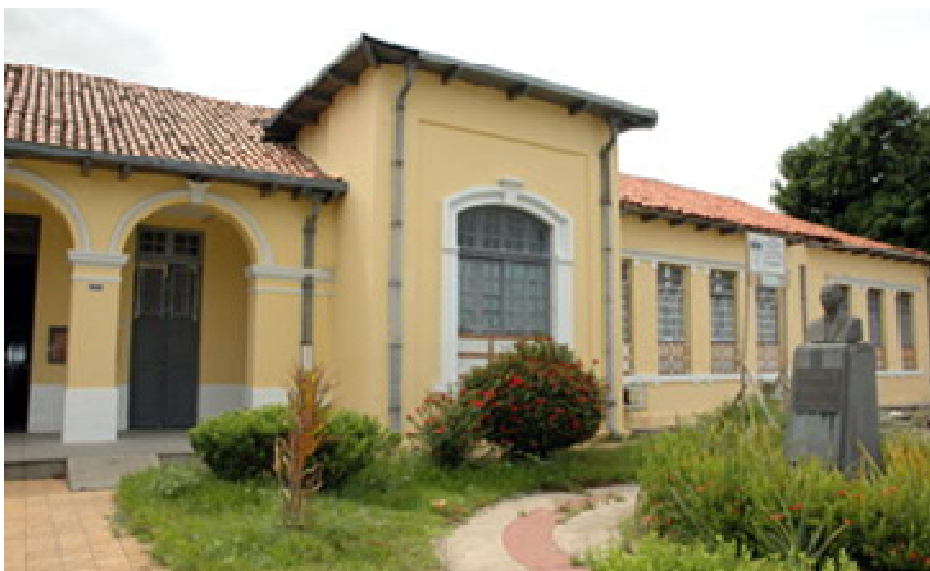
FIGURA 8: Prédio da Antiga Faculdade de Direito do Piauí.

Inicialmente, a faculdade funcionou, provisoriamente, nas instalações da antiga Assembléia Legislativa do Estado, demarcando desse modo, a necessidade de uma sede própria. Na sua origem, portanto, a faculdade de Direito do Piauí nasceu na condição de uma instituição particular, ocorre que, em decorrência de dificuldades dos mantenedores, suas despesas foram estadualizadas, regulamentada pelo decreto n. 1471, de 16 de agosto de 1932. E neste mesmo ano a faculdade ganhou nova sede, passando a funcionar na Rua Coelho Rodrigues, no prédio que hoje abriga a Biblioteca Pública Estadual Desembargador Cromwell de Carvalho.