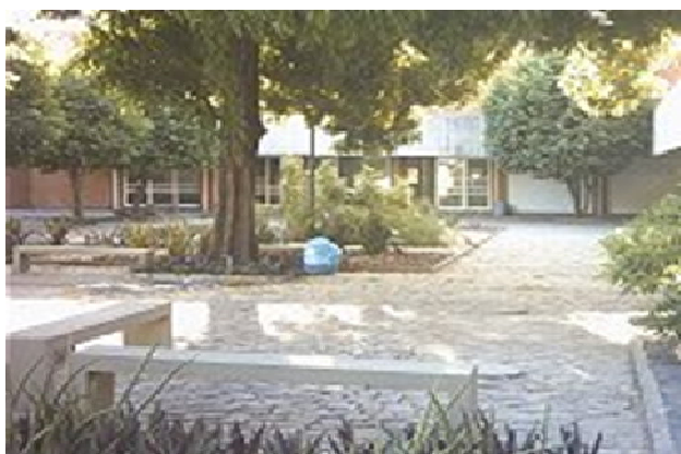
FIGURA 10: Prédio onde funciona o Curso de Direito, pátio interno.