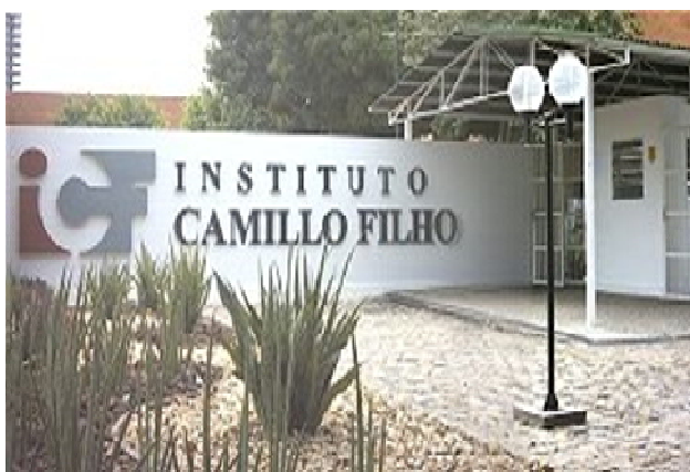
FIGURA 9: Prédio onde funciona: Secretaria Acadêmica, Biblioteca, Coordenadoria do curso de Artes Visuais, Coordenadoria do curso de Direito, localizado na Rua Manoel Nogueira Lima, 1175 - Jóquei Clube em Teresina-PI. Disponível em www.icf.edu.br

Sua inauguração ocorreu em 5 de junho de 2000 e as atividades iniciaram em agosto do mesmo ano. O Instituto Camillo Filho, embora conte apenas com nove anos de existência, tem, em seu quadro de pessoal, professores advindos de diversas Instituições de Ensino Superior, como a Universidade Federal do Piauí e a Universidade Estadual do Piauí, a maioria contando com tempo significativo de experiência em atividades docentes, sendo esta uma das motivações que levaram à escolha desse espaço para a realização da pesquisa.