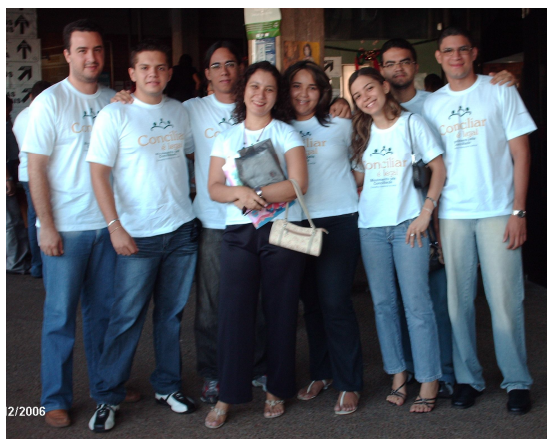
FIGURA 4: Com os alunos realizando atividades de extensão.