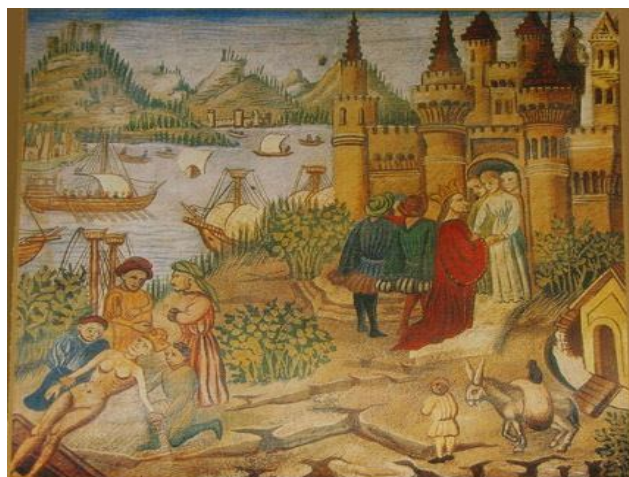
Escola de Salerno (miniatura no Canon de Avicenna)

Neste sentido, a autora informa que os primeiros traços de uma universidade foram estabelecidos na Escola de Medicina de Salerno (Figura 5), na Itália, no século X, mas “[...] a primeira universidade propriamente dita foi a de Bolonha, na Itália, fundada em 1088, inicialmente como uma escola leiga, não clerical, especializada na área de Direito.” (CASTANHO, 2000, p. 17). Ressalta, a propósito, a Universidade de Paris, que foi a mais famosa da idade média, e que ambas, a Universidade de Salerno e a de Paris, foram consideradas modelos para as universidades que a partir de então começaram a surgir. Na verdade, reforça esse autor, as universidades nasceram da necessidade de resguardar os mestres e alunos nesse período, historicamente conhecido como período das trevas, em que a produção de conhecimento era especialmente perigosa, e o receio de punição obrigou a um enclausuramento protetor dos professores e discentes, surgindo assim universidades para proteção dos docentes, outras para a proteção dos discentes, outras ainda para proteger a ambos.