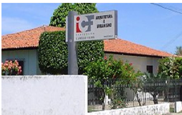
FIGURA 12: Prédio onde funciona: Coordenadoria do curso de Arquitetura e Urbanismo, Laboratórios de Arquitetura, localizado na Rua Napoleão Lima, 1280 - Jôquei Clube em Teresina-PI. Disponível em www.icf.edu.br