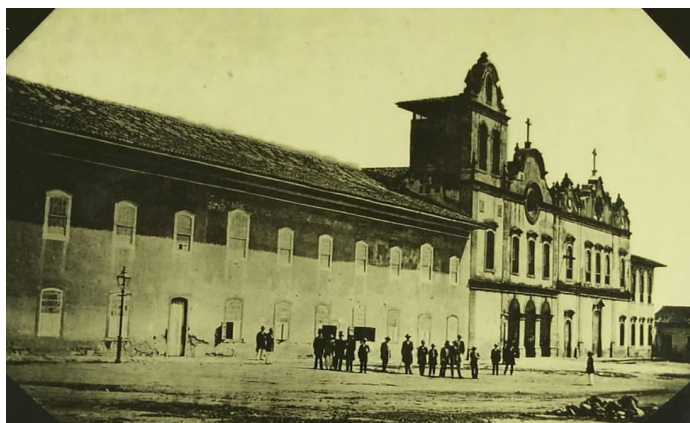
FIGURA 7: Faculdade de Direito do Largo de São Francisco São Paulo em 1862.

Foi apenas na década de 1930 que, de fato, surgiram no Brasil, de forma bastante atrasada, as universidades de vida mais duradoura, através da reforma de Francisco Campos, que trouxe a regulamentação para tanto, definindo os critérios necessários. A este respeito Leonardo Ferro (2004) dá conta que: