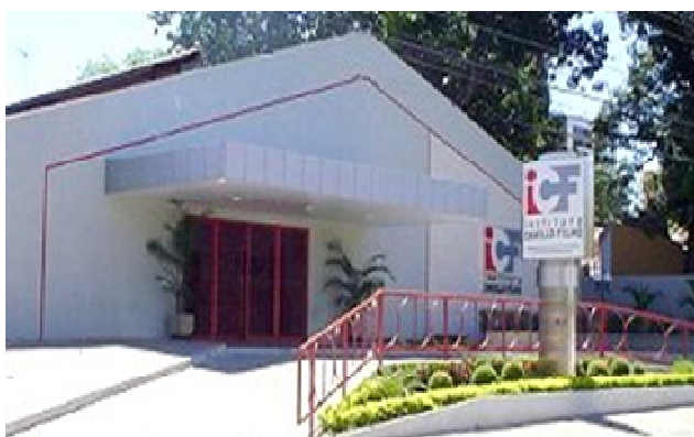
FIGURA 13: Prédio onde funciona: Coordenadoria do curso de Administração. Geral, Coordenadoria do curso de Serviço Social, Laboratórios de Informática e Auditórios, localizado na Av. Jockey Clube, 1323 - Jôquei Clube em Teresina-PI. Disponível em www.icf.edu.br .

Outro motivo para a escolha do Instituto Camillo Filho para a realização da pesquisa é o fato de ali exercermos nossa atividade docente há seis anos, trabalhando com as disciplinas de Direito Penal, tanto a parte geral quanto a parte especial, além de termos passado cinco anos à frente do Núcleo de Prática Jurídica Nicanor Barreto e no último ano estarmos à frente da coordenação de monografia dessa instituição. Função que permite uma proximidade maior com os professores e com os alunos, imprimindo maior intimidade na relação orientando-orientador, durante a realização das monografias de final de curso. Por último, outro fator que levou a pesquisa a ser realizada nessa instituição de ensino superior, foi o fato de hoje a maior parte dos cursos jurídicos se realizarem em instituições particulares.