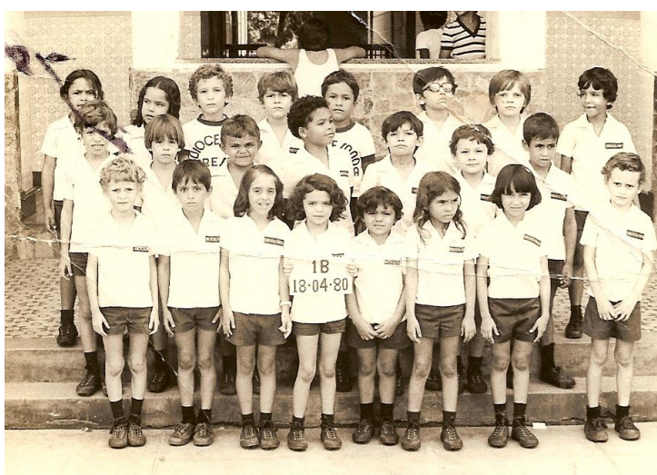
FIGURA 1: Minha primeira turma do Diocesano, sou a penúltima da primeira fila.