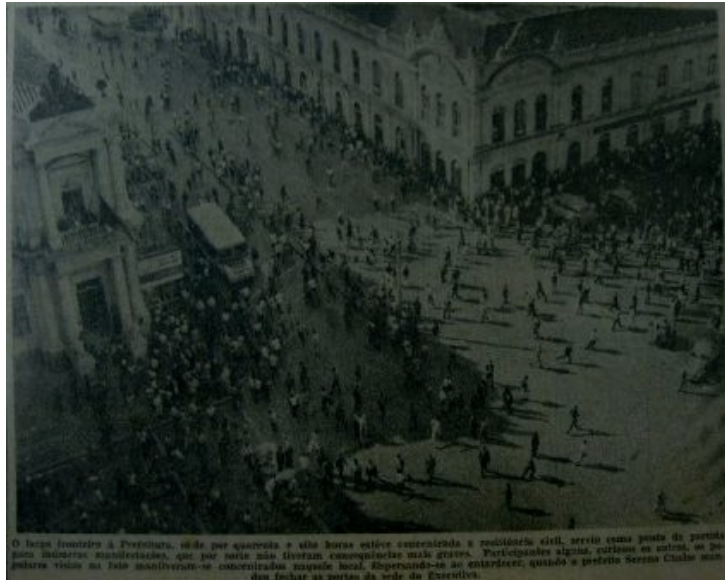
Figura 3: Manifestação no largo da Prefeitura

De acordo com as ordens do presidente Rainieri Mazzilli, o comandante da 3ª DI de Santa Maria, o general Mario Poppe Figueiredo, assumiu o comando do III Exército. O general Ladário Telles ficou detido no QG até o dia seguinte, quando iria para o Rio de Janeiro cumprir a sua prisão.