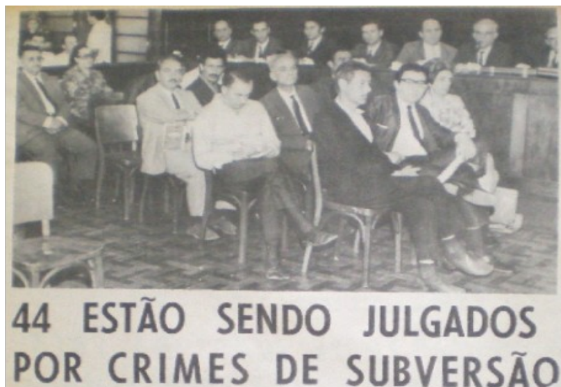
Figura 1: Parte dos réus e advogados de defesa