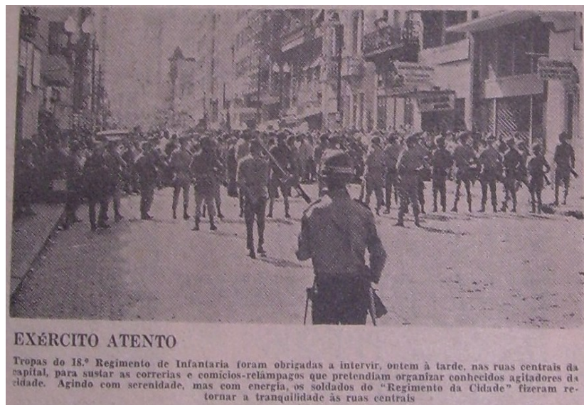
Figura 4: Exército reprimindo a manifestação