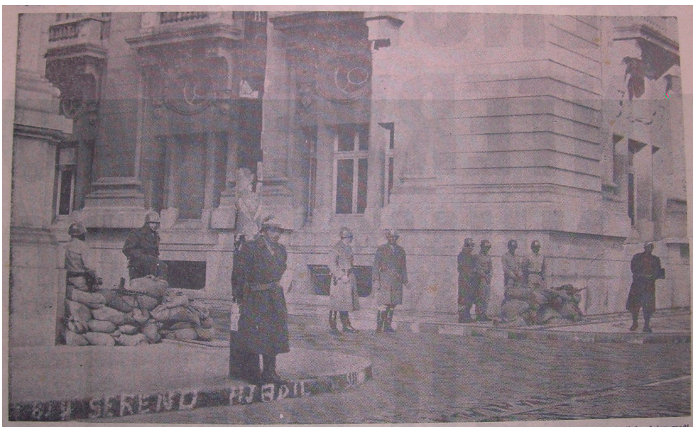
Figura 2: Barricada montada em frente ao Palácio Piratini

O Palácio Piratini teve seus portões fechados, e o governador Ildo Meneghetti requisitou as viaturas do Departamento Autônomo de Estradas e Rodagens (DAER) e a Polícia Rodoviária. Ordenou a prontidão da Brigada Militar e o recolhimento dos destacamentos às suas bases. O Palácio foi cercado pelo Regimento Bento Gonçalves, atingindo toda a Praça da Matriz. Além de barricadas, foram “estendidos defronte o Piratini sacos de areia com soldados da Brigada Militar no manejo de metralhadoras” 283 . O governador convocou o seu secretariado, dirigentes de partido e deputados ligados à União Democrática Nacional (UDN), além de entrar em contato com os governadores do Paraná e São Paulo para se inteirar da situação nesses estados 284 .