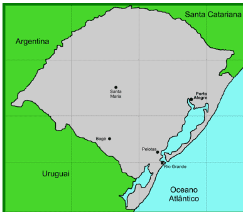
Figura 3 – Localização, no mapa do RS, dos municípios onde se situam as universidades públicas em estudo