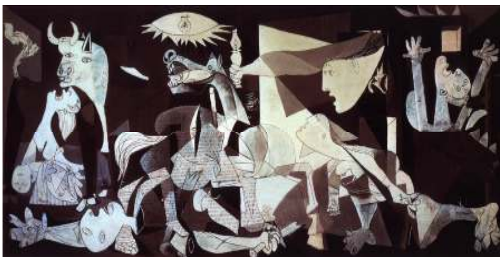
Figura 1: Picasso: Guernica , 1937

Guernica , célebre pintura cubista de Picasso, evidencia essa faculdade da imagem de falar ao homem de forma intensa: