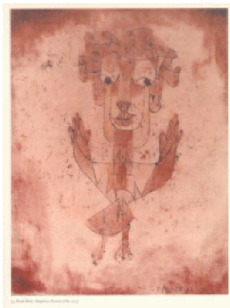
Figura 3: Paul Klee: Angelus Novus, 1920