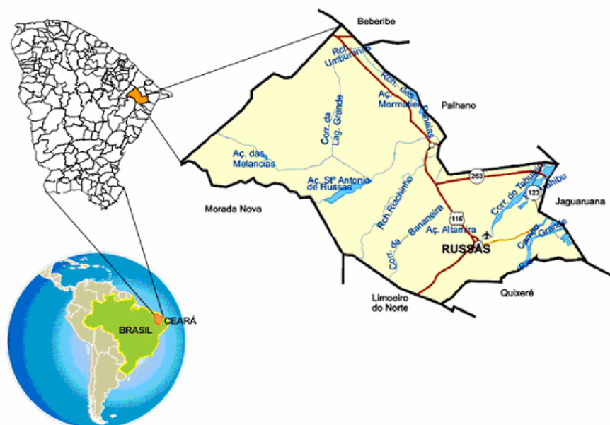
FIGURA 1. Localização do município de Russas (CE)

Nesta perspectiva, optou-se pelo estudo de caso para realização deste trabalho, tendo como objetivo caracterizar o uso de agrotóxicos e a qualidade dos recursos hídricos em dois Assentamentos de Reforma Agrária, entre os existentes em Russas.