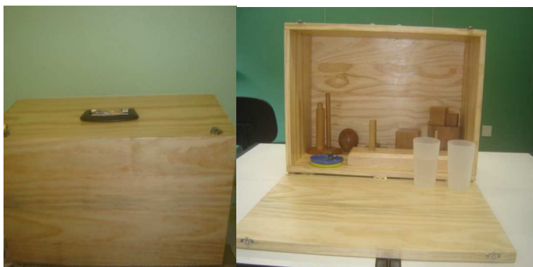
Figura 1 Caixa utilizada na aplicação do Action Research Arm Test (ARAT).

com 10cm 3 , bloco de madeira em formato de cubo com 2,5cm 3 , bloco de madeira em formato de cubo com 5cm 3 , bloco de madeira em formato de cubo com 7,5cm 3 , bola de madeira com 7,1cm, pedra de afiar faca com 10 x 2,5 x 1 cm, tubo em formato cilíndrico de alumínio com 2,25cm, tubo em formato cilíndrico de alumínio com 1cm, argola de madeira com 3,5cm de diâmetro externo e 1,5 de diâmetro interno, pino para encaixe de madeira com 2cm de diâmetro e 13,5cm de altura, pino para encaixe de madeira com 0,8cm de diâmetro e 6cm de altura, pino para encaixe de madeira com 2cm de diâmetro e 8cm de altura, dois copos plásticos de 12 a 15cm de altura e 7 a 8cm de diâmetros na parte superior e 6 a 7cm na parte inferior, bola de metal com 6mm, bola de gude (vidro), base de madeira de 1,5 x 8,5 x 8,5cm, base de madeira de 3,5 x 8,5 x 34cm) conforme especificações descritas por Yozbatiran. 51 A Figura 1 mostra imagens referentes ao ARAT.