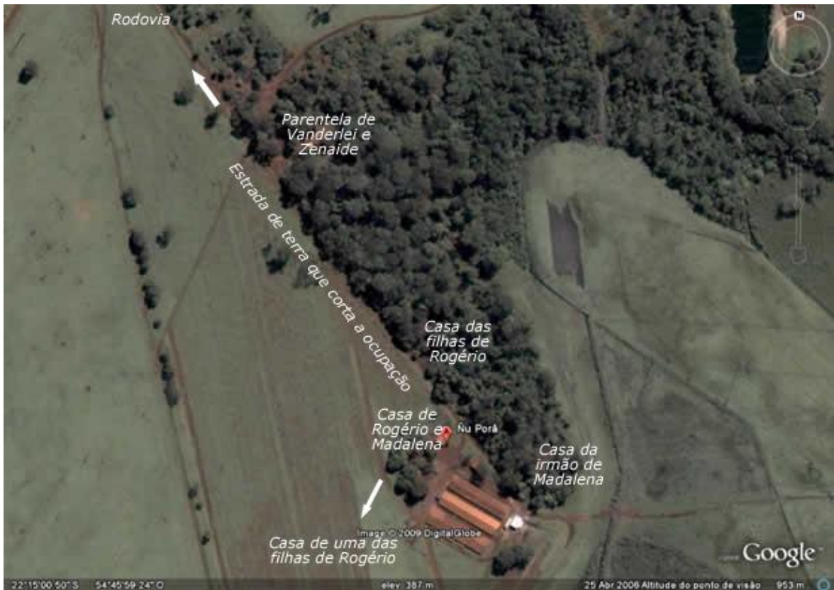
Foto 17 – Aproximando mais a imagem anterior, e focando no acampamento, podemos visualizar melhor a presença deles no local. Também podemos ver a clareira aberta na mata, as casas da Família de Seu Vanderlei Barbosa (tio de Rogério Cáceres) e Dona Zenaide. Nos três galpões abaixo funcionava uma olaria. Na imagem abaixo procurei representar cada uma das casas e os caminhos que ligam uma casa à outra, possibilitando o fortalecimento das relações comunitárias.