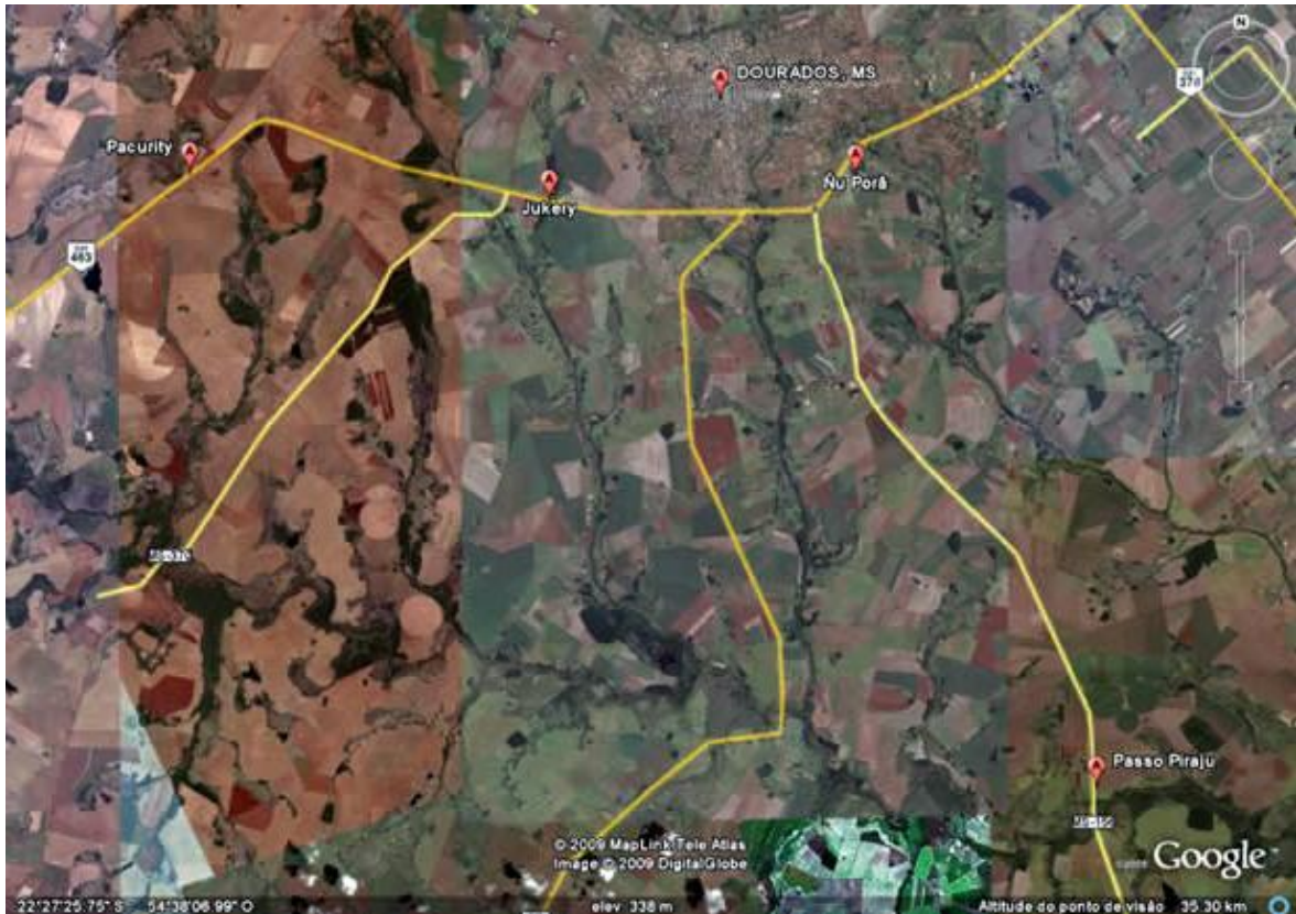
Foto 01 - Imagem de satélite coletada no Google Earth em janeiro de 2009. Na foto a rodovia 463, que liga Dourados a Ponta Porã, corta horizontalmente a imagem no lado esquerdo. Nesta rodovia se encontram três, dos quatro casos analisados durante a pesquisa. De cima para baixo, são eles, a ocupação de Ñu Porã e os acampamentos Jukery e Pacurity. Já a ocupação de Passo Pirajú localizada no distrito de Dourados Porto Cambira, a 25 quilômetros deste município.

O objetivo de pesquisar nos acampamentos e ocupações indígenas, foi o demonstrar, a partir das situações etnográficas aqui descritas, em quais condições estes grupos tem vivido, como vêm se organizando, e como eles narram o processo histórico de conflito que estão vivendo. A história dos grupos analisadas foi considerada a partir da perspectiva histórica deles sobre este processo. Esta possibilidade de elaboração da história se tornou metodologicamente explicável através das contribuições teóricas constantes no artigo Sobre os conceitos e as relações entre história indígena e etnohistória , escrito por Jorge Eremites de Oliveira, fundamental para o desenvolvimento desta perspectiva: