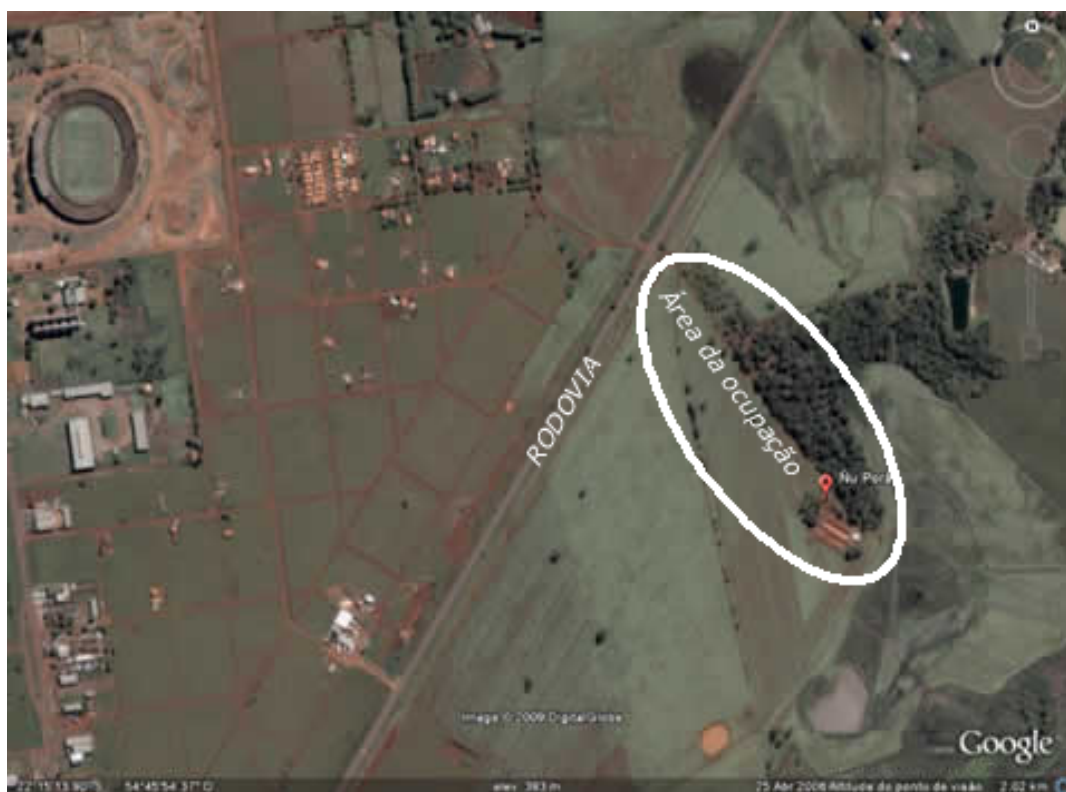
Foto 16 - Imagem de satélite feita em abril de 2004. Na ocasião em que ela foi feita já havia a ocupação no local. Esta imagem mais alta é interessante para notarmos algumas características do acampamento. Além de estar situado a poucos metros da BR 163, que corta a foto verticalmente, o acampamento está a cerca de dois quilômetros do perímetro urbano do Município de Dourados. No alto, à esquerda, está o Estádio Dourados, que tem alguns bairros em seu redor.

Fixados e organizados no local, eles esperam a continuidade do processo de identificação e demarcação da área para regularizarem o tekoha onde estão vivendo. Ali, estão se organizando no território procurando se aproximarem da modalidade tradicional de ocupação do espaço.