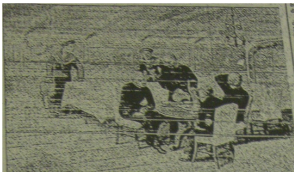
Figura que ilustra o artigo. (Retirado de DEZEM, 2003: 198)