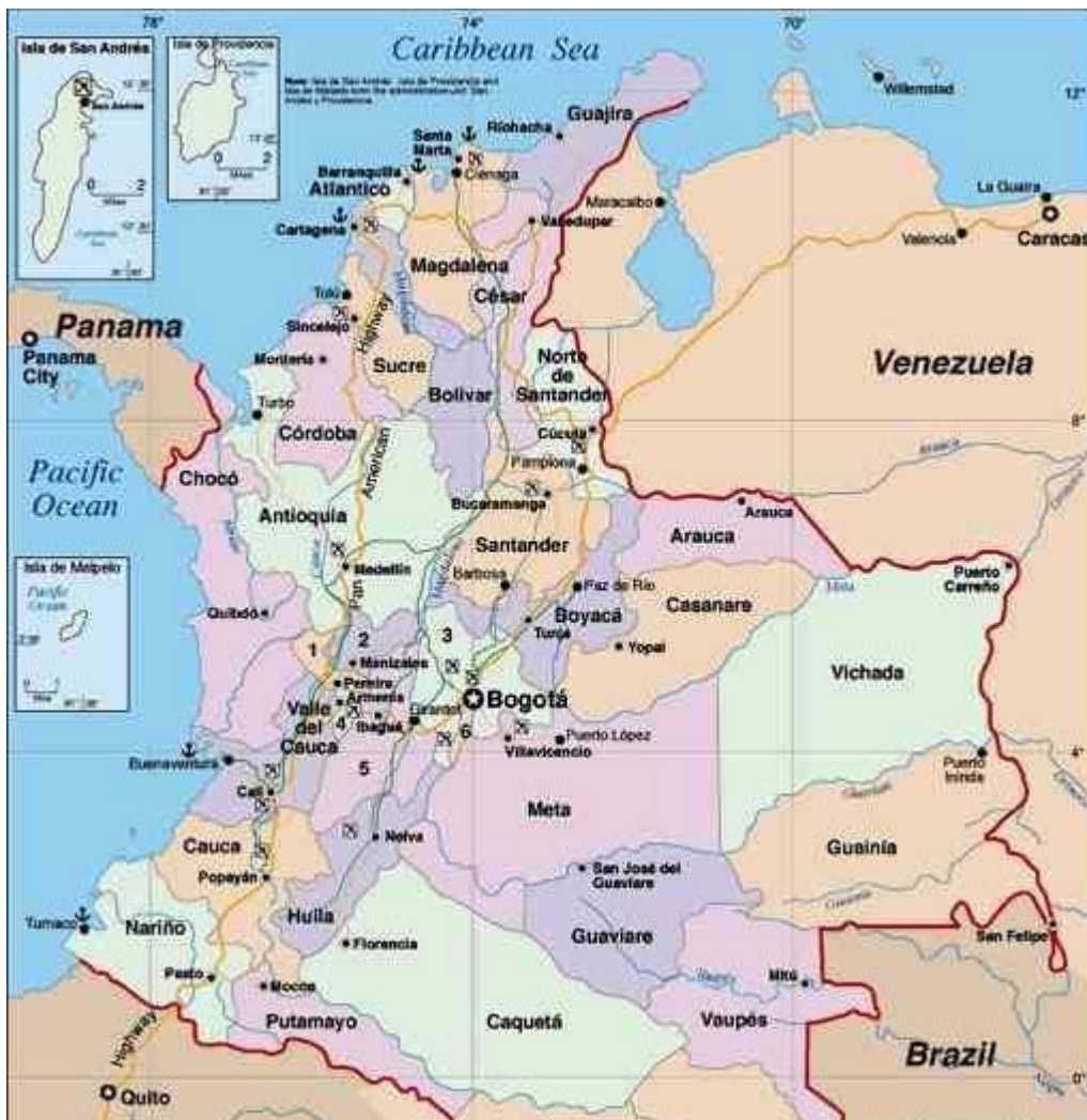
Mapa 02: Mapa da Colômbia: Político

Mapa que mostra San Andrés, Santa Catalina e Providência num quadro acima à esquerda.