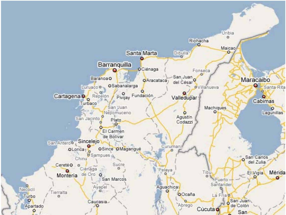
Mapa 03: “La Costa” ou o Caribe Colombiano.

A península acima, à direita, é “La Guajira”.