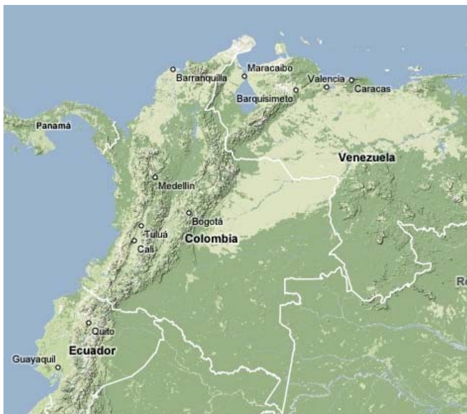
Mapa 01: Mapa da Colômbia: Terreno.

Neste mapa é possível ver claramente a geografia do país dividada pelas cordilheiras andinas