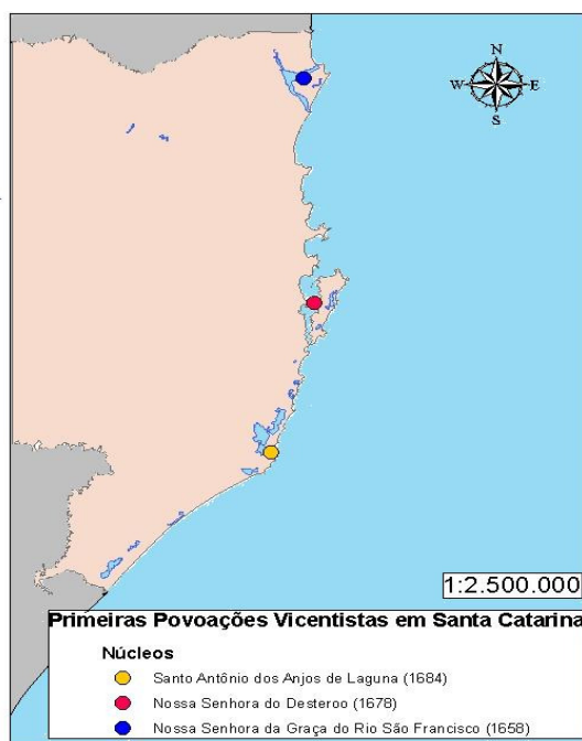
Figura II: Primeiras povoações vicentistas no território do atual Estado de Santa Catarina.