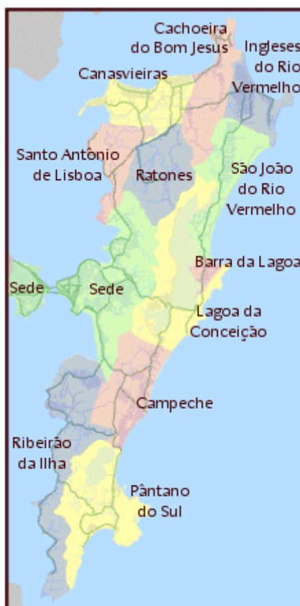
Figura IV: Distritos de Florianópolis 171 .