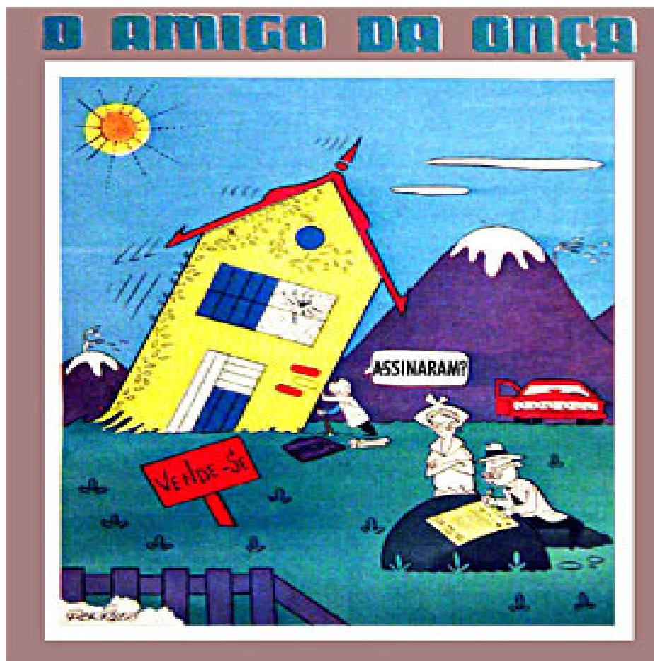
Figura IV: Ilustração do Amigo da Onça.