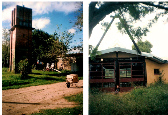
Figura 1: Comunidad del Sur: ferramentaria e local de reuniões.