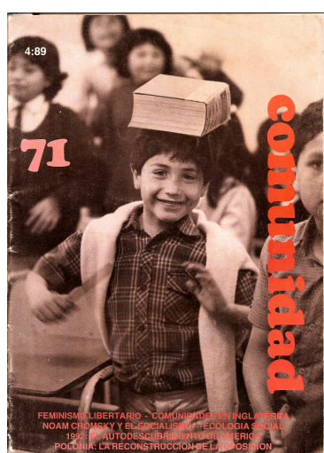
Figura 11: Capa da revista Comunidad: temas educacionais (1989).