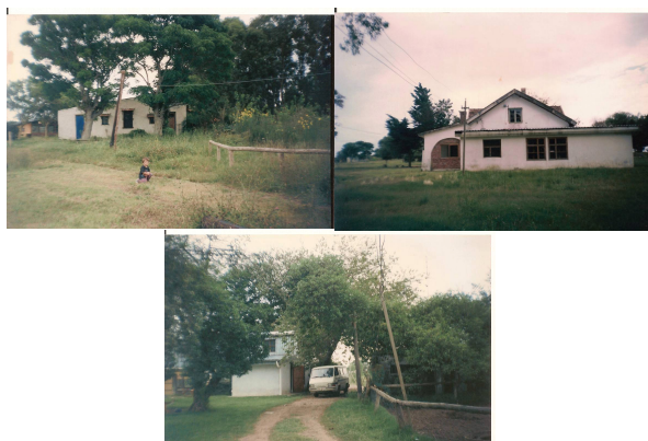
Figura 2: Comunidad del Sur: aspectos externos.