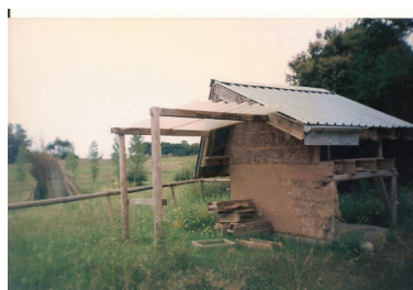
Figura 3: Comunidad del Sur: demonstração do processo de construção das vivendas ecológicas.