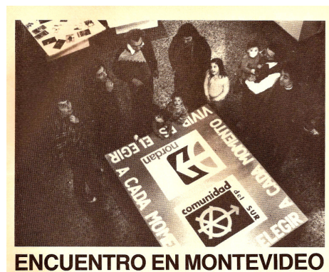
Figura 9: Revista Comunidad: retorno ao Uruguai (1985).