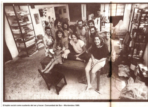
El tejido social como sustento del ser y hacer. Comunidad del Sur - Montevideo 1989.