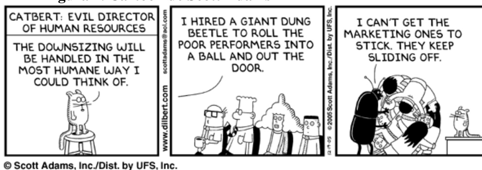
Figura 1. Cartoon de Scott Adams

Quanto à primeira vertente da questão que nos propusemos a discutir (a questão dos RH na macro-regulação) cabe antes de mais nada, fazer alguns reparos à utilização do termo “burocracia”, que em muitos pontos desse texto utilizamos sem mais rigor, e quase sempre, com um significado semelhante ao veiculado por vocalizadores de um discurso que em geral o tomam num sentido depreciativo, como um mal a ser expurgado, típico dos serviços públicos. Portanto, vale a pena resgatar nesse momento, a análise clássica de Weber sobre as burocracias nas sociedades modernas.