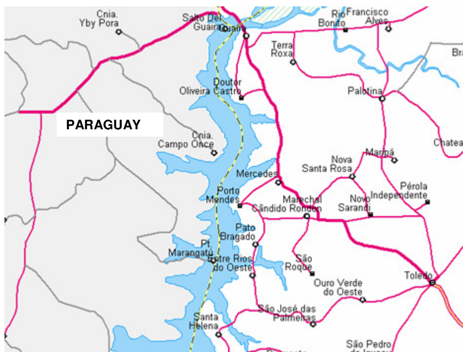
FIGURA 02 – Mapa da Faixa de Fronteira do Brasil com o Paraguai.