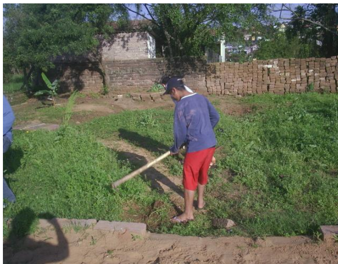
Figura 11 – Laborterapia – trabalho no pátio

contraposição, estaria sua opção em continuar nas ruas, em contato com as drogas e com a criminalidade.