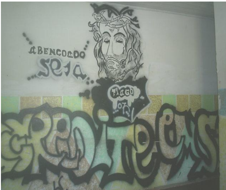
Figura 09 - "Abençoado seja" - parede grafitada

Os profissionais que trabalham na instituição apostam na mudança de conduta dos jovens, usando um discurso investido de um saber que consta na Bíblia. Nos momentos de espiritualidade, trechos bíblicos são escolhidos, a partir dos quais histórias de vida são contadas pelo monitor que coordena esse momento. Há um investimento na seleção do texto bíblico e na materialidade do fato relacionado ao mesmo.