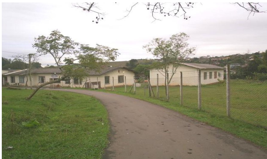
Figura 02 - Outro cenário - A Casa Abrigo - Associação do Adolescente Nova Vida

2006 - Afasto-me da escola para assumir o cargo de Sub-Secretária de Educação da SMECDT de Picada Café e, em 2007, retorno à escola - como professora de Língua Portuguesa e Coordenadora Pedagógica da EJA (situação atual/2008).