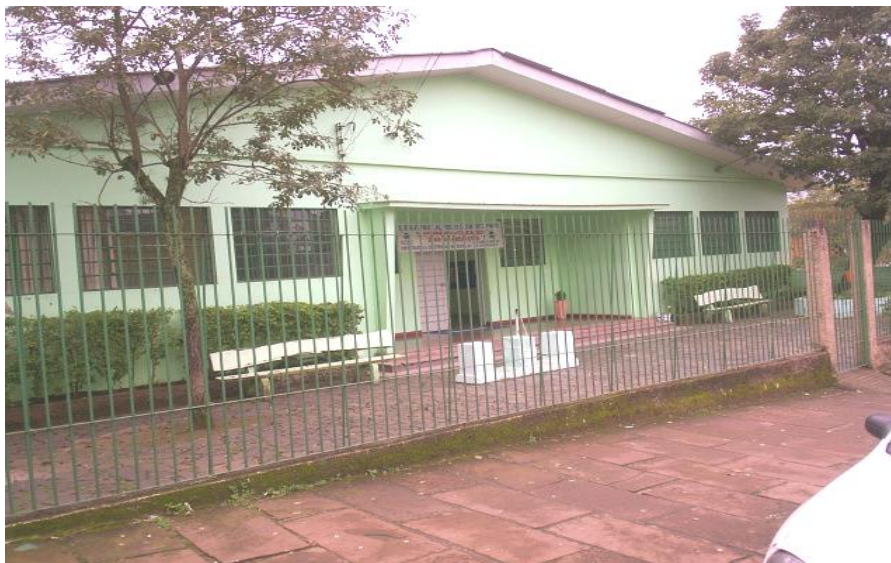
Figura 01 – Cenário da pesquisa - Escola Estadual de Ensino Fundamental Professor Alfredo Clemente Pinto

Março /2005. Escola Estadual de Ensino Fundamental Professor Alfredo Clemente Pinto - bairro Primavera - Novo Hamburgo/RS. Ensino Fundamental, na modalidade EJA 7 , organizado por Totalidades (1, 2, 3, 4, 5 e 6) 8 , no período da noite. Neste cenário, passo a ocupar a função de coordenadora pedagógica. Em média, vinte alunos compõem cada turma. São nove os professores que circulam por este espaço, atendendo as turmas. Durante um dia por semana, a aula ocorre à distância 9 , cedendo lugar para a reunião pedagógica entre os docentes.