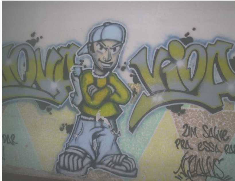
Figura 08 - “Adolescente Nova Vida” - adolescente da contemporaneidade

ER- Aquele desenho do guri Nova Vida é legal, porque é parecido com a gente, tá ligado. Tudo a ver. Tem o nosso jeito. Tá na real. P- E quem grafitou essa imagem? ER- Não sei. Quando cheguei aqui, já tava ali, mas é legal. Bem feito. Bom o cara. (Diário de Campo - 1º/10/2008)