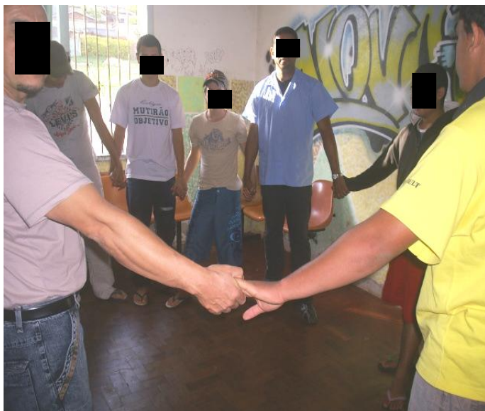
Figura 07 - Momento da espiritualidade

Nos momentos que eles denominam “momentos de espiritualidade”, realizam leituras bíblicas, conversam e refletem sobre suas passagens, rezam. No final, todos se levantam, dão-se as mãos, fechando o círculo e rezam uma oração, comprida e decorada pelo grupo, “para que Deus continue nos ajudando a ter força para buscar uma vida melhor” (fala de um dos monitores). (Diário de campo - 28/08/2008)