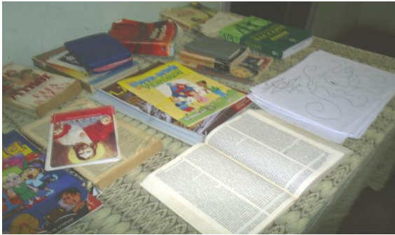
Figura 03 - A biblioteca da Casa

Jesus com as inscrições “Abençoado seja” e “Acredite em si”. Tudo isso compartilhando espaço com um trabalho de grafite 27 (em uma das paredes), em que está ilustrada a imagem de um adolescente da contemporaneidade.