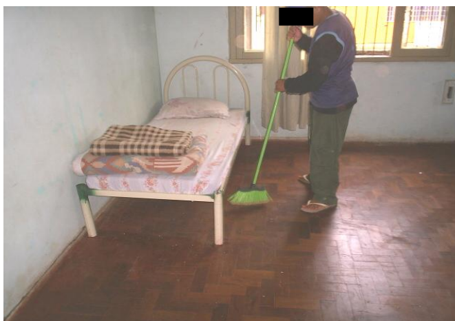
Figura 10 - Laborterapia - serviços domésticos

Na perspectiva da Casa , o trabalho pode ter uma função preventiva, na medida em que pode impedir os Meninos de se envolverem com as drogas e, conseqüentemente com a criminalidade, ou seja, ao ocuparem seu tempo com o trabalho, não teriam tempo para se envolver com o mundo do crime, concretizando o dito “mente vazia é oficina para o diabo”. A instituição investe-se do trabalho como caminho importante e responsável pela desconstrução de uma possível identidade marginal.