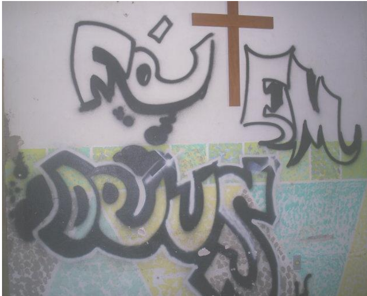
Figura 06 - "Fé em Deus" - parede grafitada

Em uma das paredes da sala de reuniões e onde se realizam os momentos de espiritualidade, há um grande crucifixo em torno do qual foi grafitado "Fé em Deus". O grafite foi feito por um dos adolescentes, segundo os monitores, para incentivá-lo nessa habilidade artística. (Diário de Campo - 28/08/2008)