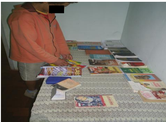
Figura 04 - “Escolha” sobre o que se deseja ler

O lugar destinado para expor os livros (biblioteca), fica em um corredor, entre o refeitório e os quartos. Estão sobre uma mesa: várias bíblias, revistas e livros intitulados: Livro da Família, O fruto da vida, Mantenha-se vigilante, O super-herói da verdade, Jesus vence a morte, Drogas -cartilha mudando comportamentos, O valor das pequenas coisas, O paraíso recuperado, Os doze passos, História de amor entre outros dessa natureza. E uma fala recorrente entre os profissionais que ali trabalham, nesse espaço é: CC - “se salvam os meninos que seguem uma religião, qualquer uma, mas é preciso ter fé em algo superior, crer em Deus.” (Diário de Campo - 08/08/2008)