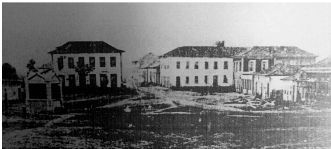
Figura 1 - Rio Novo 1875