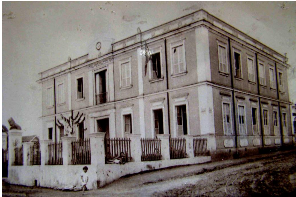
Figura 4 - Escola Normal Doutor Basílio Furtado