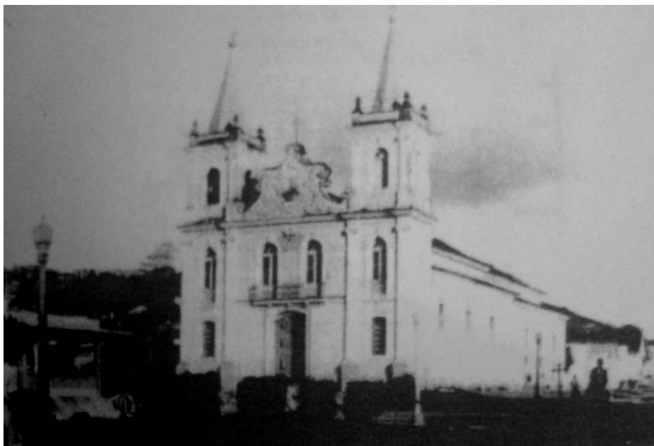
Figura 3- Igreja Matriz localizada no Jardim Municipal, hoje Praça Marechal Floriano

No ano de 1904 foi instituída uma comissão para formar o Sodalício de Nossa Senhora da Consolação com o intuito de erigir o hospital Santa Casa de Misericórdia, que atualmente está parcialmente 11 fechada por motivos financeiros e roubo de equipamento. Para dar suporte não só ao hospital recém aberto, como as casas residenciais e comerciais, no dia 23 de julho de 1908 Rio Novo tornou-se uma das cidades a receber energia elétrica da recém criada Companhia Força e Luz Cataguases Leopoldina.