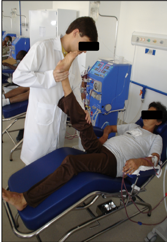
Figura 1 – Alongamentos de membros inferiores durante a HD.

A etapa de condicionamento envolveu a realização de exercício aeróbico por 30 minutos (Figura 2). Nesta etapa, a intensidade do treinamento foi individualizada e determinada com base na escala de Borg, aplicada a cada cinco minutos. Considerávamos o trabalho como satisfatório quando o paciente atribuía ao esforço valores entre 11 e 13 pontos nesta escala (exercício leve a um pouco intenso). A FC foi monitorada por meio de um cardiofrequencímetro da marca polar modelo F1. Inicialmente, o tempo de exercício aeróbico aplicado dependeu da tolerância de cada paciente, mantendo a intensidade do exercício sempre constante, em 50RPM.