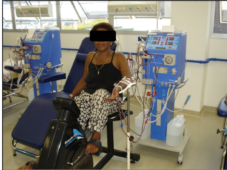
Figura 2 – Exercício aeróbio durante a HD.

O resfriamento consistiu de dois a três minutos de exercício aeróbio com a carga de 0,5 kpm e rotação de 35 rpm e, novamente, alongamento passivo de membros inferiores. A PA era aferida no repouso, a cada 5 minutos da fase de condicionamento e após o resfriamento.