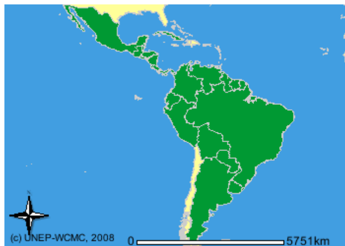
Figura 2 – Países com relato de ocorrência de Cuniculus paca em verde (UNEP-WCMC, 2008)

Poucos são os dados a respeito da biologia reprodutiva da paca. Sabe-se que a paca atinge a maturidade sexual em torno de 10 meses de idade, seu período de gestação