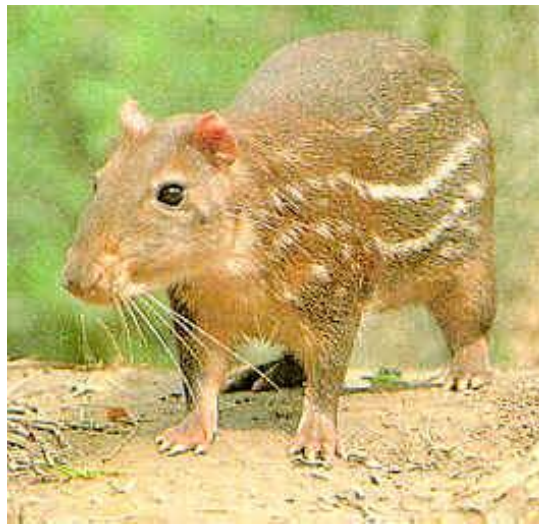
Figura 1 – Paca ( Cuniculus paca )

unhas muito afiladas, apropriadas para cavar as tocas (Figura 1). Os dentes incisivos são grandes, muito afilados e de crescimento contínuo. Essa espécie se alimenta de folhagens, frutos, sementes, castanhas e raízes, sua longevidade varia de 10 a 15 anos na natureza e cerca de vinte anos em cativeiro (OLIVEIRA et al., 2007). Essa é a segunda maior espécie de roedor da América Latina (MATAMOROS, 1982) e se distribui desde o sul do México até o Paraguai (Figura 2), habitando regiões de florestas tropicais, geralmente próximo a cursos de água (MONDOLFI, 1972).