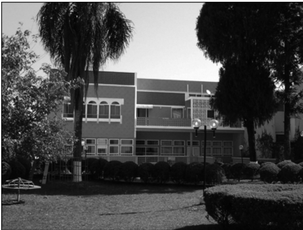
Atual sede da Sociedade Beneficente Muçulmana do Paraná, no prédio inaugurado na década de 1960, no Alto do São Francisco, Centro de Curitiba. Foto de 2006 FONTE: Acervo do autor

O crescimento da comunidade e o nascimento dos filhos e netos em um ambiente não-islâmico despertaram entre os mais velhos o receio de que a cultura árabe muçulmana se perdesse. A escola se constituiria, então, ao lado da família, em mais um espaço de afirmação e preservação da cultura dos antepassados, no qual se daria a transmissão da tradição islâmica ao longo das gerações futuras.