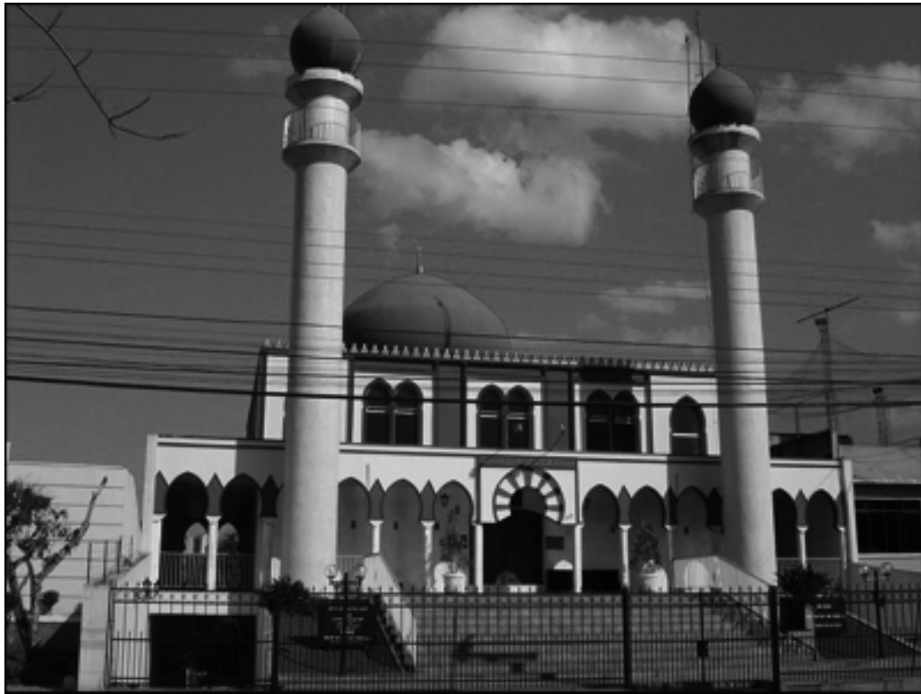
A Mesquita Imam Ali Ibn Abi Talib: ponto de contato com o divino e centro de convivio social da comunidade Islâmica de Curitiba. Foto de 2006

Persistia, porém, uma outra necessidade: onde enterrar os mortos? A religião islâmica exige o enterro do falecido, ou seja, a colocação do corpo na terra, e não o simples sepultamento em urnas de concreto. A preocupação com o fato surgiu já quando da fundação da Sociedade Beneficente Muçulmana e acompanhou a comunidade ao longo dos anos. Antes de contar com um local mais apropriado, os muçulmanos de Curitiba compraram um espaço no Cemitério da Água Verde, empregando o expediente de sepultar os mortos num jazigo, que tinha capacidade para não mais que 120 corpos. Além de premidos pela dificuldade em obter terreno disponível para acomodar o cemitério, os