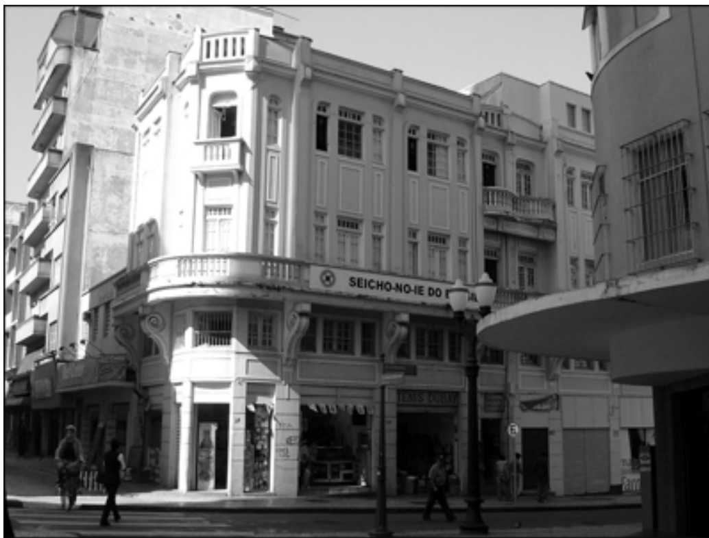
A primeira sede da Sociedade Beneficente Muçulmana do Paraná, no segundo andar deste edifício, na Rua do Rosário, esquina com a Praça Tiradentes, Centro de Curitiba. Foto de 2006

funcionamento, enquanto se manteve na Rua do Rosário, a sede da Sociedade era utilizada apenas para reuniões sociais.