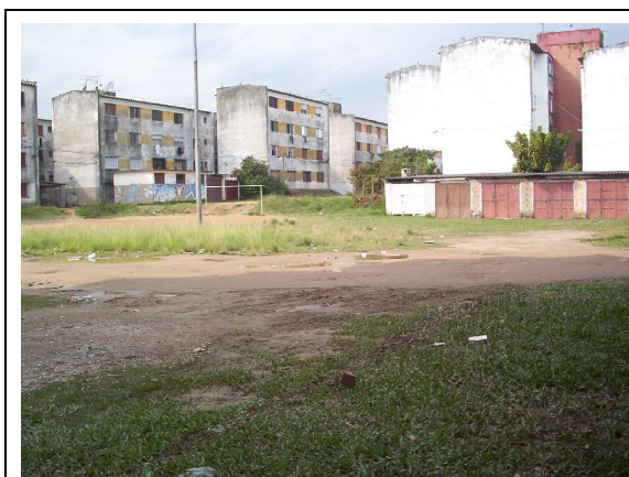
Quadra de futebol na Restinga Nova.