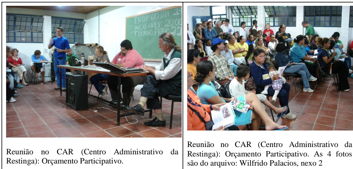
Reunião no CAR (Centro Administrativo da Restinga): Orçamento Participativo.