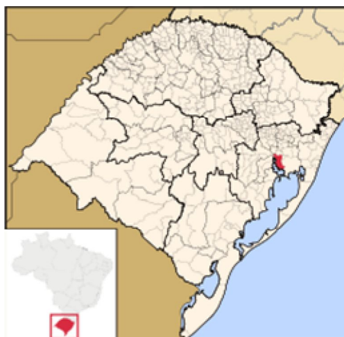
Foto: Estado do Rio Grande do Sul o ponto vermelho é Porto Alegre 38 .

A cidade de Porto Alegre não é uma simples metrópole, é um espaço social, é um lugar que se reproduz ao gerar e potencializar forças dinamicamente possíveis nesse espaço e para esse espaço.