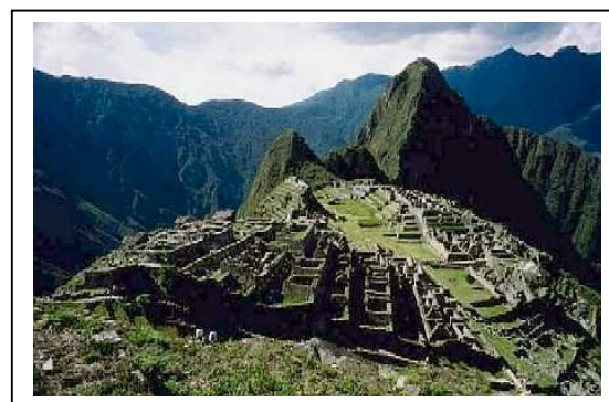
Fotos de cidades antigas, tomado de Enciclopedia Encarta, Archivo fotográfico Oronoz/Art/Resouce

Por isso a cidade ocupa um espaço importante na vida e no desenvolvimento dos homens, pois concentram vivências e experiências educativas, comerciais, culturais que transmitem valores, princípios, cosmologias, mitos e saberes. As palavras de Jaume Trilla Bernet (1997), aprender na cidade, aprender da cidade e aprender a cidade 12 , ilustram muito bem como a cidade tem um papel dinâmico como espaço de convivência e de transmissão cultural.