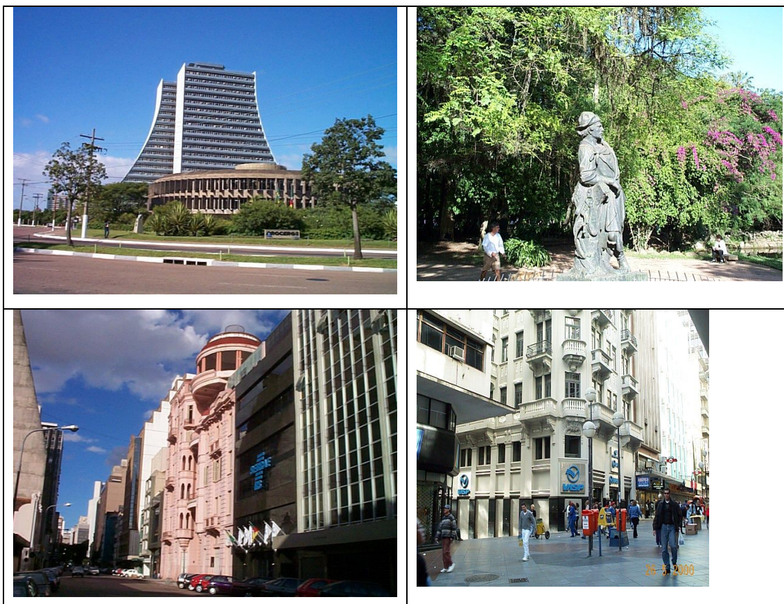
Fotos de Porto Alegre 36

Porto Alegre é uma cidade portuária do sul do Brasil, capital do Estado do Rio Grande do Sul. Está situada no litoral da Lagoa dos Patos, uma enseada do oceano Atlântico, na confluência de cinco rios. É o principal centro comercial do sul do Brasil.