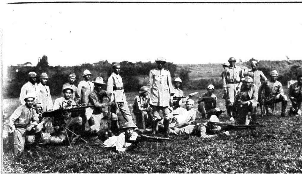
No “front” paulista. — Companhia de Metralhadoras do 23 B. C., do Ceará, nos arredores de Pindamonhangaba, Estado de S. Paulo.