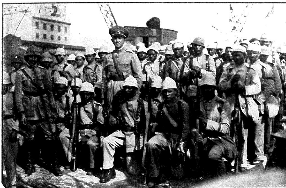
A tropa do 1.º Batalhão Provisorio do Ceará chegado pelo «Itanagé».