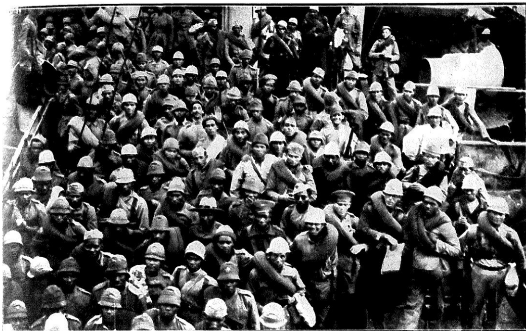
Tropas do Norte chegadas pelo «Poconé». — Um contingente do 23.º B. C. e outro do Piahy.